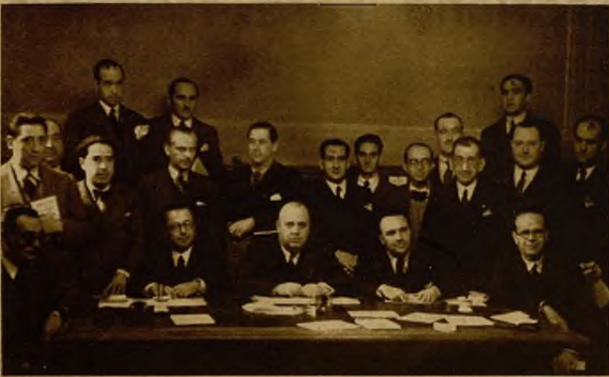
En el Congreso se reunió la Comisión parlamentaria de Actas y Calidades, que designó presidente al ex ministro socialista don Indalecio Prieto