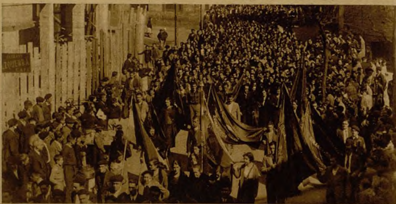
Otro aspecto de la manifestación celebrada en Eibar en memoria de las víctimas de los sucesos de octubre, a su paso por las calles de la población