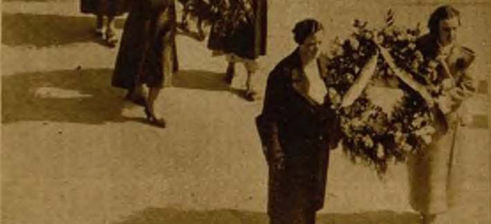
En Eibar se ha celebrado una manifestación cívica, a la que asistieron numerosas señoras y señoritas, portadoras de ramos de flores. La manifestación a su paso por una de las calles de la ciudad