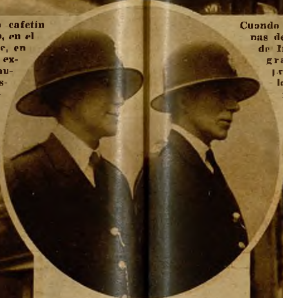
Cuando asoman por las esquinas de las calles de la capital de Inglaterra las temibles y graves "policewomen" se produce gran revuelo en los rincones que habitualmente ocupan las "importadas"

La Policía inglesa se halló ante la evidencia de un crimen cometido con todas las características de los de los "gangsters" de Norteamérica, y por eso en Scotland Yard reina desde entonces—mediados del mes de enero—una actividad extraordinaria. Al principio se pensó en la posibilidad de que se tratase de un crimen cuyo móvil había sido el robo, porque Max, el "Rojo", era muy conocido en los establecimientos de bebidas de Londres, que frecuentaba para vender joyas de segunda mano entre los patrocianados. Pero las rápidas investigaciones llevadas a cabo pusieron de manifiesto que esta profesión del muerto no era sino una pantalla que cubría otros tráficos.