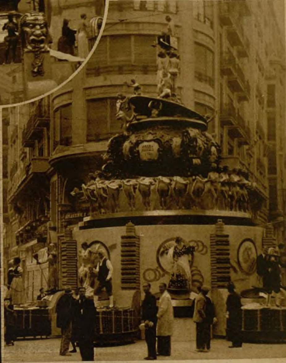
En el círculo, la falla erigida en las calles de San Vicente y Góngora La que se ha levantado en la Avenida de Blasco Ibañeta