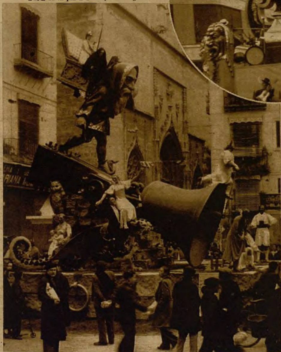
Falla erigida en la plaza del Collado