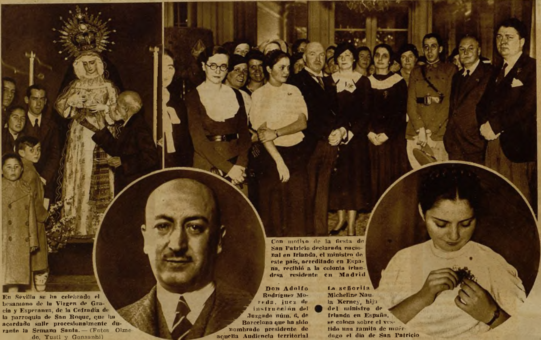
En Sevilla se ha celebrado el besamano de la Virgen de Gracia y Esperanza, de la Cofradía de la parroquia de San Roque, que ha acordado salir procesionalmente durante la Semana Santa.

La fiesta de San Patricio, nacional en Irlanda