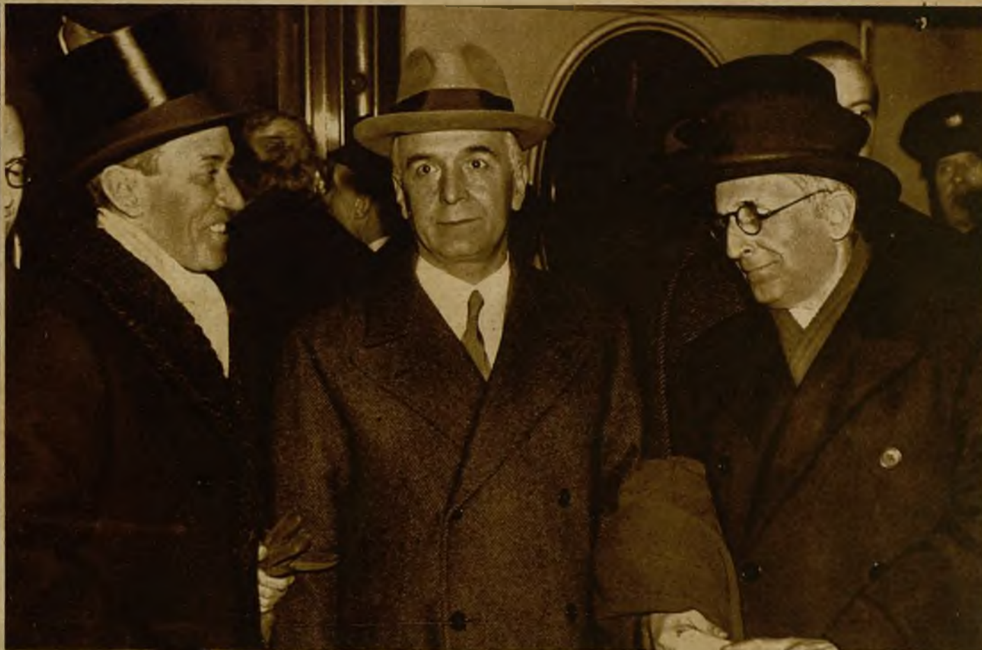
Nuestro ministro de Estado, señor Barcia, a su llegada a Londres, para asistir a las reuniones del Consejo de la Sociedad de Naciones, en unión del señor Madariaga, delegado de España en el organismo ginebrino, y del embajador español en Londres, señor Pérez de Ayala, que acudieron a recibirle.