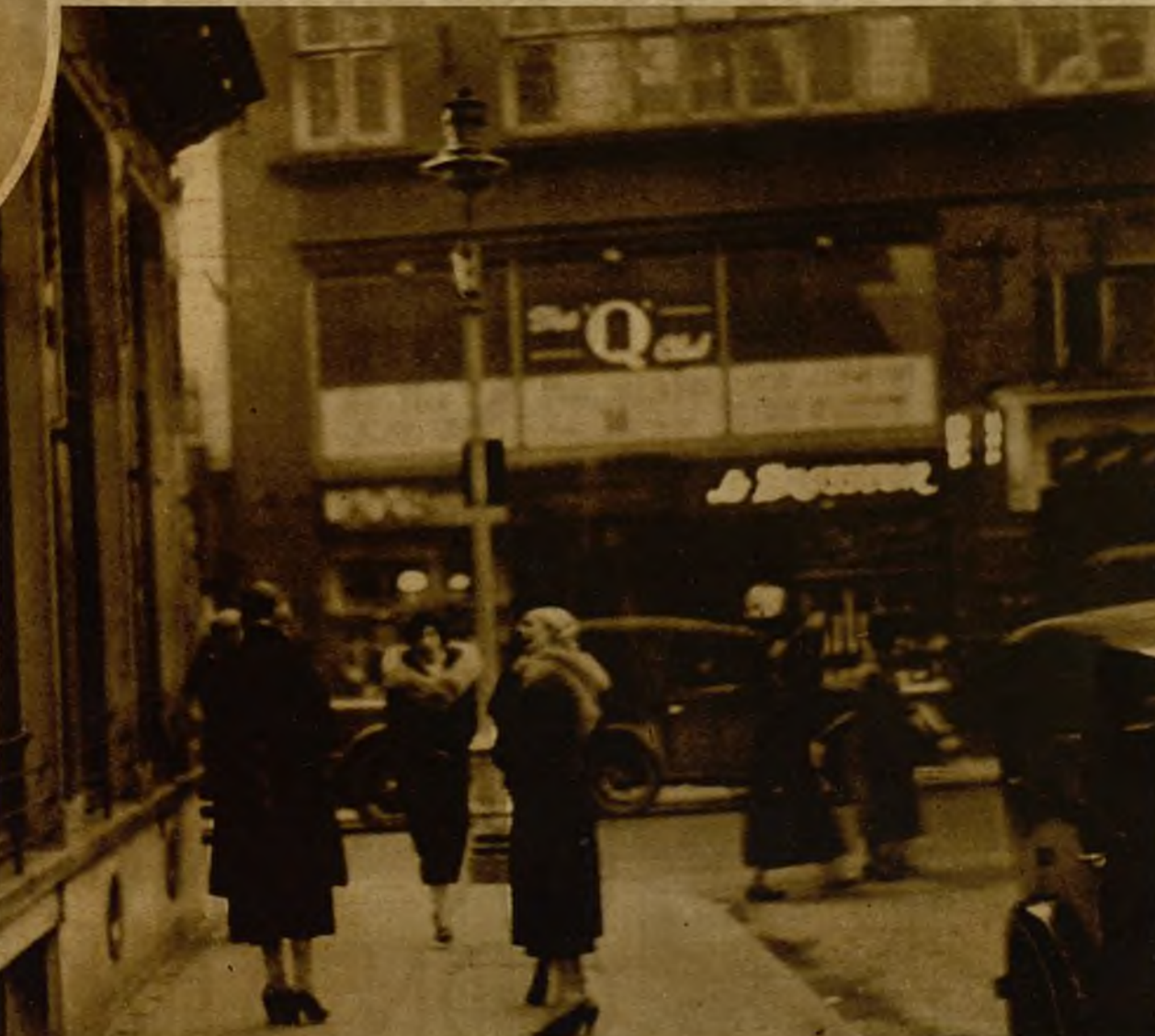
Las esquinas de Wandour Street y Gerrard Street, lugar de Londres siempre frecuentado por los maleantes

Las "girls" que están en las redes de la organización procedían, por lo general, de los distritos del Norte de