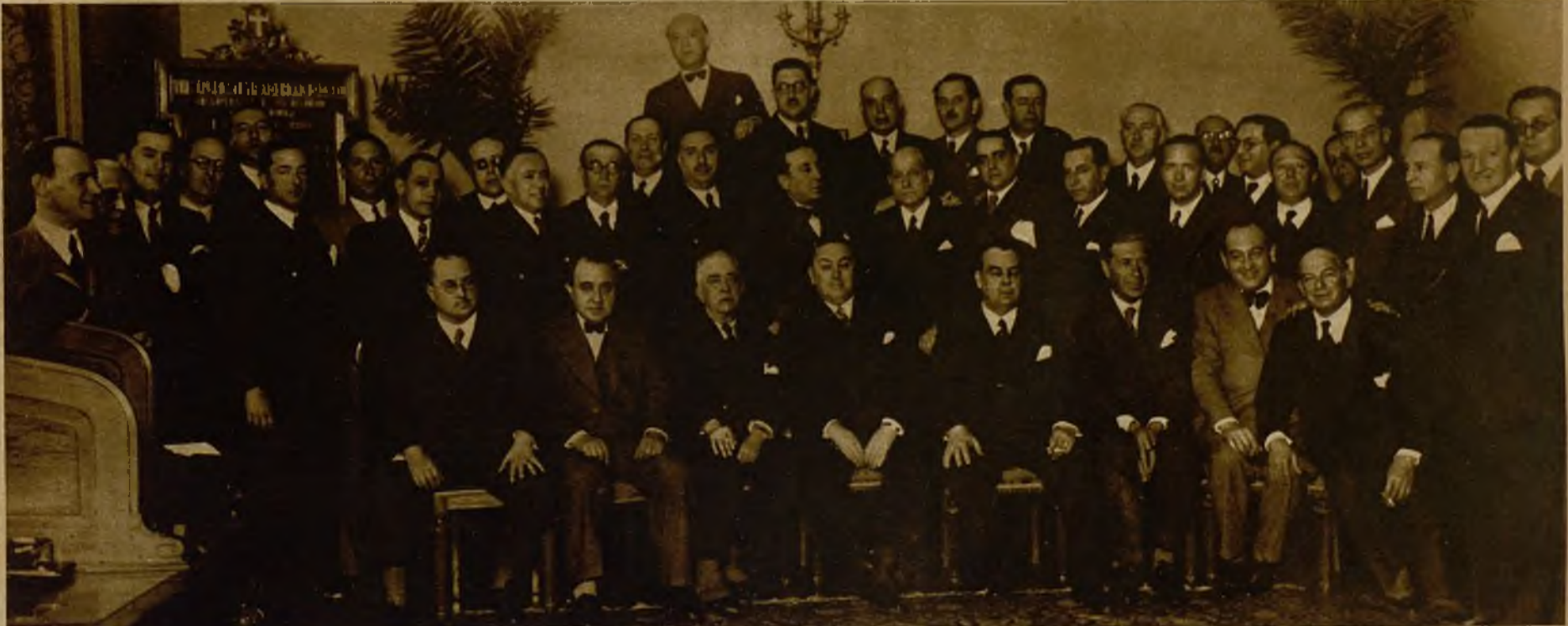
Los diputados electos del partido de Unión Republicana han obsequiado con un banquete a su jefe político, don Diego Martínez Barrio, con motivo de su elección para presidir las terceras Cortes de la República. Junto al señor Martínez Barrio aparecen los ministros de Justicia, Comunicaciones e Industria y Comercio, que representan al partido en el Gobierno