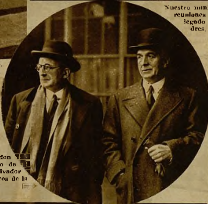
El ministro de Estado español, don Augusto Barcia, llega al Palacio de San Jaime en unión de don Salvador de Madariaga, uno de los miembros de la Delegación española