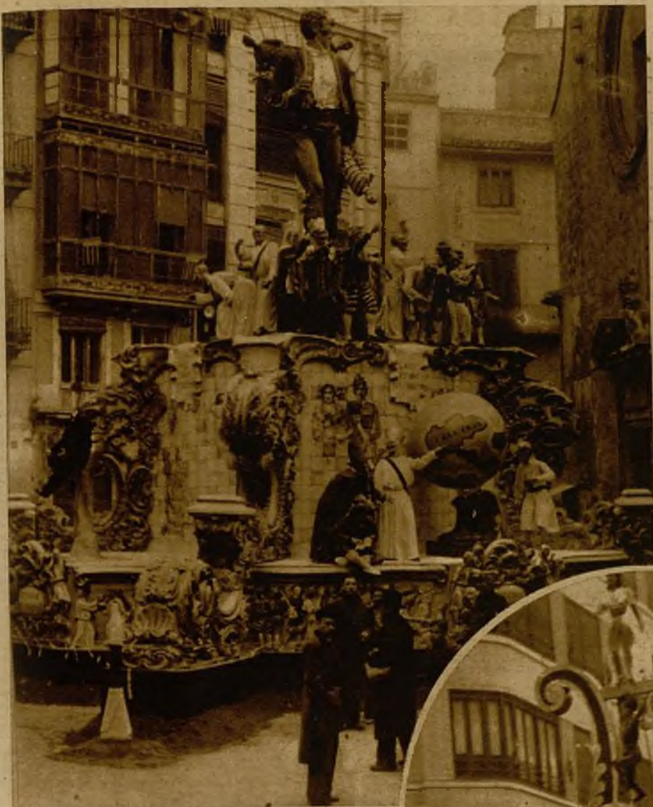
Falla de la plaza de Lope de Vega