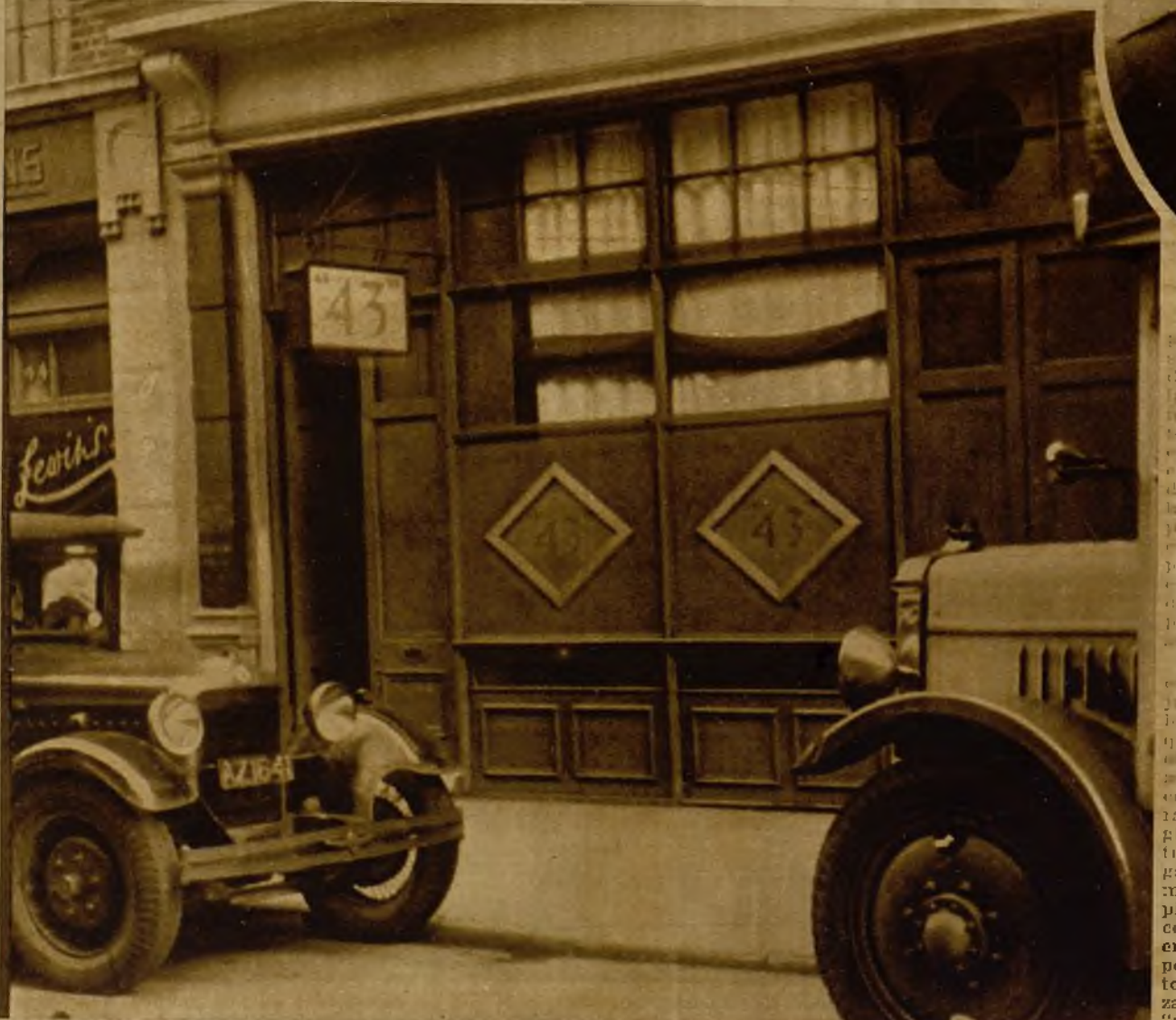
Entrada del famoso "43 Club", varios veces asaltado por la Policía en las "racias" contra el hampa londinense