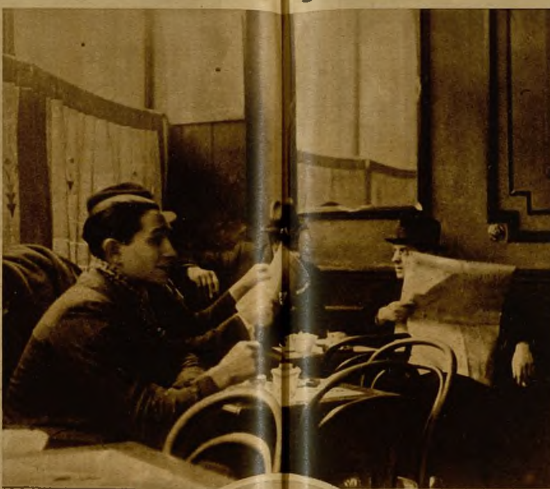
Un rincón de un típico cafetín de Soho, pacífico de suyo, en el famoso barrio londinense, en los que reina ahora una extraordinaria calma a causa de las actividades desplegadas en estos centros por las celosas detectives de Scotland Yard

Todas estas gentes, o por lo menos una gran mayoría de ellas, hombres y mujeres, son de procedencia extranjera en el país. Francia, Italia, Alemania, Polonia, Holanda, Bélgica y algunos Países Bálticos son el lugar de origen de esta ración del hampa londinense. Antes de la guerra mundial, cuando todavía se podía desembarcar en la Gran Bretaña sin pasaporte ni documentación de ninguna clase, se veían millares de vendedoras de placer por las calles de Londres. Solían reunirse por nacionalidades en cafés, restaurantes y bares, muchos de los cuales no existen ya. Las alemanas, por ejemplo, iban al Globe, y allí se las veía, inconfundibles por lo rubias y rollizas, consumiendo hocks de cerveza y fumando "Murats" de lujo. Las francesas frecuentaban el Royal, café de Regent Street que todavía sigue siendo el centro de Londres cosmopolita, y daban a este establecimiento, con su presencia, sus arretrados y su charloteo, un aspecto igual al de cualquier café de los bulevares de París, y los "saloons" de algunos "pubs houses" (lugares donde se expendían bebidas) famosos de Piccadilly Circus y Leicester Square eran los preferidos de las italianas y las de otras nacionalidades.