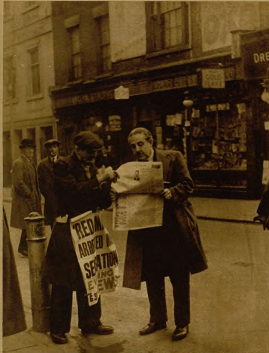
Max, "el Rojo", ha sido hallado muerto en un camino solitario de la campiña de los alrededores de Londres. Diez heridas de bala marcaban su pecho, uno de sus costados y su espalda, formando una línea indicadora de que el arma empleada para producir la muerte fue una de esas pistolas ametralladoras que emplean los "gangsters" de Chicago. La víctima de este crimen estaba en paños menores, y sus zapatos sin atar indicaban el apresuramiento con que se había realizado el acto final del drama. Es fácil imaginarse la escena: los asesinos le sorprendieron en el lecho, a punto de empezar a vestirse, y después de vaciar sobre él el cargador de la ametralladora de bolsillo, provista de un dispositivo especial para evitar el ruido, le pusieron el gabán y lo llevaron en volandas al auto, que esperaba ante la puerta de la casa, entre las neblinas de una noche de espesa niebla. El auto atravesó Londres, y cuando se llegó a un lugar propicio para ello, fué arrojado el cadáver entre unas matas, al borde del camino.