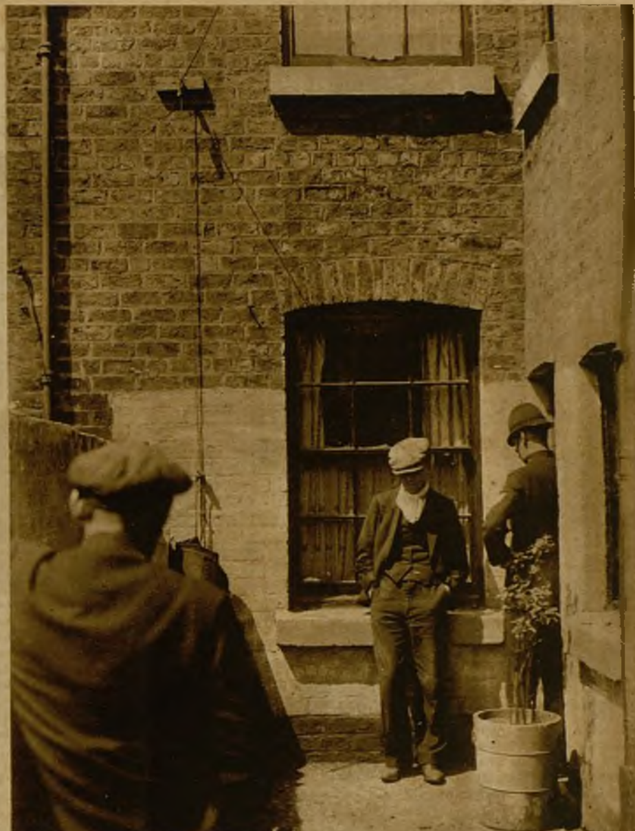
Scotland Yard no deja rincón sin registrar por el barrio de Soho, y los "policemen" hacen constantes investigaciones

Con el comienzo del sistema de pasaportes y del funcionamiento de la oficina para registro de extranjeros empezó una época difícil para los "souteneurs" y durante algunos años quedó Londres limpio de toda esta clase de indeseables. Pero últimamente se han vuelto a ver por las calles de Soho y por los cafés y