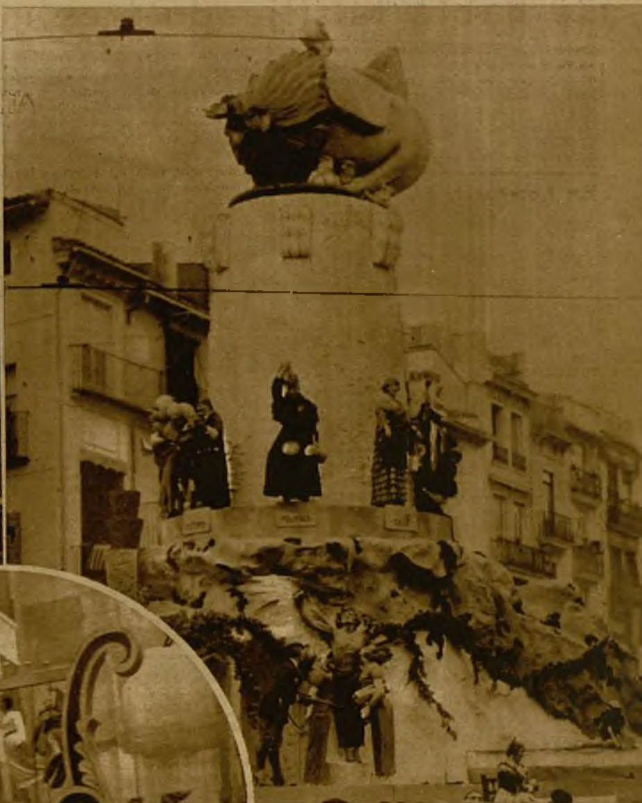
La falla levantada en la plaza del Mercado