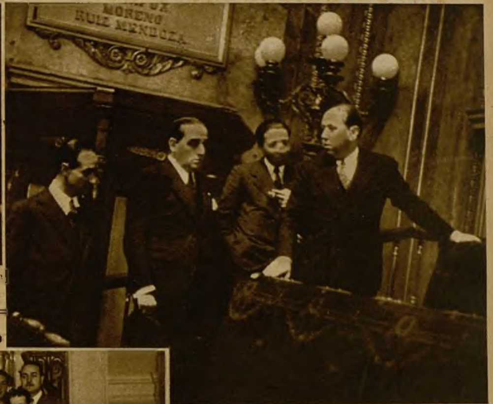
El presidente de las Cortes, de acuerdo con los grupos parlamentarios, ha hecho una nueva distribución de puestos en el salón de sesiones. En la "foto", los señores Gil Robles y Goicoechea examinando el sector que corresponde a las minorías que presiden