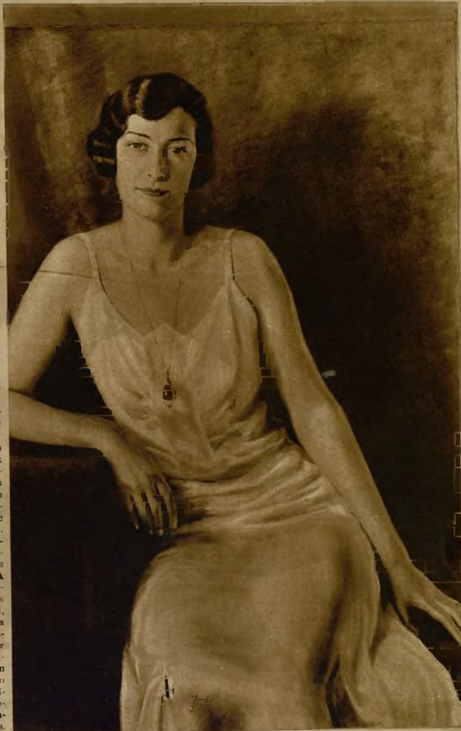
Retrato de la hija de la pintora, una de las notables obras que figuran en la Exposición de Thyra Ekwall de Ullmann

Para juzgar la pintura profesional es preciso situarse en un plano de apreciación subjetivo. No basta estimar la calidad intrínseca. Interesa tanto el objeto como el sujeto. En el juicio crítico entran por igual la pintura y el pintor, ya que en cierto modo el pintor aparece enraizado a una manera de la época. Es como un componente de la fórmula ac-