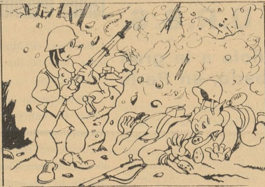
Tenía el alma templada pues no le asustaba nada.