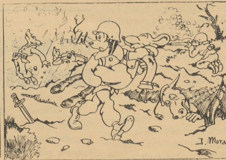
Micolín lo cogió en brazos escapando a largos pasos. (Continuará)