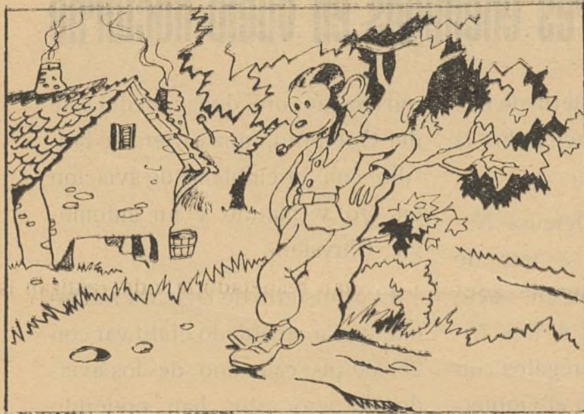
Erase un bravo soldado mono Micolín llamado.