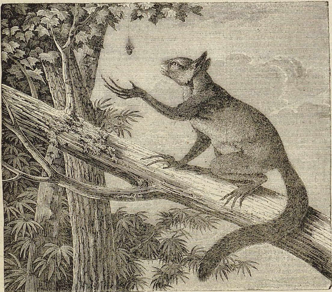
El aye aye.