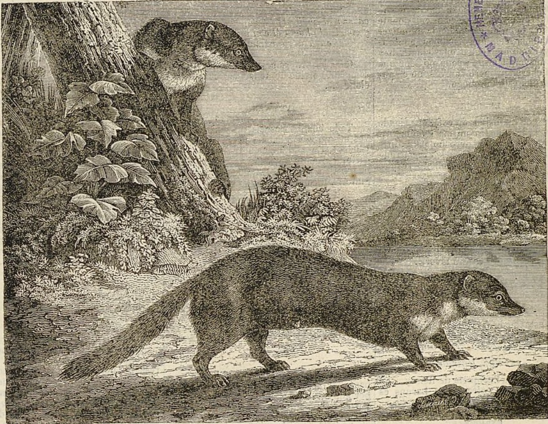
La marta zibellina.