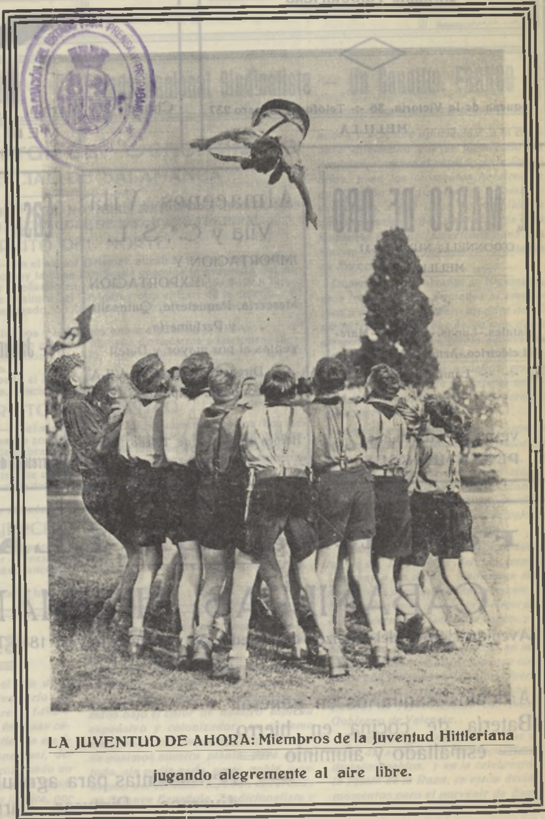
LA JUVENTUD DE AHORA: Miembros de la Juventud Hitleriana jugando alegremente al aire libre.