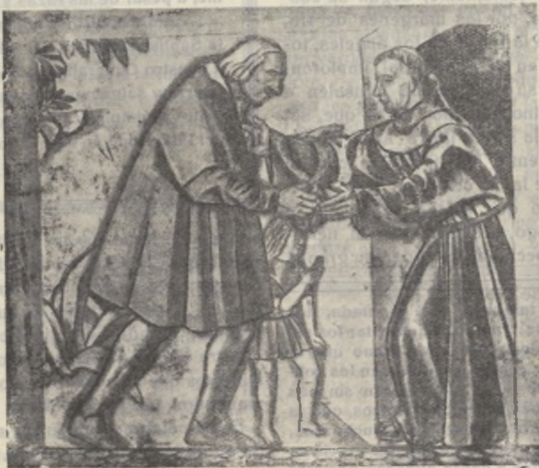
EL NAVEGANTE Y EL MONJE.--(Cartón para la pintura al fresco que Vázquez Díaz concibió para la Rábida y que se encontraba en tan histórico monumento devastado por los marxistas)