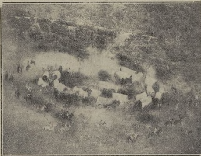
Cuando la tierra temblaba bajo el rebaño furioso

Han comprendido que para vivir felizmente lo mejor es vivir cada uno de por sí y... las