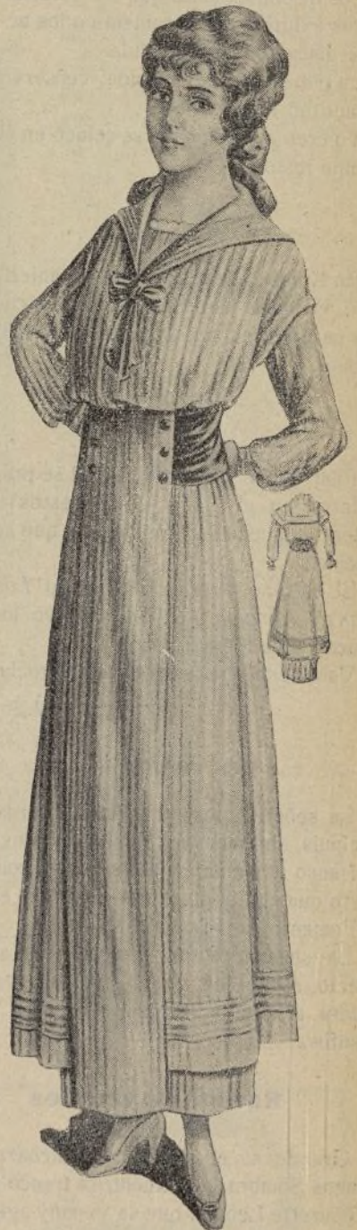
Traje asurcado, de color beige. La falda es doble y con un jaretón al través, y en el delantero, tabla hasta la cintura. Blusa marinera y adornos de seda negra.