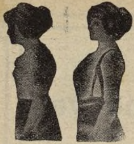
Sin Benefactor Con Benefactor