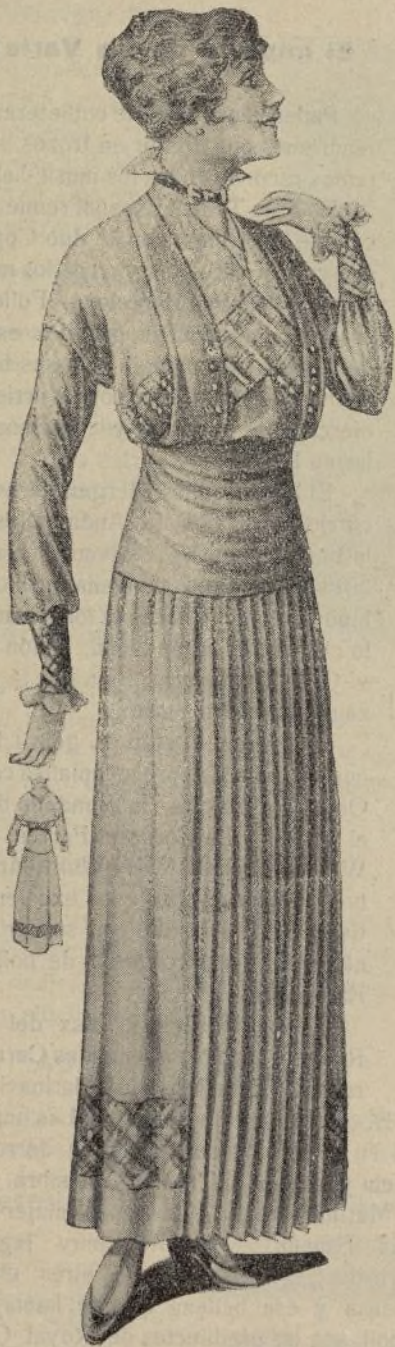
Lindo vestido de seda, de media capa al dorso de la falda, y plegado muy pequeño el delantero. La blusa tiene un coselete escocés, como el biés del bajo, y pechero y cuello de nipsis o encaje.