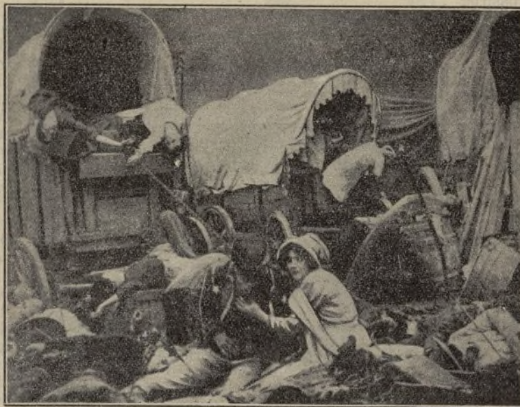
Cuando la tierra temblaba bajo el rebaño furioso

Llegada la noche escribe una canción titulada Final de un sueño , en la que confiesa haber asesinado al tabernero Broustel. Coge la canción, la clava en una estaca junto al río y luego se echa al Marne, hundiéndose