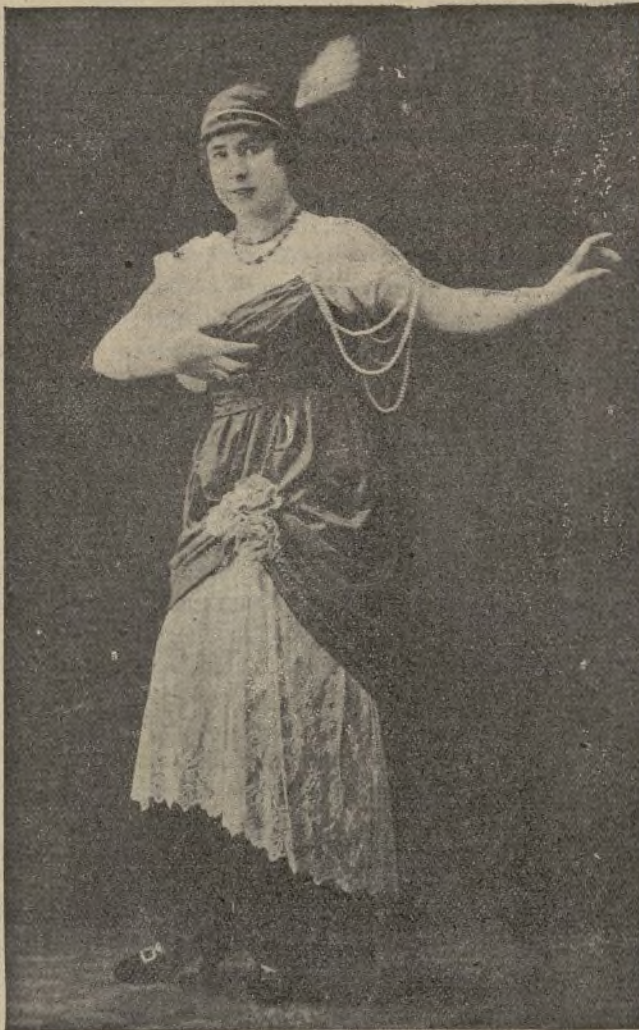
Sitalú, como cara, una preciosidad, y como artista, véanse sus éxitos en el Teatro madrileño, donde lleva escuchando grandes ovaciones desde hace más de dos meses.

Farmacia Paradell, : : Asalto, 28.-BARCELONA