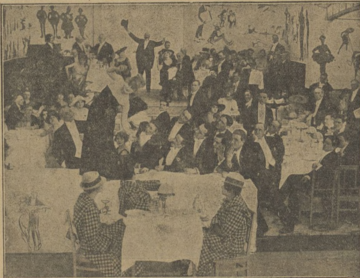
Una escena de la interesante película «Bailarinas»

Tamprano del día vemos ya el auto que conduce a Cecilia y al doctor, corriendo veloz por entre los campos, en dirección al ruinoso castillo de Tudor.