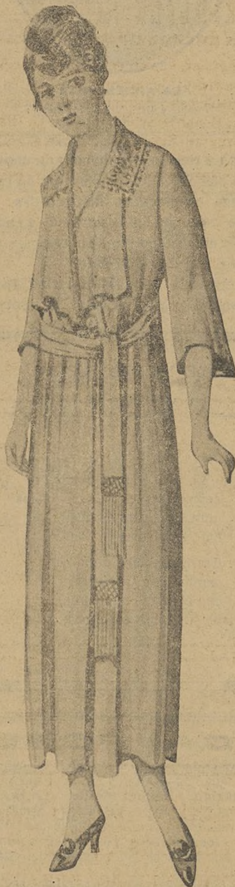
Bonita bata de muletón blanco, holgada y entallada ligeramente por faja de lo mismo, con remates de malta y cuello igual, manga perdida y anchas solapas que dan gracia al delantero.