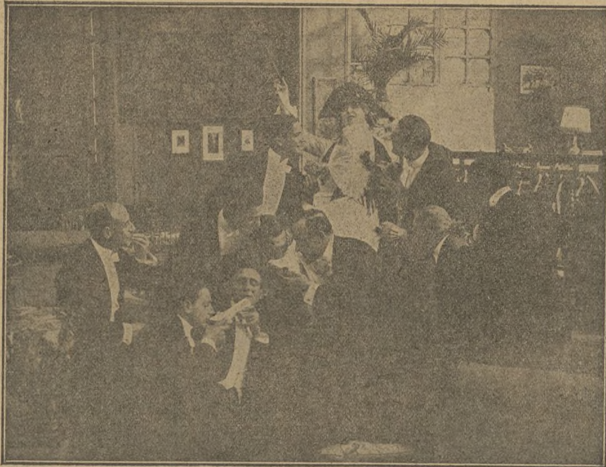
Una escena de la interesante película «Bailarinas».

—Hubiera sido imbécil — piensa el simpá-