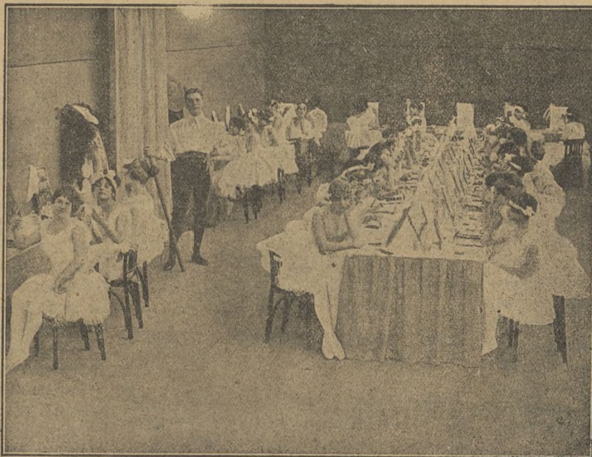
Una escena de la interesante película «Bailarinas»

Y no estaría de sobras de las autoridades de algunas grandes poblaciones, donde, de ocurrir algún siniestro, sus proporciones serían mayores por la gran cabida de sus locales de espectáculos, giraran alguna visita de ins-