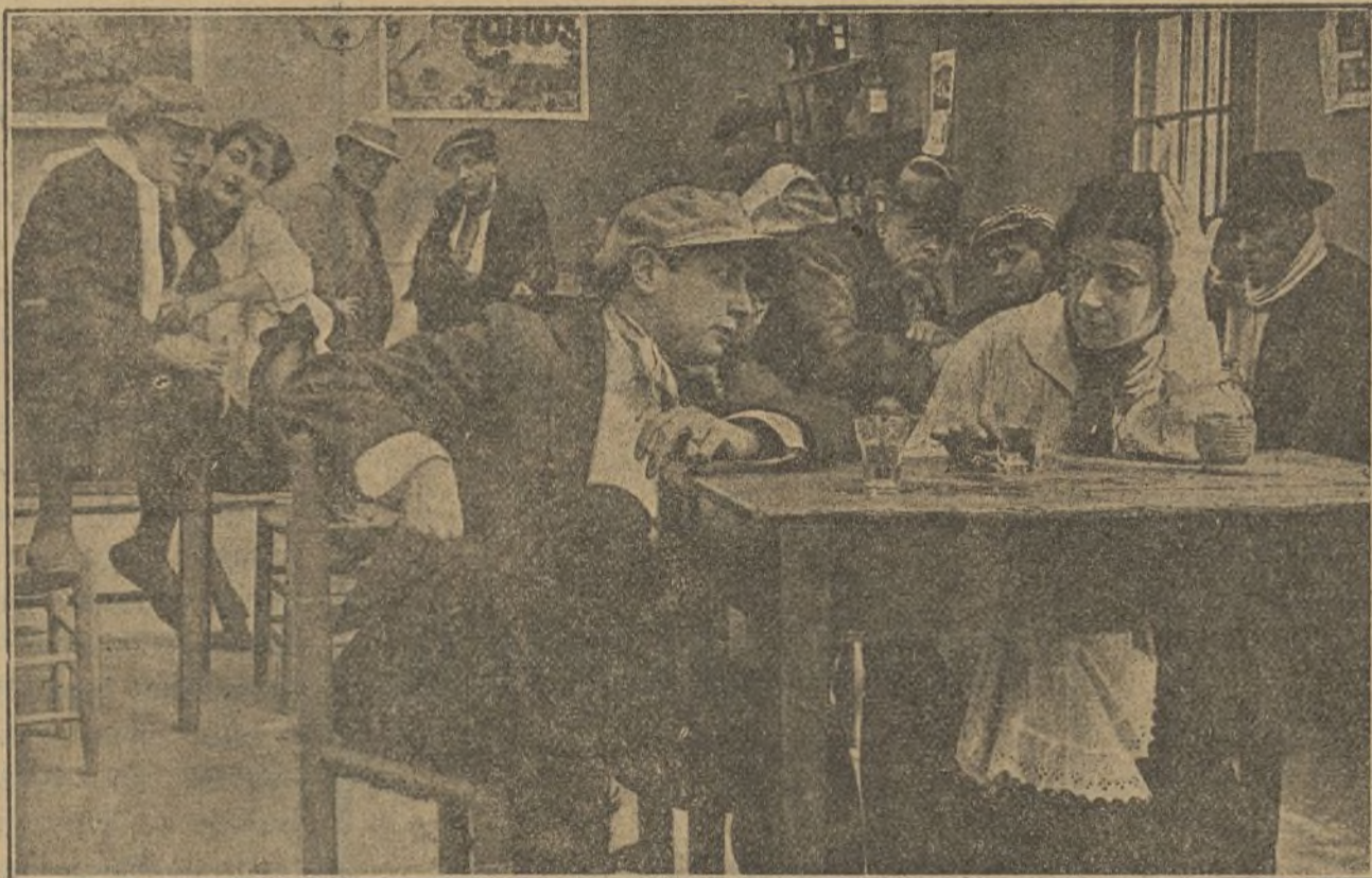
Una escena de la interesante película «Vindicador»

Bajo la dirección del maestro coreográfico Mr. Gibus, varias hermosas muchachas se ejercitan en la danza para poder tomar parte en los números de baile de las próximas gran-