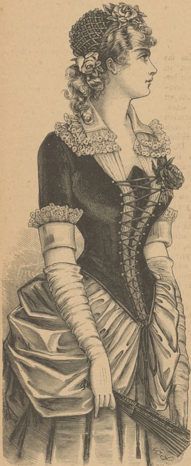
7. Vestido para teatro.

aseguradas las comunicaciones marítimas entre los grandes rios de la Siberia y el resto del mundo, ó sea la del Obi y del Yenisein con el Occidente y el Atlántico, y la del Lena con el Oriente y el Pacífico.