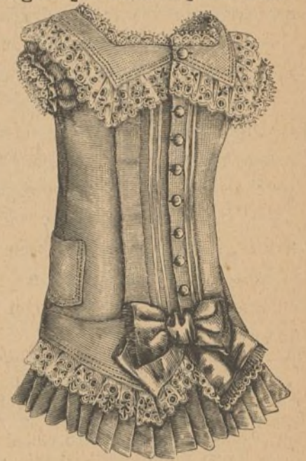
26. Espalda del vestido núm. 15.

Traje para recibir.— Es de raso brochado, y cachemir color vino de Burdeos. La falda consiste en un plissé, y encima un bullon. Delantal liso de raso brochado con flores de terciopelo. Túnica abierta formando paniers.