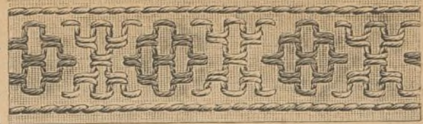
4. Cenefa bordada.

¡qué frios aparecen ante el más débil neófito cristiano, repitiendo con júbilo las oraciones del hijo de Nazareth! Él es á su vez orador, pintor, poeta, escultor, pronunciando los salmos y las leyendas de los Mártires y los Santos, contrastando con las fábulas de la mitología, los nombres de dioses y de diosas, los héroes y heroínas de Grecia y Roma, con sus constituciones políticas, su historia, sus leyes, su filosofía, su literatura, sus sábios y sus guerreros