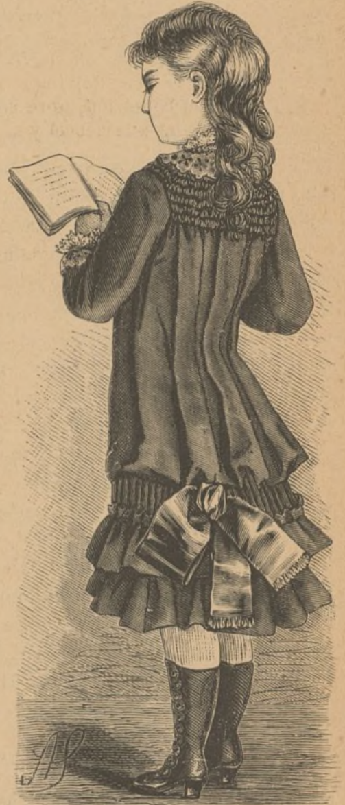
17. Vestido blusa.

Don Alfonso era ya conocido del pueblo gaditano, que habia tenido la honra de verlo desembarcar dos veces, casi seguidas, en este muelle, que han pisado tantas personas ilustres; no así Doña Cristina, pero ha conquistado en breve