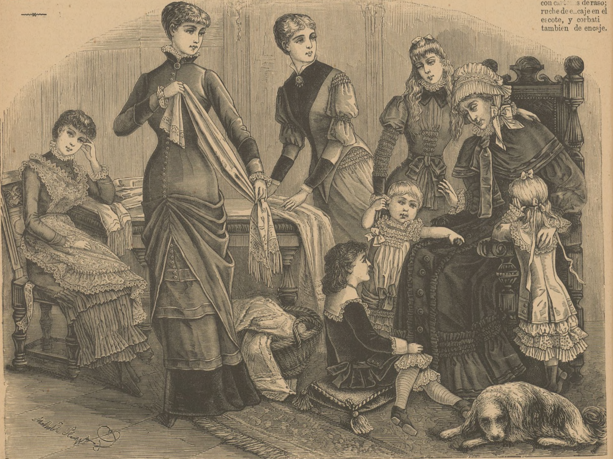
30 á 37. TRAJES DE CASA PARA SEÑORAS Y NIÑOS.

Esta túnica sale de debajo del cuerpo, y se recoge bajo el pouf con un gran lazo que desciende sobre la co a ligeramente recogida, y que llega hasta el plissé de la falda. Cuerpo de petos cortos cerrando por delante con cuello chal de raso brochado; mangas ajustadas con carteras de raso; ruche de encaje en el escote, y corbati también de encaje.