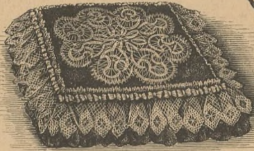
28. Caja para pañuelos.

artificial se funde mucho ántes de llegar á esta temperatura.— 2.º El ámbar natural apénas se altera en contacto del alcohol y del éter, mientras que el artificial se ablanda y disuelve en parte en estos líquidos.— 3.º Los pedazos de ámbar natural se adhieren entre sí con el intermedio de la potasa cáustica, y el ámbar artificial no se adhiere.