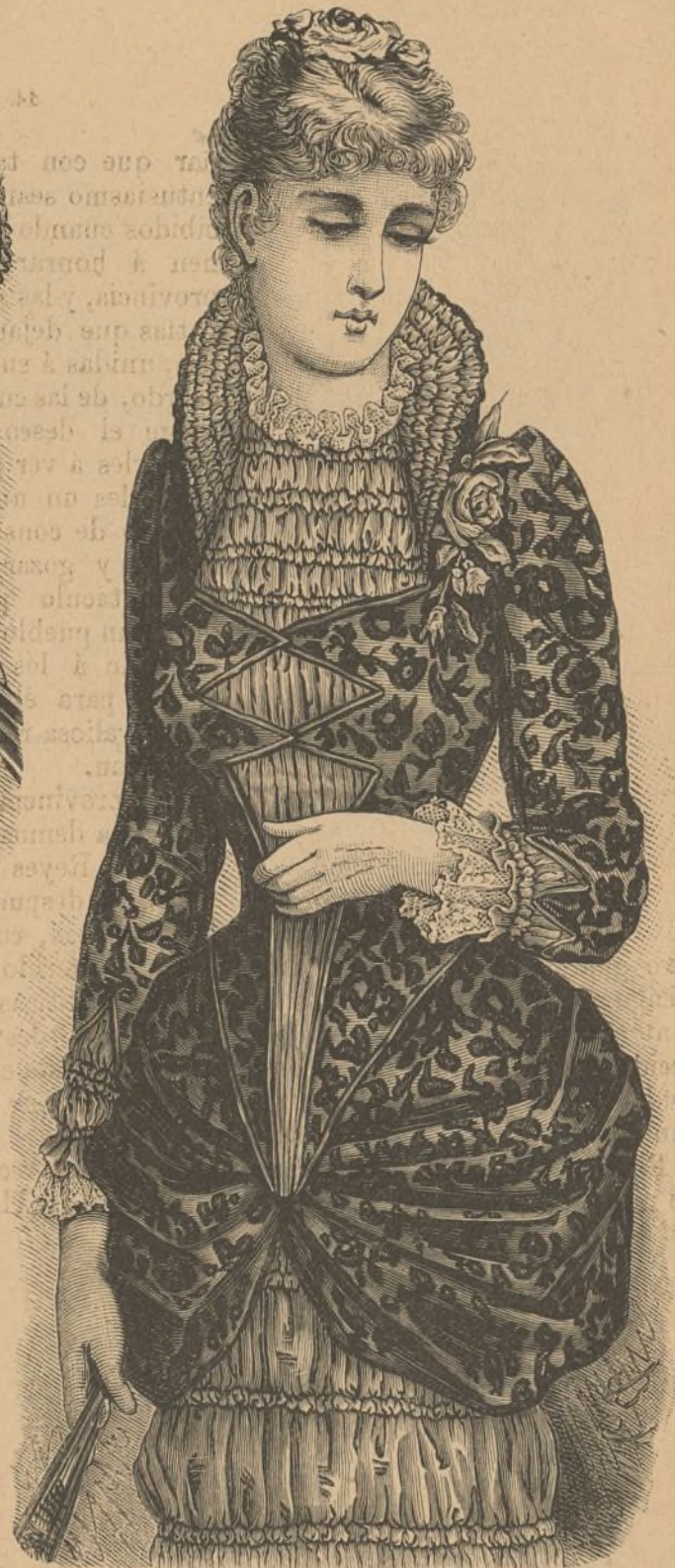
8. Delantera del vestido núm. 1.

supeditados enteramente á la religion de los sentidos, enteramente convertidos en organismos rebeldes contra el espíritu inmortal, que es la verdadera vida. Consumose el sacrificio del Hijo humilde de Nazareth.