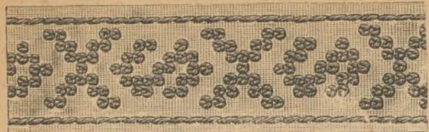
3. Cenefa bordada.

debieron su entusiasmo Colon y Vasco de Gama. Colon descubre las nubes que eclipsaban un nuevo continente, y Vasco de Gama dobla el cabo de Buena-Esperanza y da á conocer un nuevo camino para poder llegar á remotas comarcas de Oriente. Hoy tambien Nordeuskiold, inspirado por su educacion, abre con sus poderosos esfuerzos nuevas vias á la ciencia y al comercio, quedando