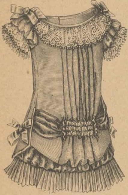
25. Delantero del vestido núm. 14.

Varios medios pueden emplearse para distinguir la falsificación, que son los siguientes: 1.º El ámbar natural se funde de 285º á 287º, mientras que el artificial se funde mucho ántes de llegar á esta temperatura.— 2.º El ámbar natural apénas se altera en contacto del alcohol y del éter, mientras que el artificial se ablanda y disuelve en parte en estos líquidos.— 3.º Los pedazos de ámbar natural se adhieren entre sí con el intermedio de la potasa cáustica, y el ámbar artificial no se adhiere.