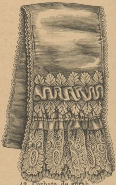
12. Corbata de surah.

Al meditar seriamente en el dolor de María al pié de la cruz, se lamentan aquellos tiempos en que la maternidad no habia ofrecido aún tan conmovedor ejemplo. Y así como la filosofía, la poesía, la elocuencia y bellas artes parecen flores místicas sin la magia de la estética cristiana, del mismo modo el hogar parece un desierto de esqueletos, si no se elevan allí preces cristianas