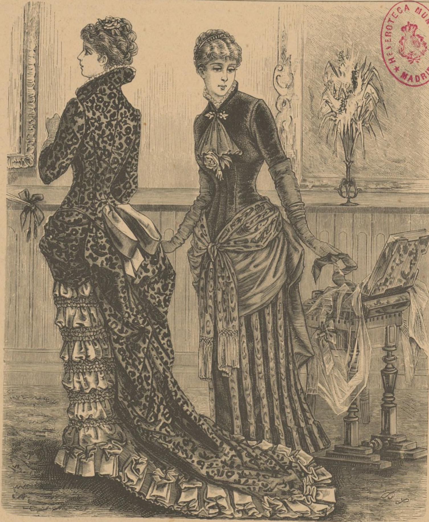
1 Y 2. VESTIDOS PARA SALÓN.

En cuanto a las formas de los trajes, creemos poder asegurar con esa doble vista que está obligada a tener la cronista para penetrar las oscuridades del porvenir, que las faldas lisas con adornos sólo en el bajo, serán las más usadas; se llevarán chaquetas bien entalladas, gé-