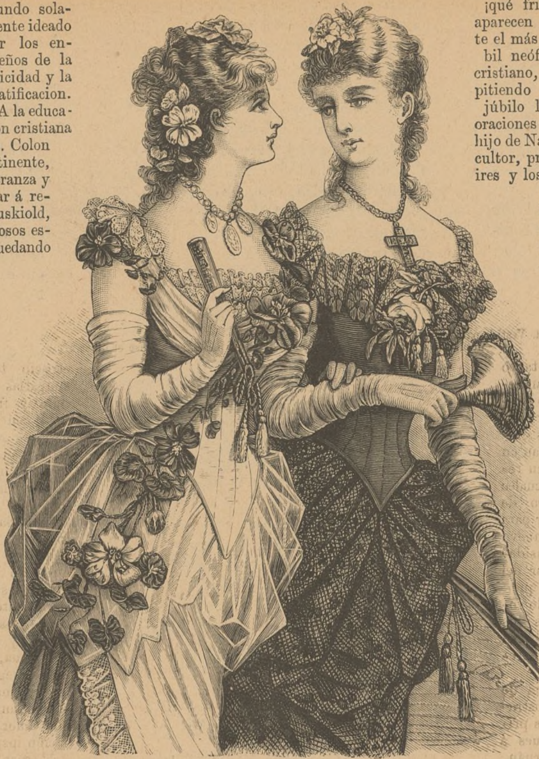
5. Vestido para baile.

al cielo, cumpliendo las prácticas de la Iglesia de Cristo. Aristóteles y Platon, con la fuerza y actividad de su palabra, y Homero, Demóstenes, Ciceron, Virgilio y Horacio, siendo modelos de portentosa elocuencia y poesía,