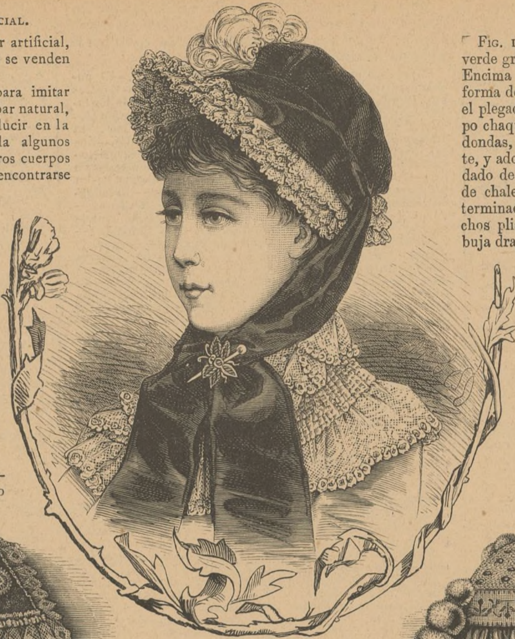
27. Sombrero para teatro.