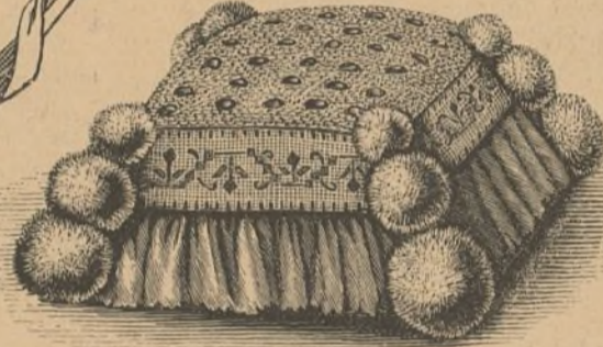
29. Aserico para horquillas.