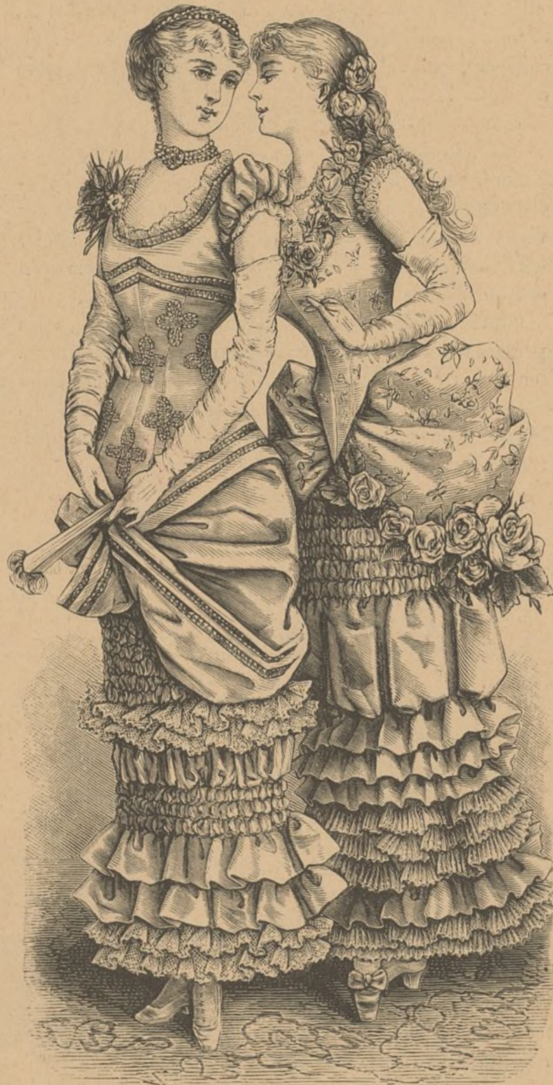
18 y 19. TRAJES DE BAILE PARA JÓVENCITAS. 18. Vestido con coraza. 19. Vestido con paniers.

Pocas ocasiones más grandes y sinceras habrá recibido ningún soberano, que la que á Don Alfonso XII ha