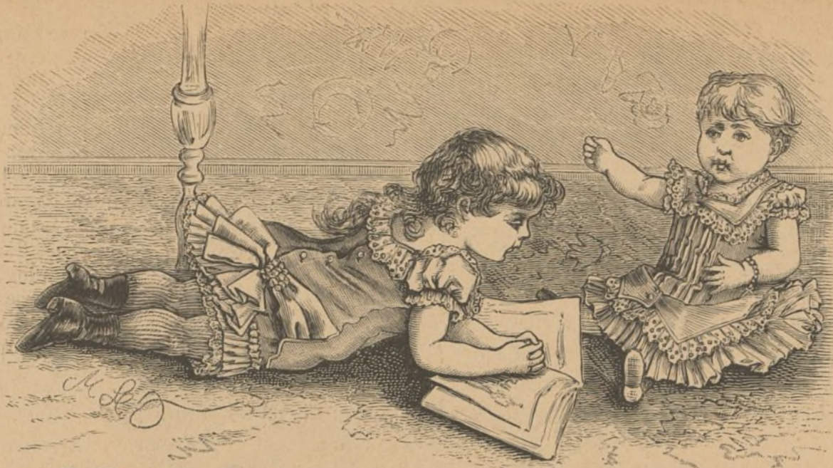
14. Vestido para niña. (Véase el núm. 25.)

reales en exquisita cortesía hacía los que ya oficial, ya particularmente les acompañan; hoy que sus visitas á los pueblos son completamente ajenas á planes ambiciosos, ni guerreros, y sólo revelan una prueba de consideración en los príncipes, y un motivo de animación y regocijo en los pueblos, no es de extra-