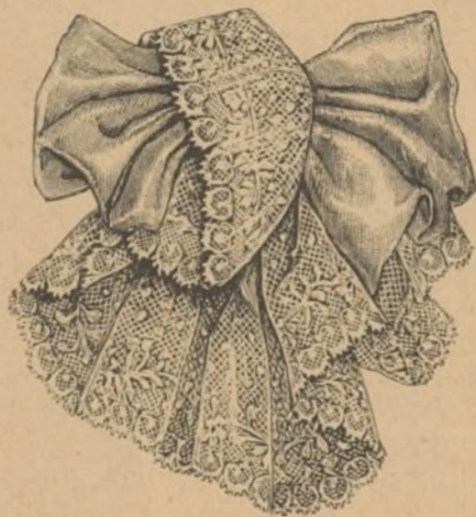
20. Corbata de muselina y encaje.

ofrecido Cádiz en su reciente viaje, así como á sus augustas esposa y hermana.