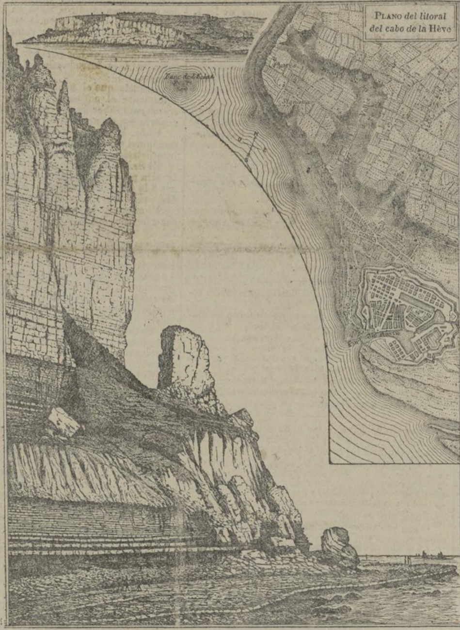
Plano y corte geológicos

Sobre cubierta irán colocados 12 cañones de 16 centímetros y en el puente ocho de 26. La tripulación será de 250 hombres y el coste de cada fuerte se evalúa en 10 millones de francos.