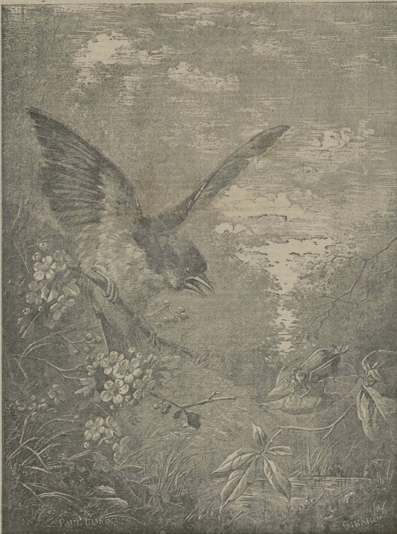
Un drama en el bosque.

Las constituciones políticas consignan entre los derechos del ciudadano, el de petición . Inútil trabajo! Mucho antes que los Garridos políticos lo consignasen en sus programas, ya lo ejercitaban los hombres de motu proprio . Por algo se inventó el refrán, «beba que no se abre Dios no la oye», el cual, expresado más gráficamente, no significa otra cosa que la locución vulgar «el que no llora no mama», que todos conocemos.