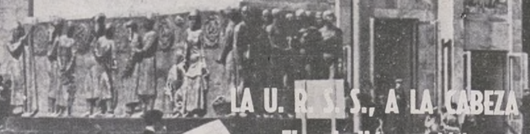
LA U. R. S. S., A LA CABEZA DEL MUNDO El pabellón soviético en la Exposición de Ayuntamiento de Madrid

IN CASO DELLA RESISTENZA SOCIALISTE 3-7-1937