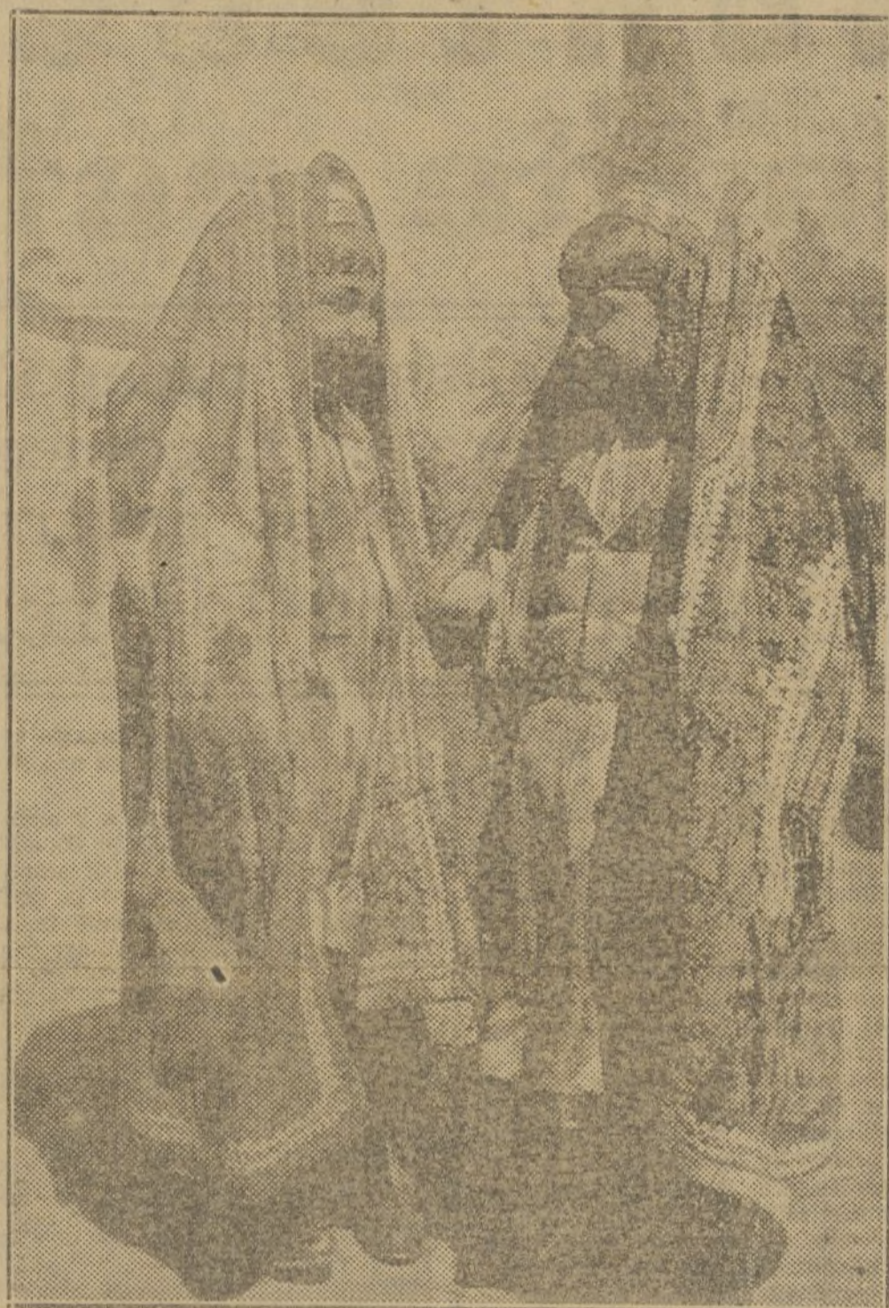
Tamar Chanum y Dielabari Chon pertenecen al grupo artístico de Uzbekistán, que ha representado el drama musical uzbec "Gubzara", en Moscú

1937, esta producción se elevó a más de 90.000 millones de rubios. Lo que significa que la producción de la industria ha aumentado en más de ocho veces con relación al nivel de antes de la guerra. Si a esto se añade que es solamente en 1926 cuando nosotros alcanzamos el nivel de la producción anterior a la guerra, se ve que el aumento de la producción en ocho veces su valor ha sido realizado los últimos ONCE AÑOS SOLAMENTE.