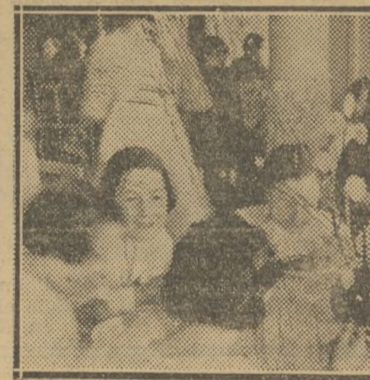
La comida es alegre

—Ya, hasta se me casan y todo. Esa tristeza con que se comenta la marcha de una, ese sabor amargo que no ha podido ocultar la directora, nos ha recordado muy fuertemente aquella sensación agudada