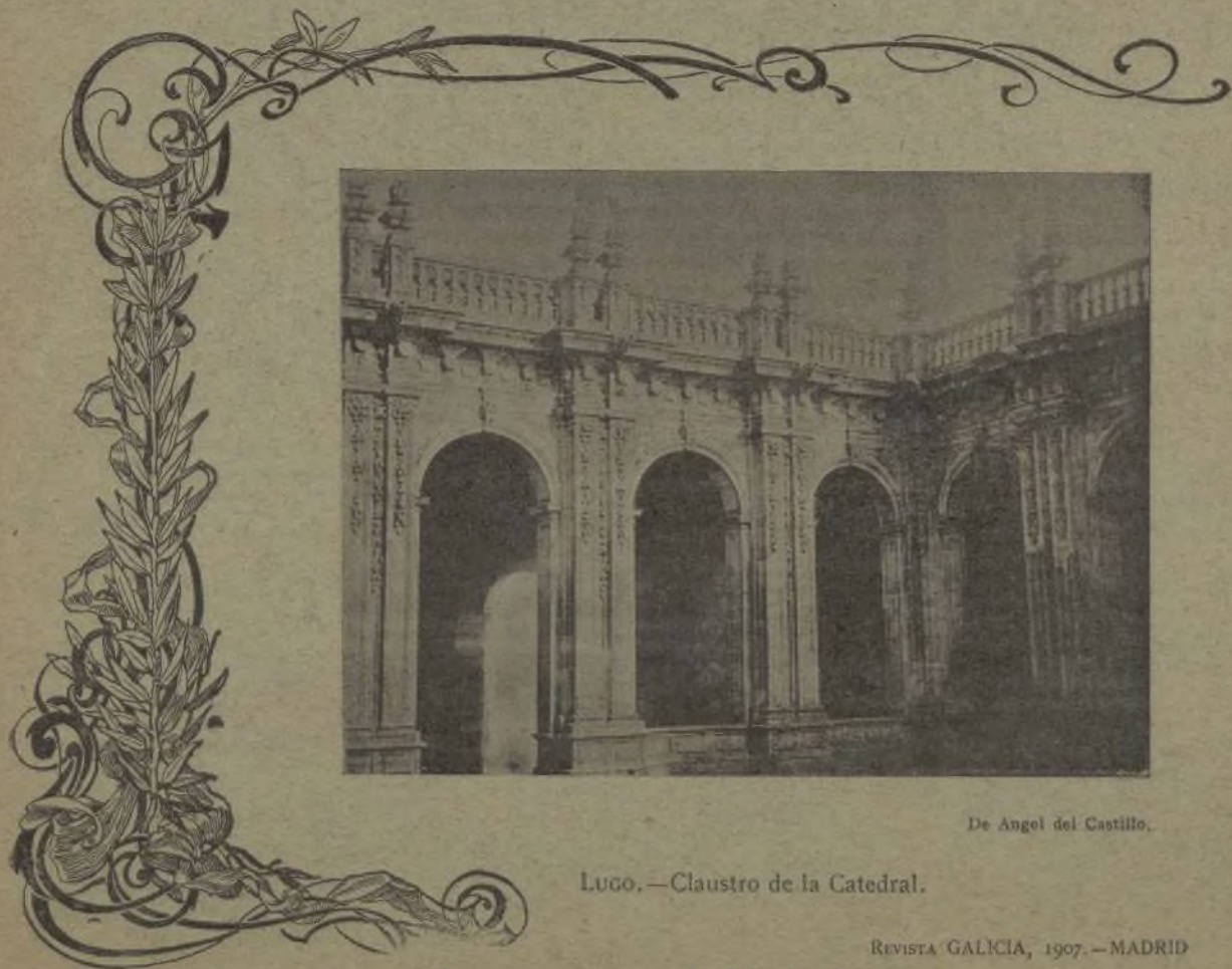
De Angel del Castillo.

Y ¡ jabur! mis queridos lectores y hasta otra quincena en que supongo que ya estará en vías de pacífico arreglo lo de Casablanca, naturalmente, merced á la penetración pacífica de la ayuda europea.