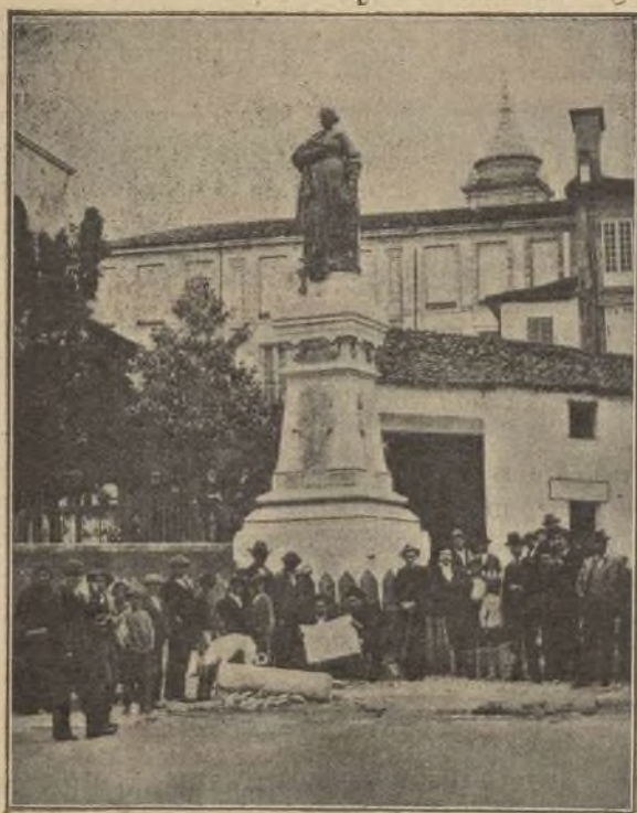
Estatua de Doña Concepción Arenal.

Para allegar recursos con igual objeto, celebróse en el teatro Tamberlick , de Vigo, en honor de la eminente socióloga, una solemne velada en la noche del 10 de Septiembre de 1897, y en la cual tomaron parte distinguidos escritores, literatos y oradores