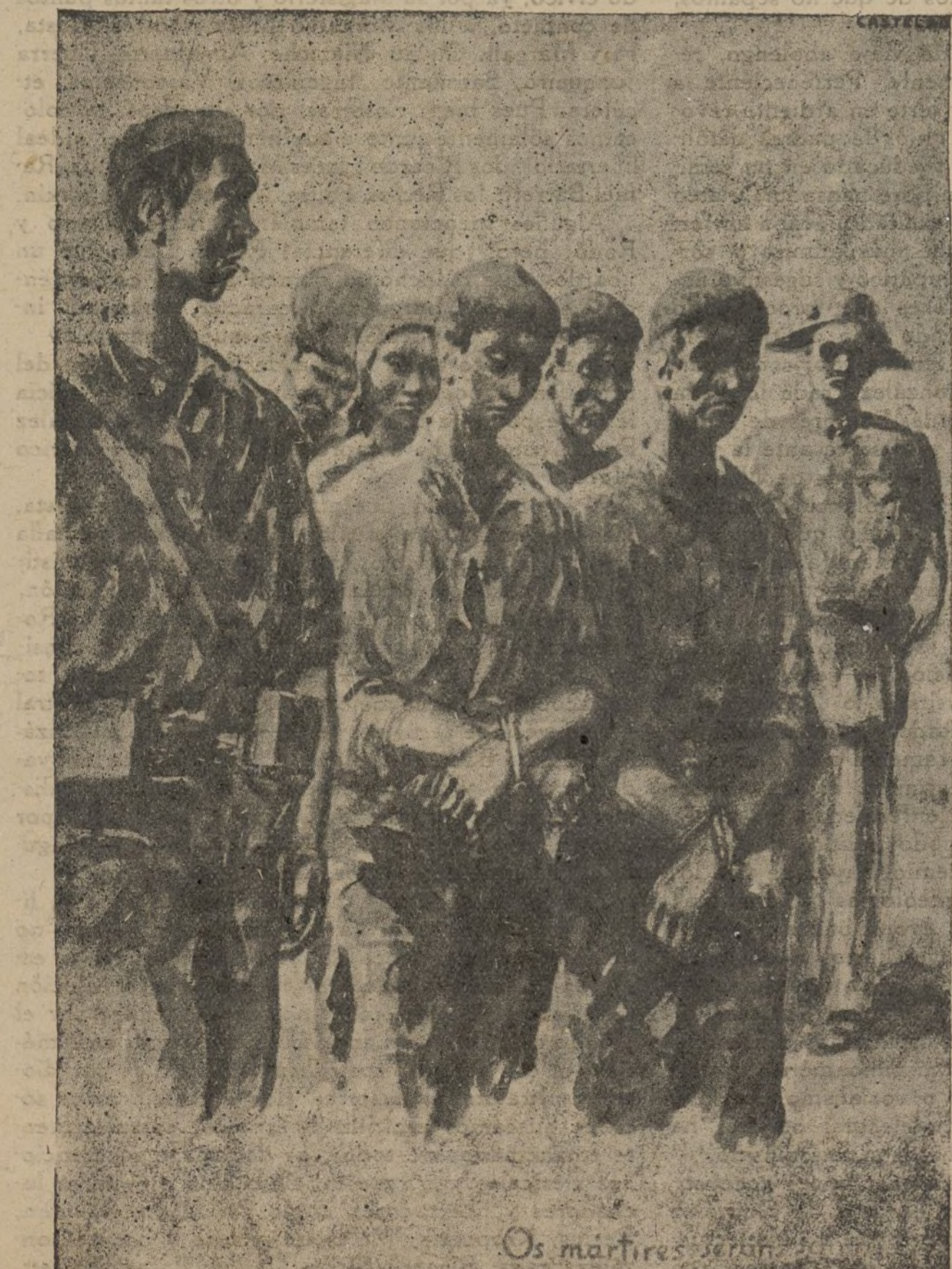
Los mártires serán santos.