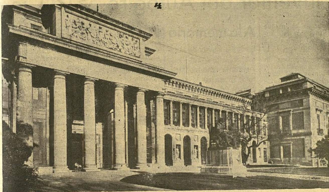
Madrid.-El Museo del Prado