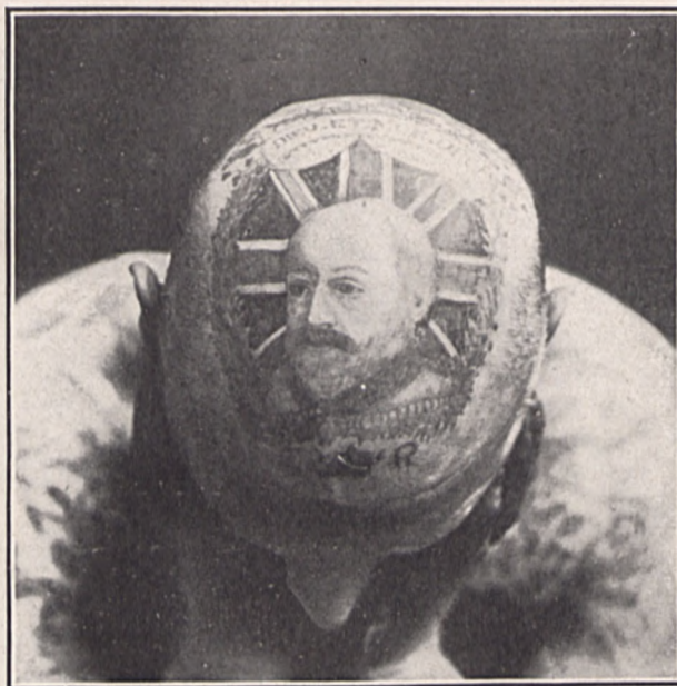
Retrato del rey de Inglaterra tatuado en la calva de un individuo

Quiere poner en moda el tatuaje, tan en uso entre los salvajes de todos los países del mundo en que hay salvajes, que también adoptan los marineros de los barcos, muy especialmente los que visitan las costas del Pacífico, y que por distinguirse en algo extraordinario llevan asimismo algunos correctísimos señores de esos que hacen vida