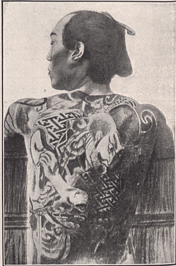
Chino de Shanghai cuyo cuerpo aparece completamente tatuado