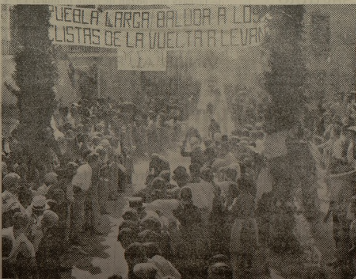
El pelotón de cabeza, pisando la meta en Puebla Larga.