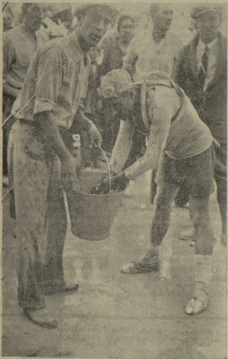
Una escena en el control de revituallamiento de Onteniente