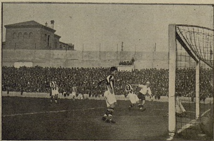
Dos momentos interesantes del partido Real Madrid Real Gimnástica Española, celebrado el domingo