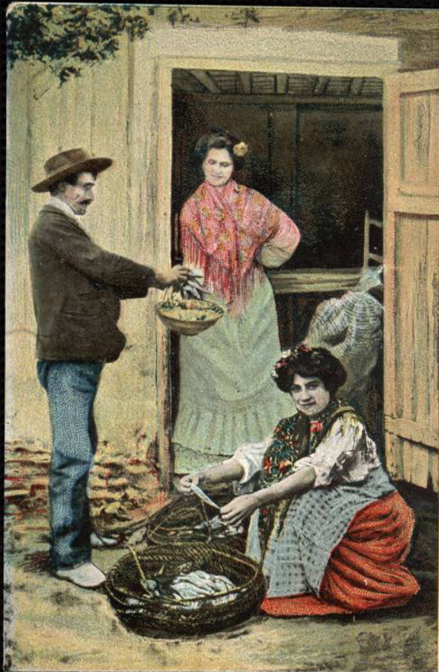
COSTUMBRES MALAGUEÑAS: NÚM. 18 VENDEDOR DE PESCADO