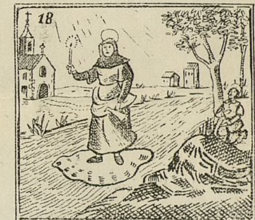
De pie, sobre su mantilla, el río, de orilla a orilla.