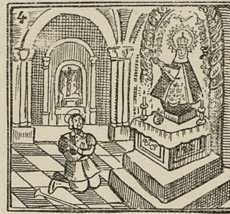
Va muy tarde a trabajar por dedicarse a rezar.