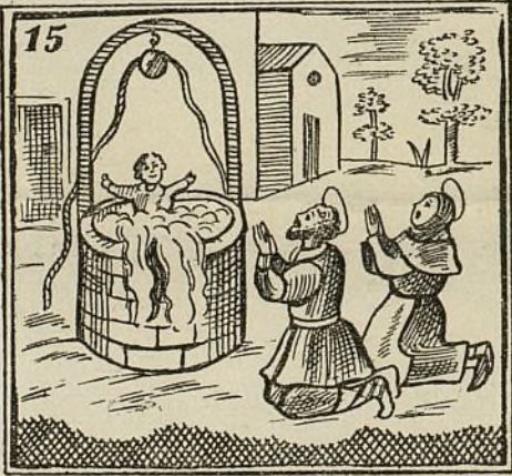
El agna al brocal llegando vivo al niño va sacando.