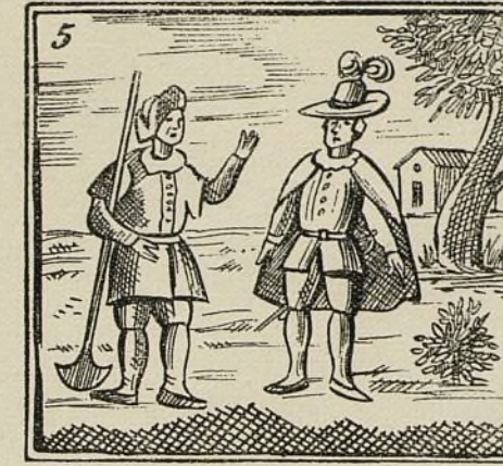
Envidioso un labrador se lo cuenta a su señor.