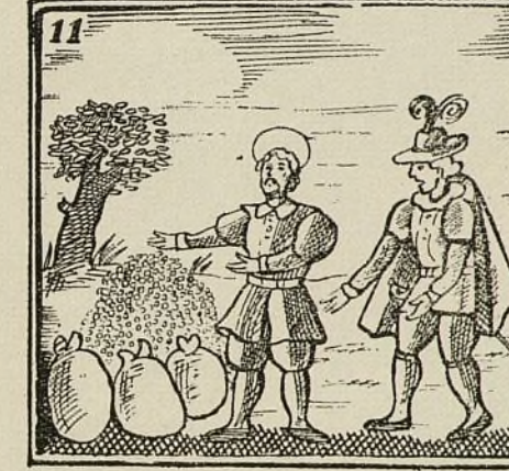
Y cuanto más repartía mucho más trigo cogía.