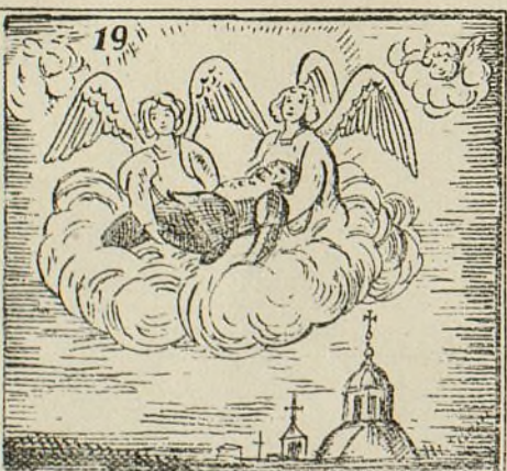
Fué en San Andrés enterrado y después canonizado.