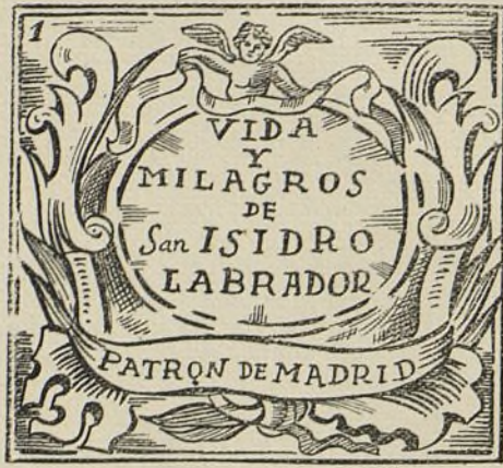
Atiende, lector, la historia y grábala en tu memoria.