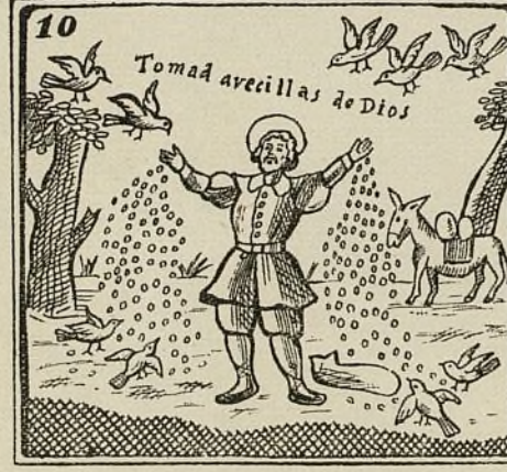
Las aves alimentaba con el trigo que llevaba.