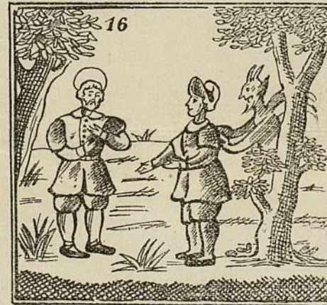
De su esposa le habla mal un espíritu infernal.