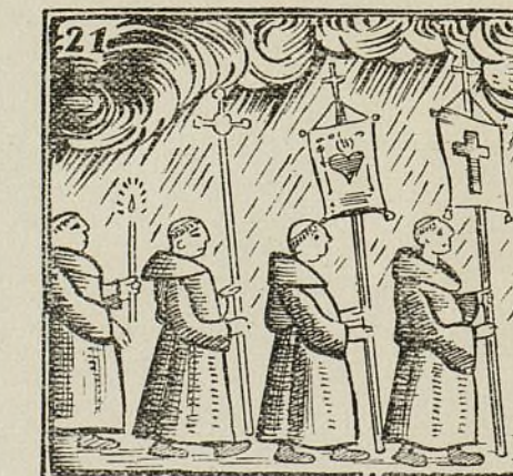
Su cuerpo si hay gran sequía sacan, y siempre llovía.