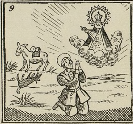
Ora el santo con fervor y muere el lobo traidor.