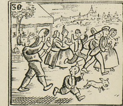
Y el público divertido se va por donde ha venido.