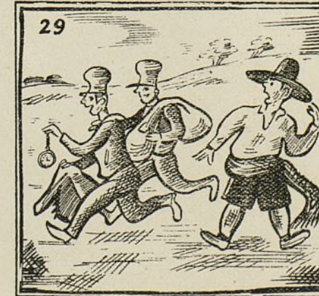
A un «isidro» dos rateros casi le dejan en cueros.