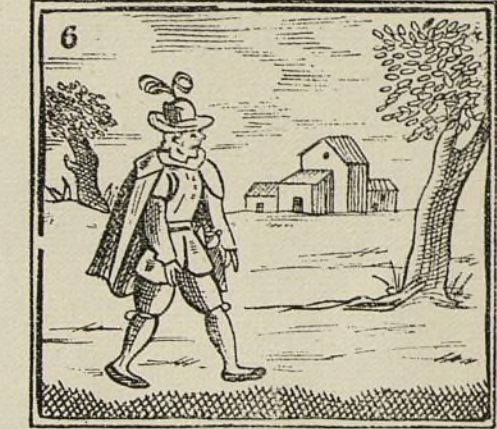
Vargas marcha a su heredad para saber si es verdad.