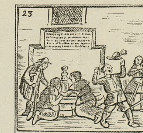
Que la calentura, es fama, la cura sin guardar cama.