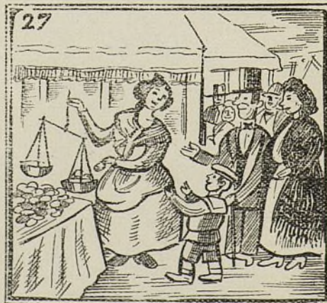
Comen rosquillas de yema, de cal y canto y arena.