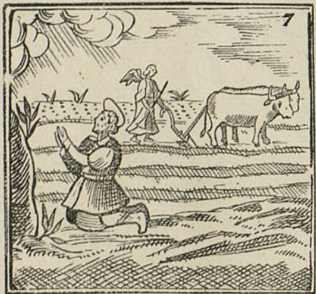
Y vió que un ángel araba mientras el santo rezaba.