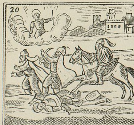
Al rey se le apareció y de Madrid al moro echó.