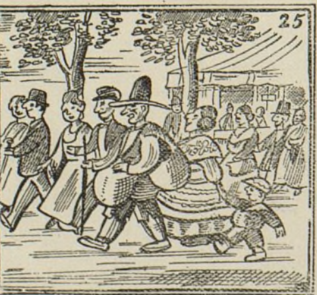
Unos a pie, otros andando van al santo caminando.