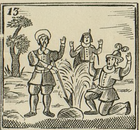
En la piedra un golpe dió y al punto el agua brotó.