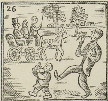
De San Isidro bendito todo el mundo compra un pito.