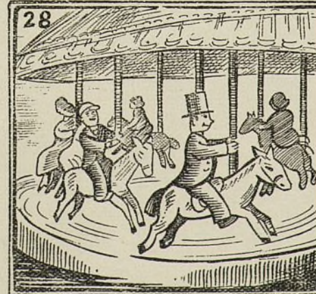
En el tiobivo montada está la gente encantada.