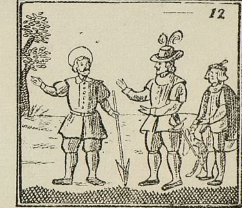
Un día de gran calor le pide agua su señor.