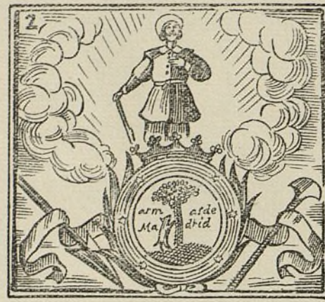
Este santo milagroso nació en la Villa del Oso.