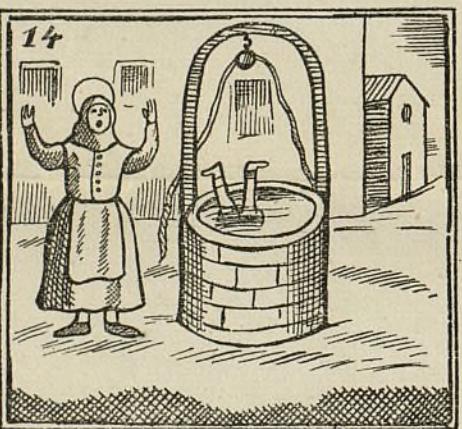
A un pozo su hijo cayó y el angelito se ahogó.