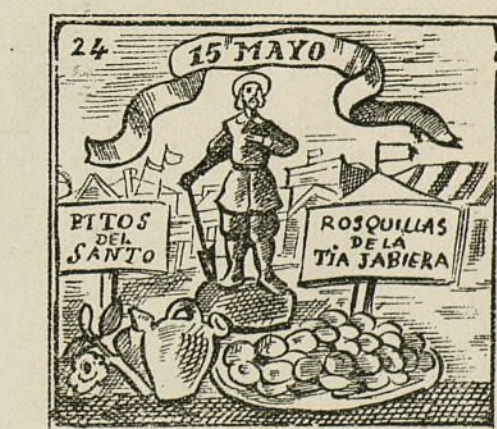
Madrid celebra en el día del santo, gran romería.