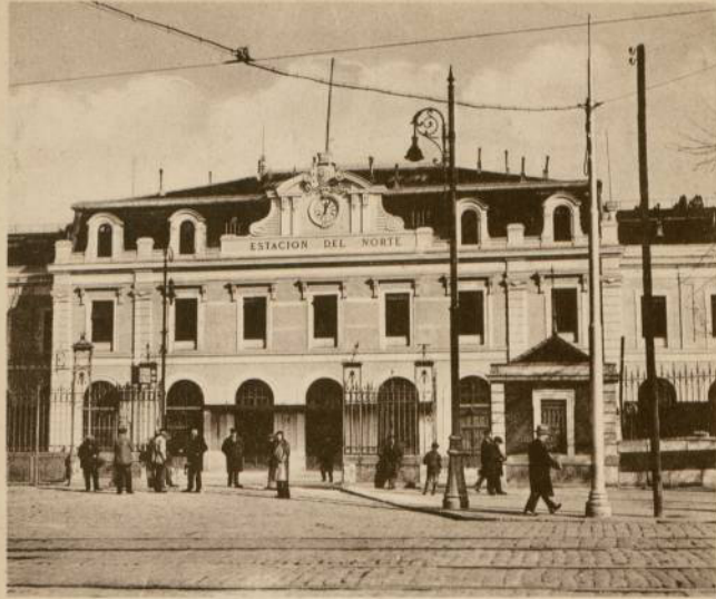
ESTACION DEL NORTE (Madrid)

Al comienzo del Paseo de la Florida, donde estuvo la primorosa ermita de San Antonio, o sea el extremo de la montaña del Príncipe Pío, que también da nombre al edificio que en esta tarjeta nos ocupamos, fué construída la Estación del Ferrocarril del Norte de España.