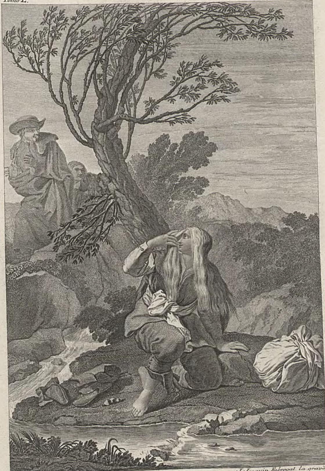
Joseph Cautillo la inv. y dibujo.