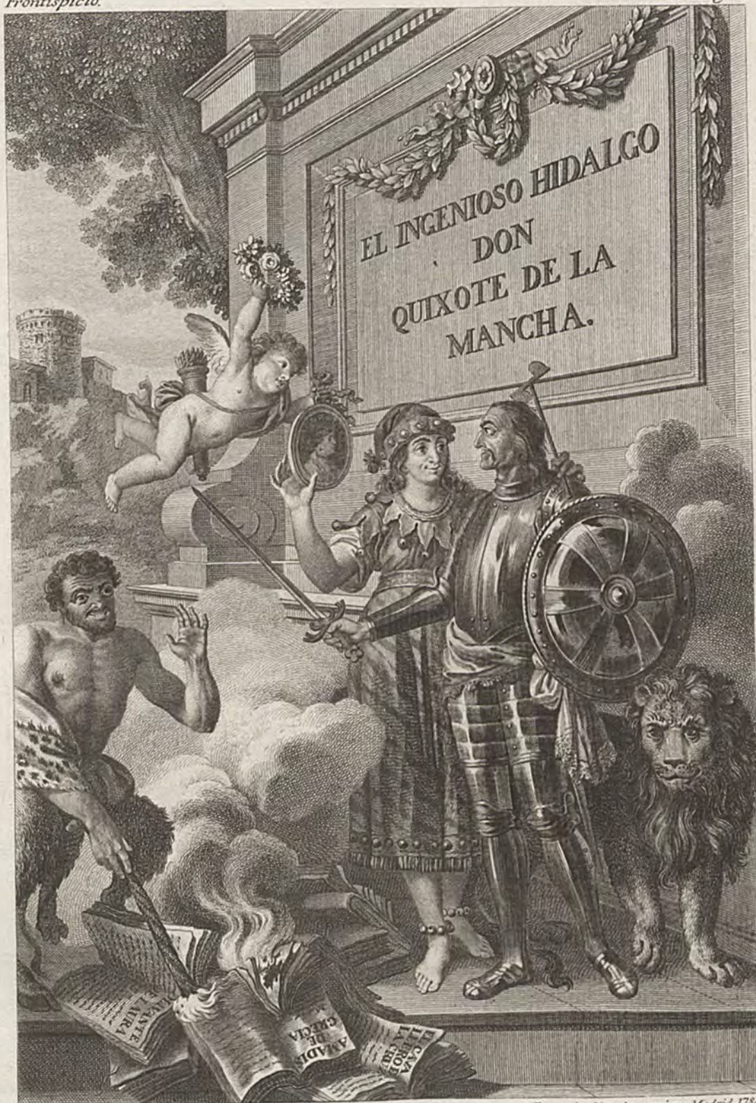
Antonio Carnicer la inv. y dibujó.