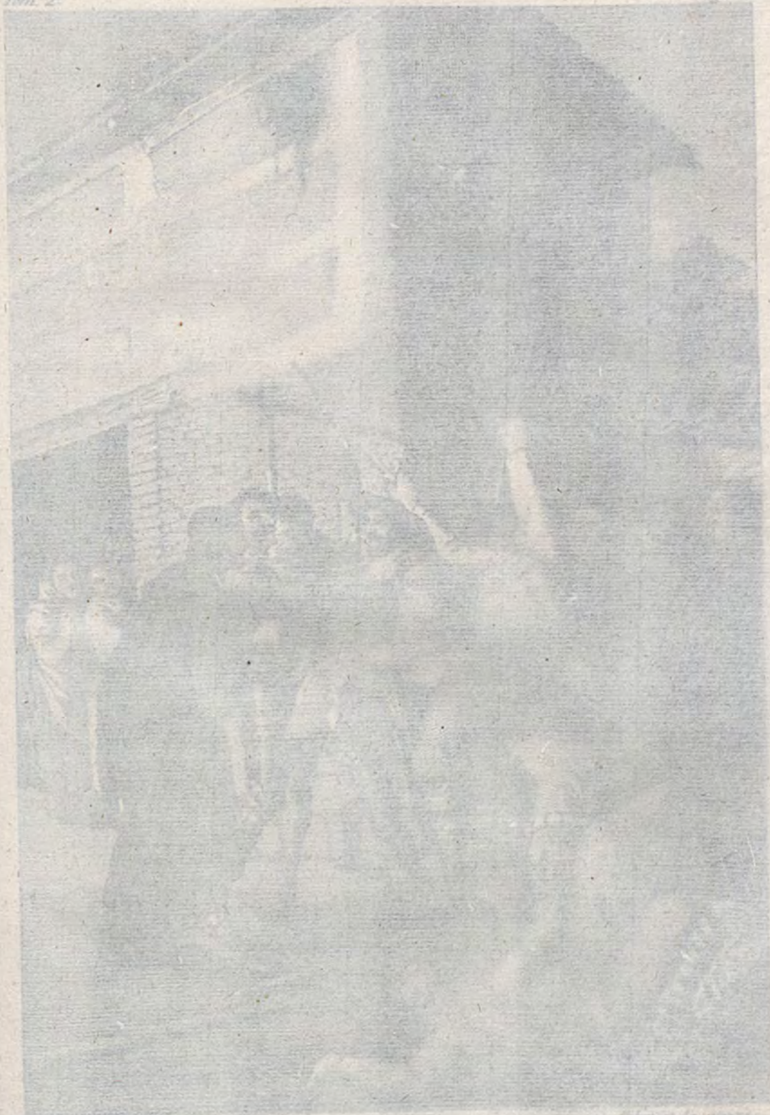
Alcaldes de la ciudad de Madrid