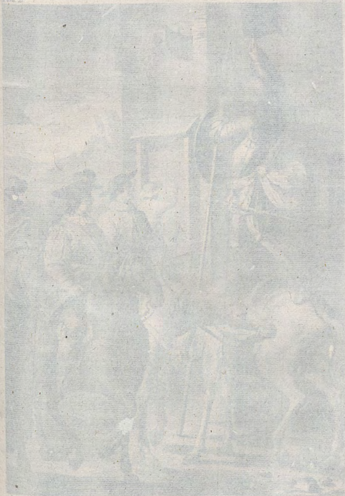
Fig. 21. El estudio de don Juan de Seda.