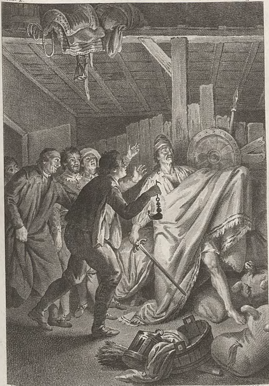
Antonio Carrasco la inv. y dibujó.