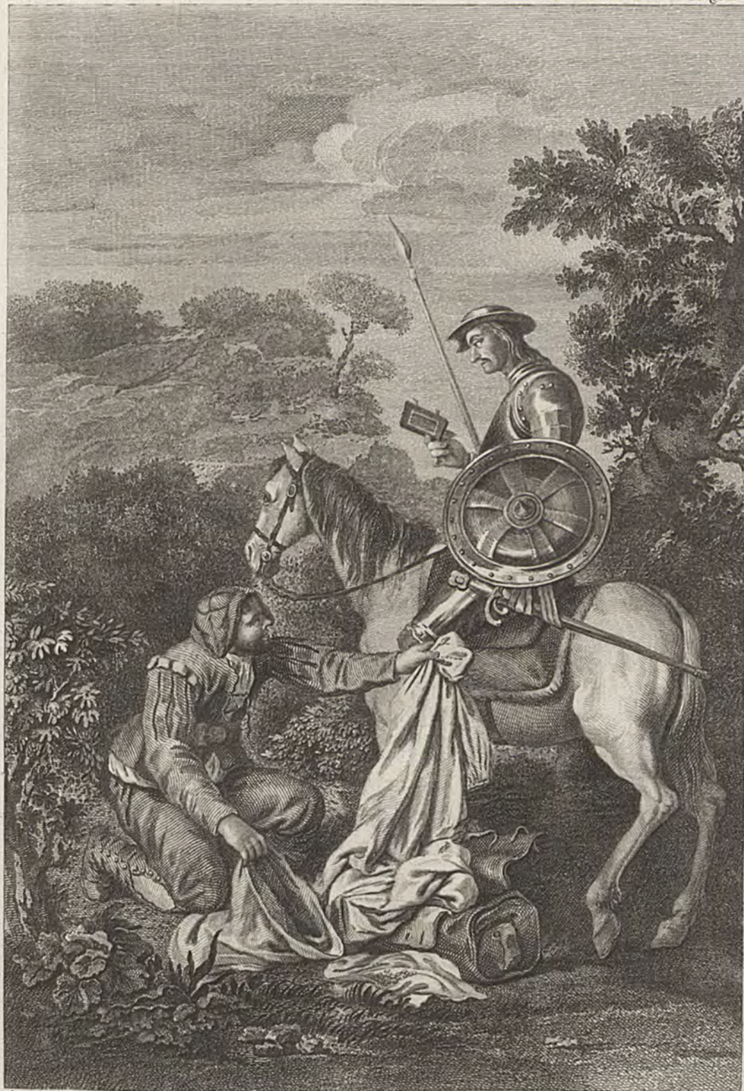
Antonio Carnicero la inv. y dibujó.