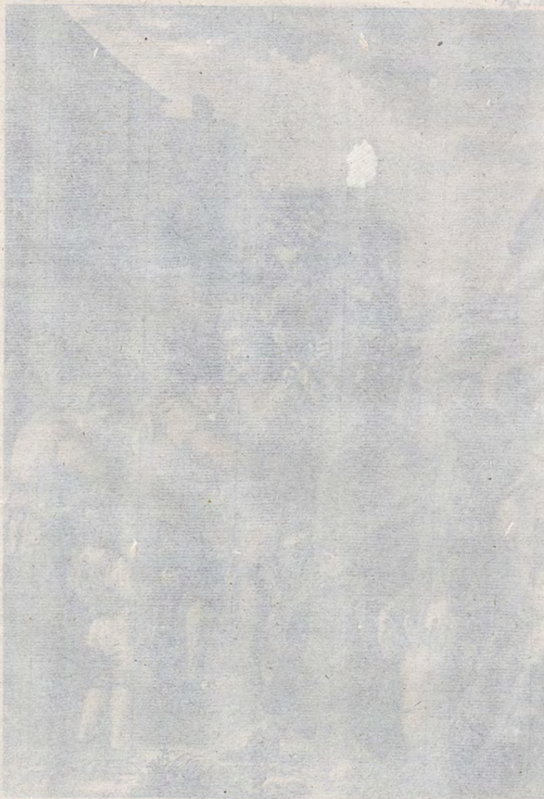
Enfamil. Baronesa de ... / dibujo