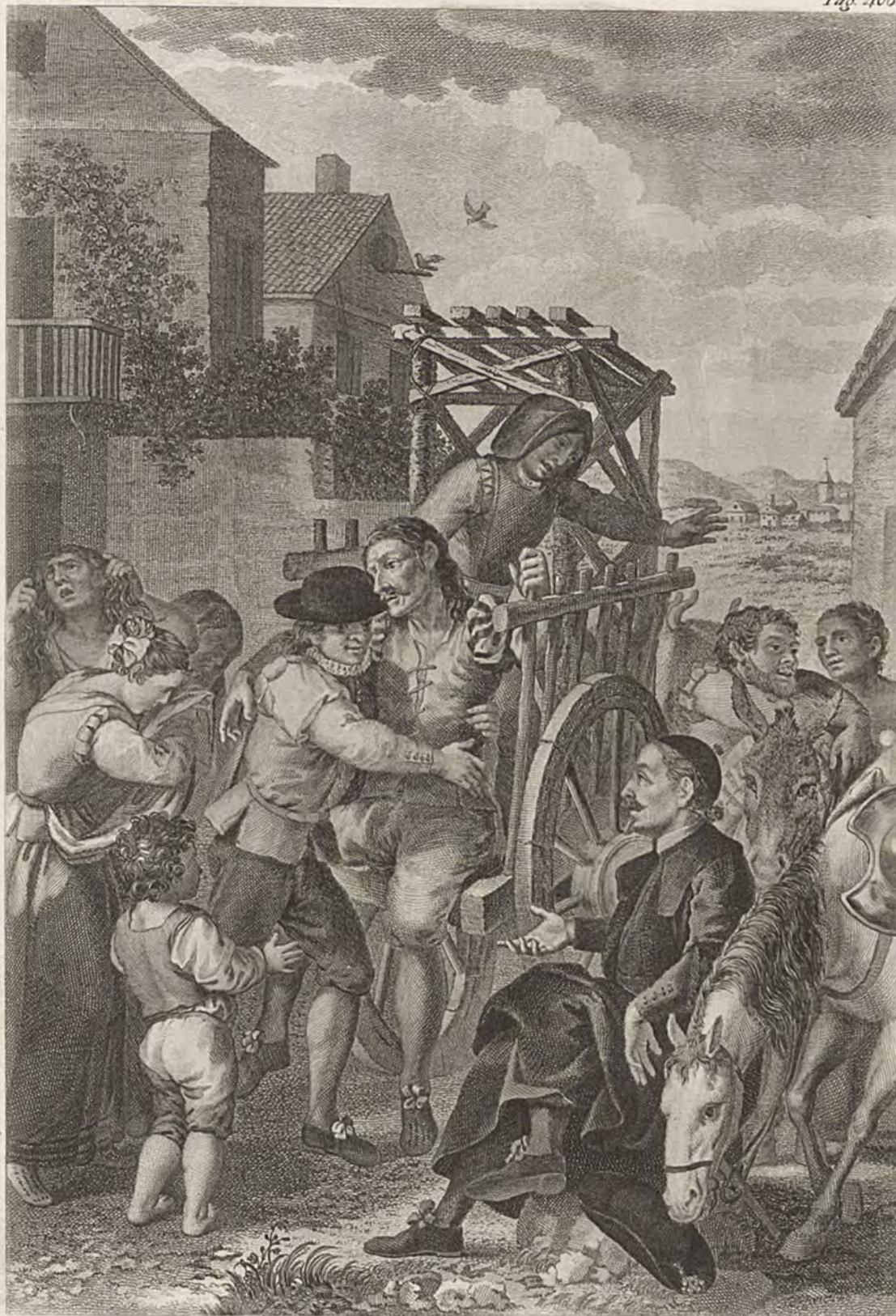
Bernando Barranco la inventó y dibujó.