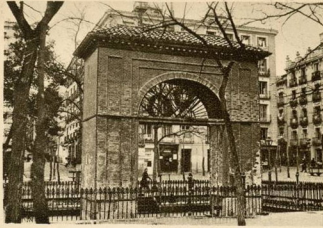
ARCO DEL DOS DE MAYO (Madrid)

Este arco sencillo vale por todos los de triunfo, labrados en mármoles y adornados por la opulencia y los primores de la riqueza y del arte.