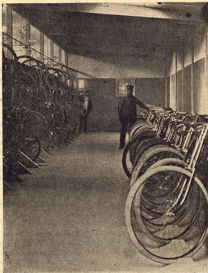
El departamento n.º 1 de máquinas

que por todos se condene la conducta de aquellos que por sus miras particulares, y sin tener en cuenta otra cosa que su personalidad (que ellos creen imprescindible), descienden á terreno más propio de vendedoras de plazuela, que no de individuos que tienen el deber por el propio decoro y por el de la clase (pues muchos son periodistas), tienen el deber, repito, de recordar que llevando las cuestiones á ese terreno, en vez de sumar elementos para el Ciclismo, que es lo que todos debemos procurar, sólo se logra restarlos.