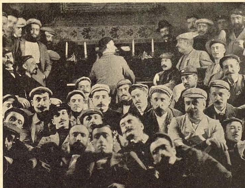
Sala de conversación

La casa Wertheim pondrá á disposición de sus favorecedores, espaciosos locales para la custodia y conservación de bicicletas.