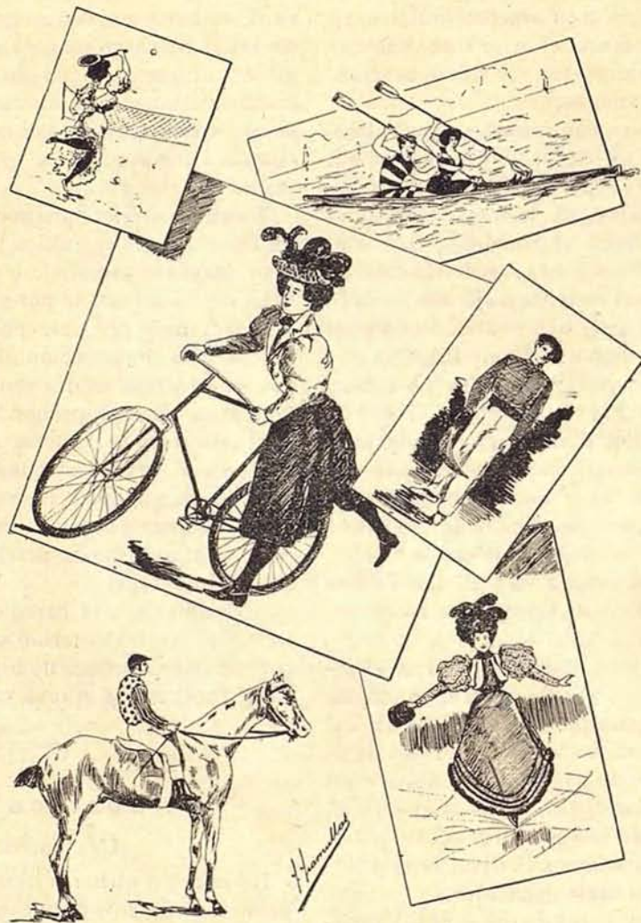
Estudio de una portada para nuestro periódico

Nuestro grabado da una idea exacta de cómo están instaladas las máquinas en el citado Club. En sentido paralelo á la sala que reproduce nuestro grabado, está