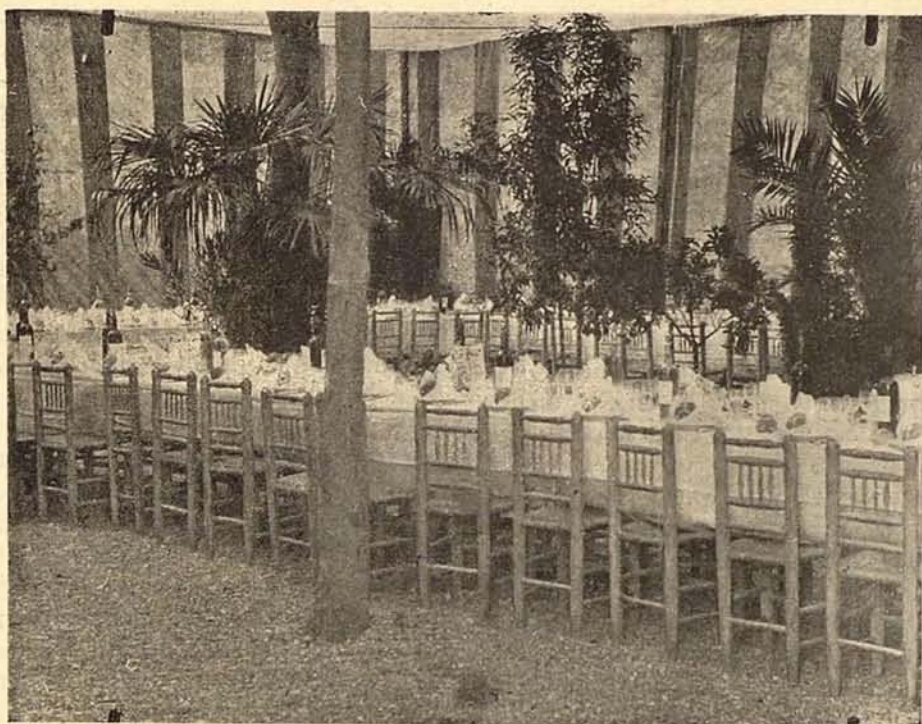
El comedor, momentos antes del banquete