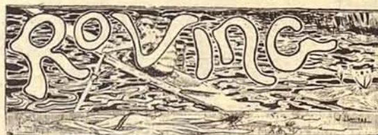
El match Oxford-Cambridge. — Notas de club

Ya principia á iniciarse el cosquilleo, que precede siempre á los acontecimientos esperados con ansiedad, entre los flemáticos hijos de las orillas del Támesis. Las legendarias regatas al remo que periódicamente verifican desde larga fecha las Universidades rurales de Oxford y Cambridge, están fijadas para el 3 del próximo Abril, y la espectación es grande entre los amateurs , porque en las próximas se anuncian verdaderos deseos de salir airoso cada uno de los bandos.