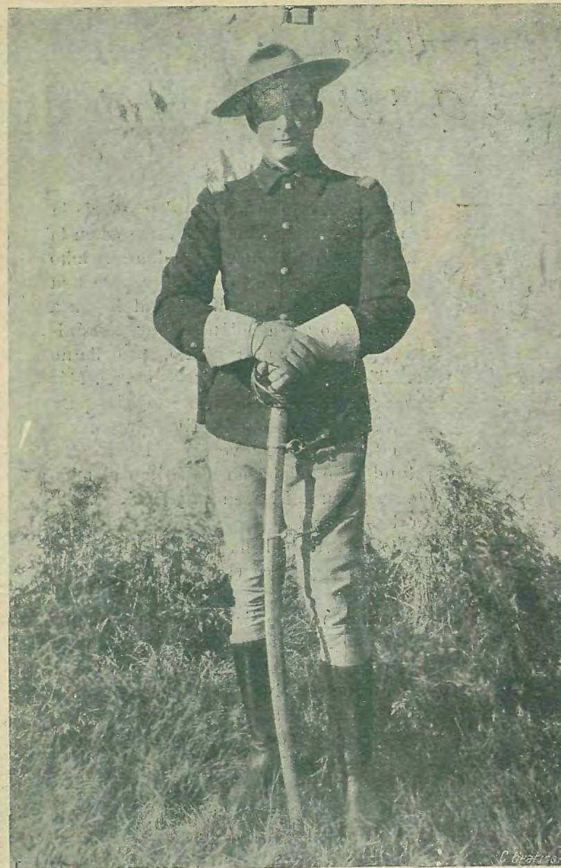
Tim Mac Coy en el papel de "El Capitán Calton"