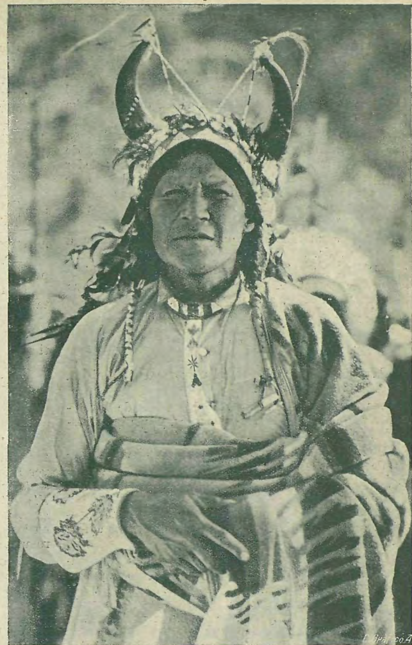
"Blancos contra indios" película de la Metro Goldwyn.