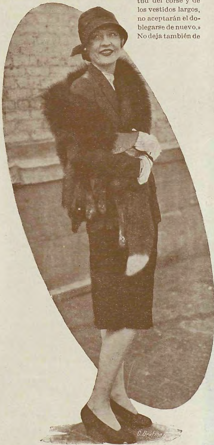
Phyllis Haver, de los estudios Pro-Dis-Co, luciendo un traje hechura sastre y un cuello negro de zorro

de la doble esclavitud del corsé y de los vestidos largos, no aceptarán el doblegarse de nuevo.» No deja también de