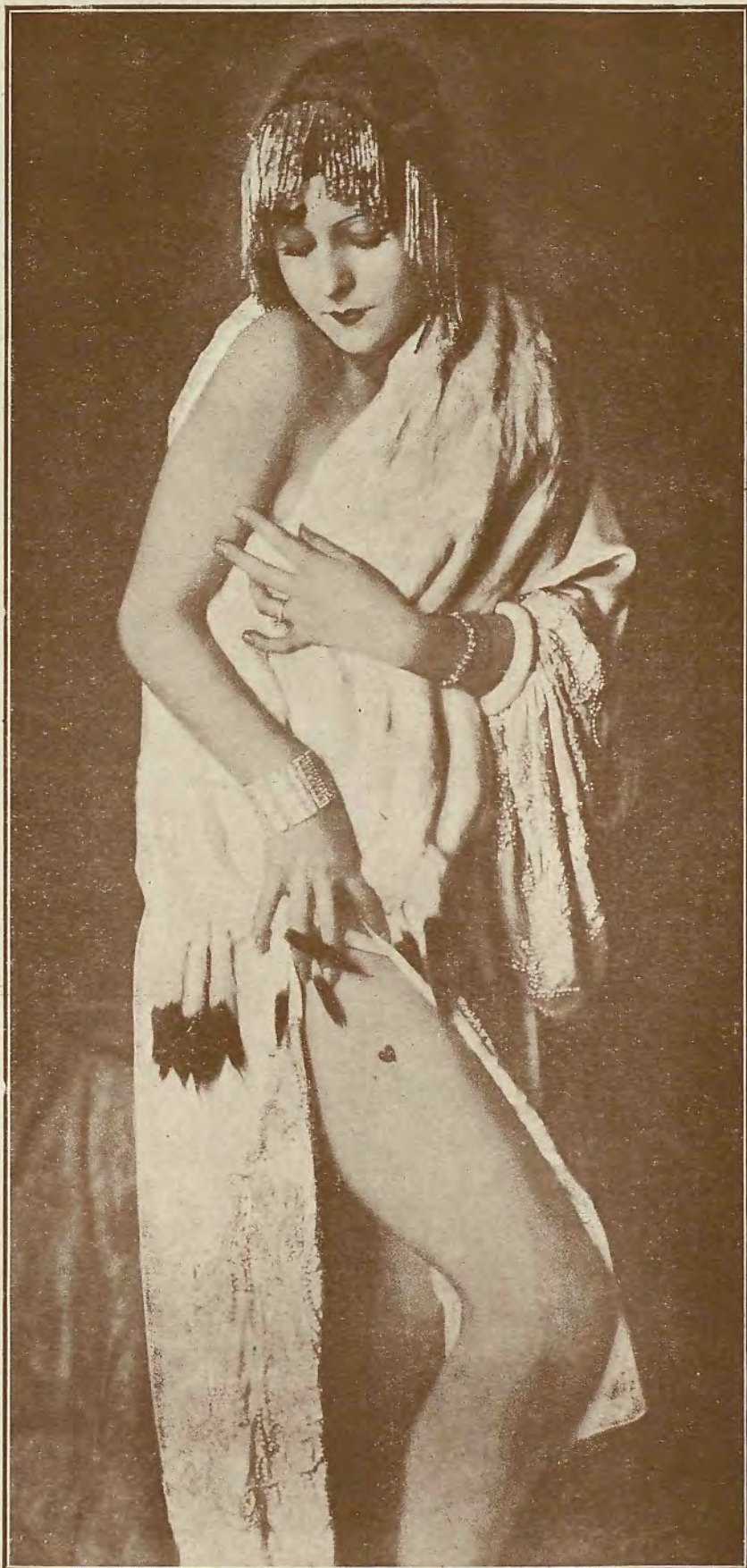
Lilián Harvey, la "flappers" estrella alemana de la Ufa

Lilián Harvey, la artista alemana de la Ufa, es hoy una de las más famosas en la cinematografía europea. No hace mucho tiempo que uno de los directores de una Casa americana de películas, al llegar a Berlín, quiso ver a Lilián Harvey, con ánimo de arrancarle un contrato. Pero ella no accedió a los deseos del proponente. Más tarde, de Inglaterra, le llegaron cartas para nuevos contratos que de allí le proponían. Pero Lilián Harvey volvió a negarse en rotundo. No estaba en su ánimo el marcharse de su país. Y en su país sigue. Allí ha tenido éxitos tan grandes como Un punto oscuro , la bella película en la que Lilián Harvey hace el papel de protagonista.