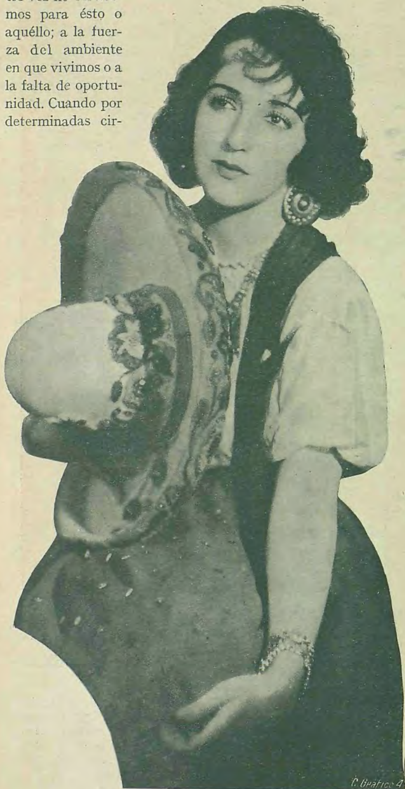
Bebé Daniels en "Río Rita" película sonora de la Radio Pictures.

Bebé tampoco le había dado nunca importancia a su voz. Cuando empezó a trabajar en el cine los ensayos, su trabajo le dejaba tan poco tiempo libre, que no disponía de él ni siquiera para cantar alguna vez en su casa;