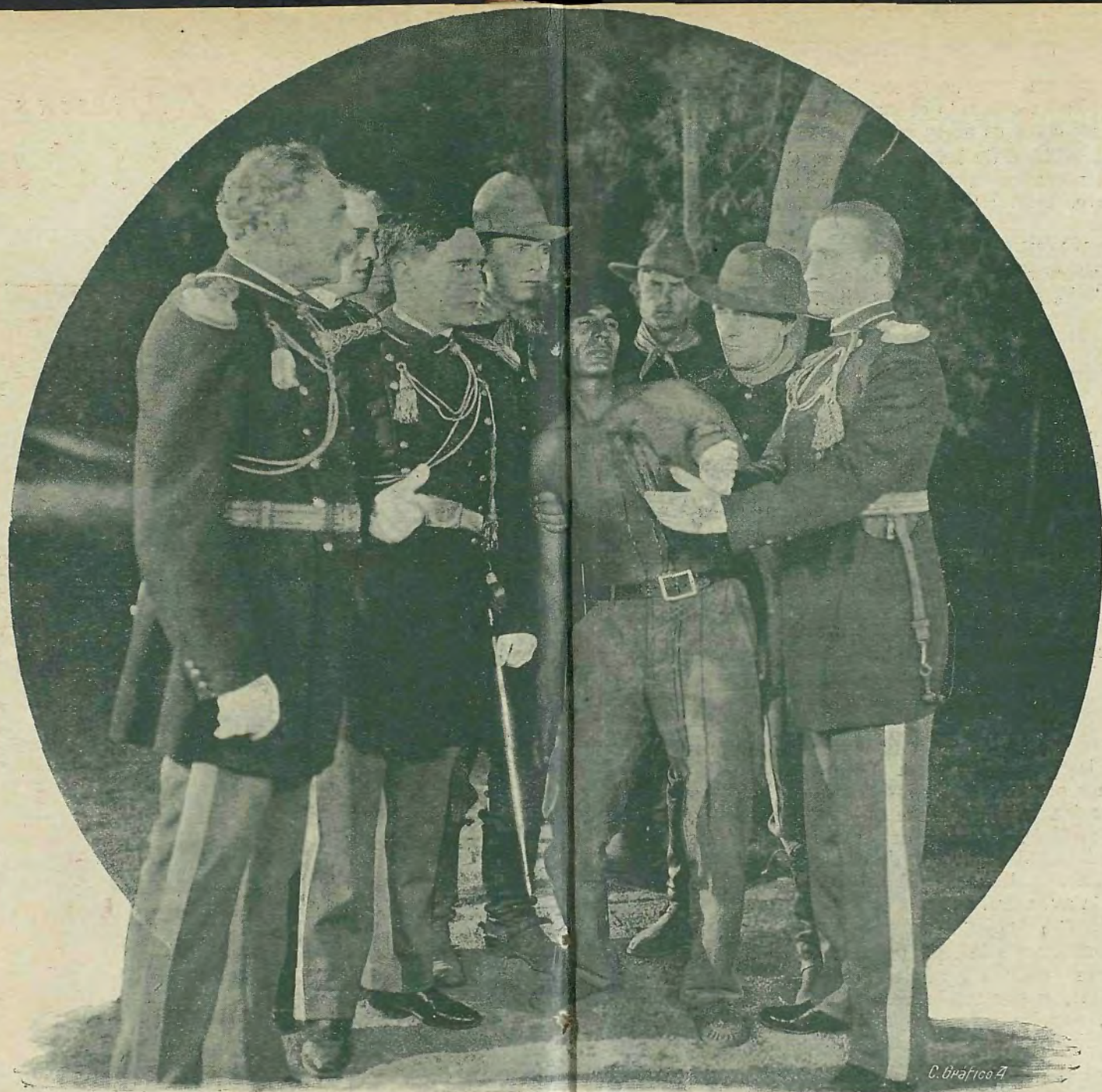
El Coronel Tim Mac Coy en una escena de la película "La nobleza de un piel roja"