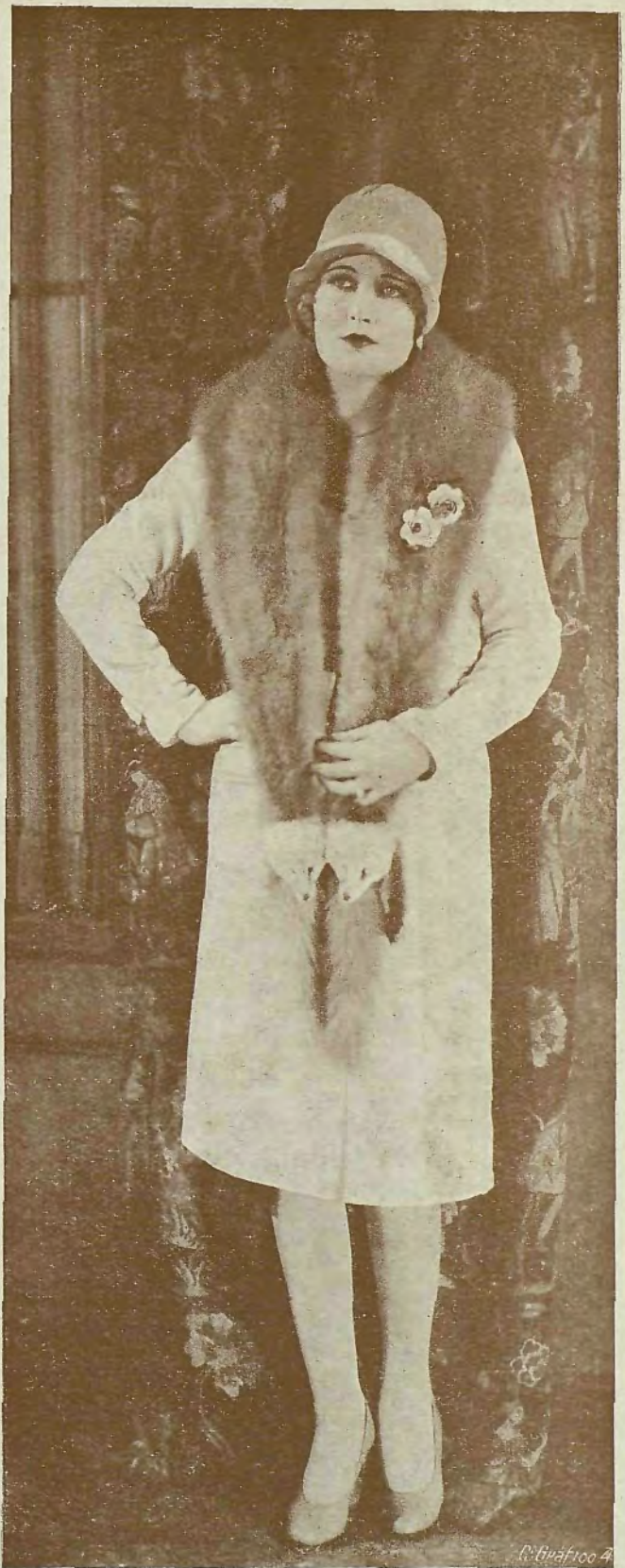
Jeanett Coff, la gentil estrella de los estudios Cecil B. Mille, con un sencillo traje de muselina blanca y cuello de "renard"

ser cierto que la falda larga no sienta bien a todas las mujeres. La refinada elegancia de una mujer alta ganará en interés con un moderno panneau ; en cambio, la graciosa silueta de una mujer de corta estatura es más airosa con la falda corta. Se debe buscar el detalle, pero teniendo en cuenta que no todas las modas son asequibles a ciertos cuerpos, y lo mejor es que cada mujer, con su propio sentido, busque la mejor colaboración entre lo que puede llevar y la moda que imponga la temporada.