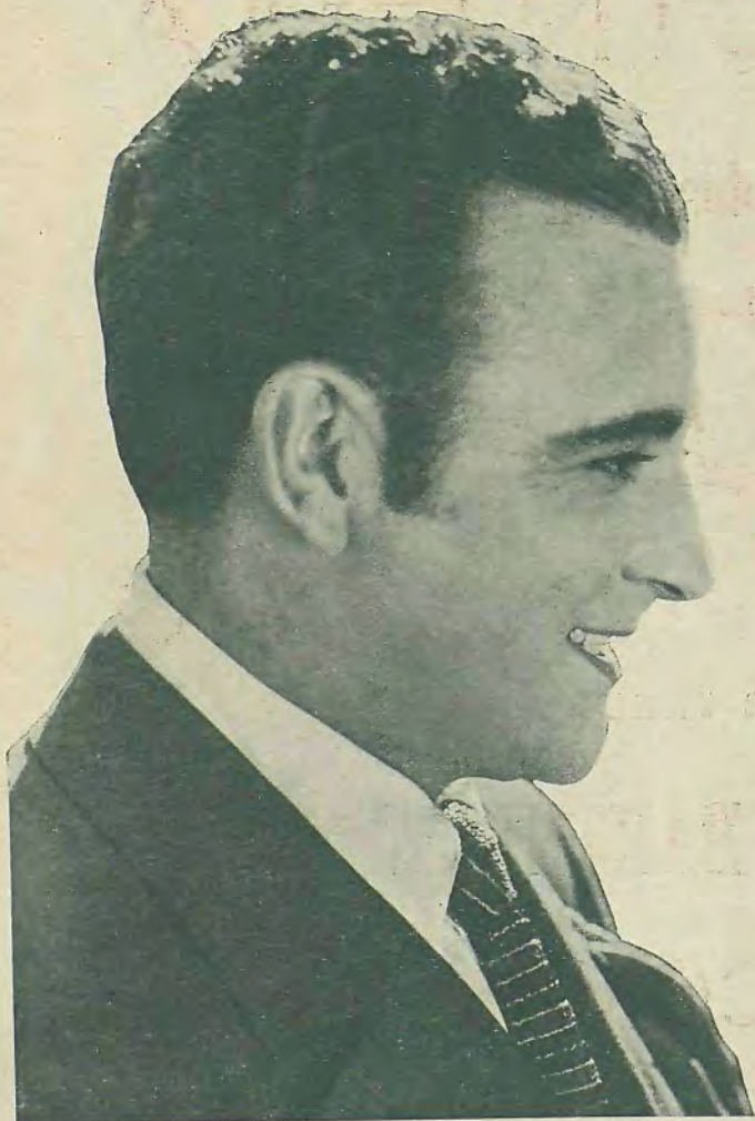
Las películas españolas

Para organizar en nuestro país el negocio pelicularo, hay que comenzar por la base. Y la base son unos estudios, pero no como esas jaulas que hay ahora, sino unos estudios dotados de todos los elementos necesarios para hacer películas y que éstas salgan en condiciones de poderse representar en la pantalla.