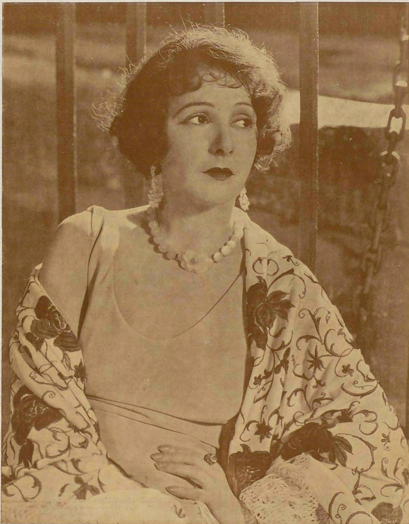
Norma Taft, la genial artista de "United Artists" Ayuntamiento de Madrid