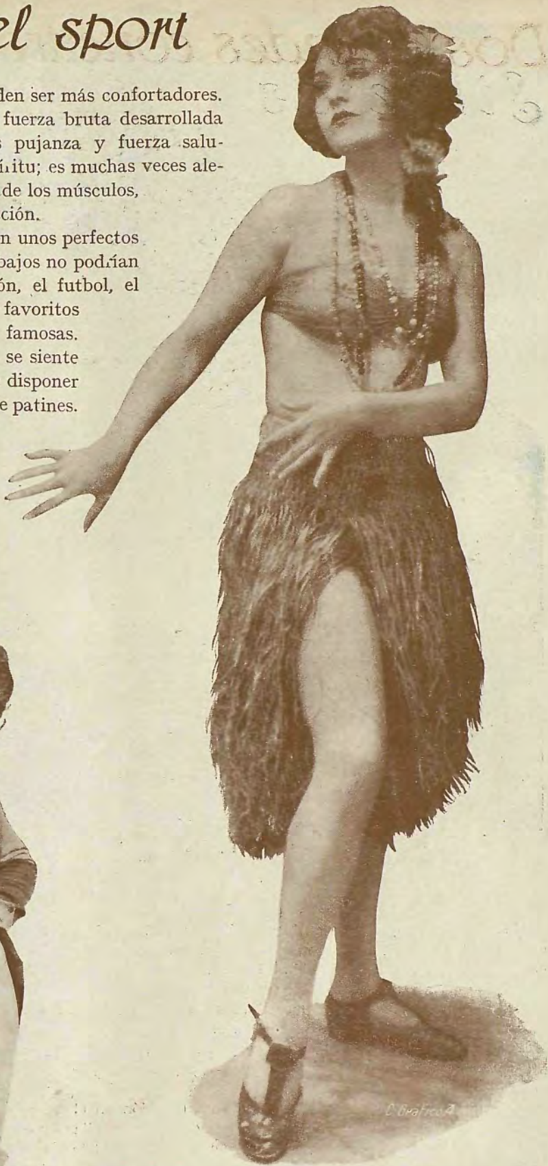
Betty Compson, la bella danzarina de la Firts National, tal como aparece en "La mujer cautiva".