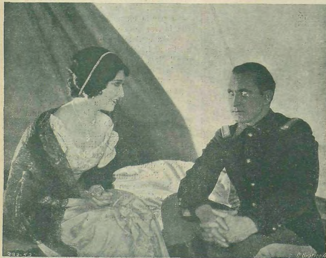
Dorothy Sebastián y Tim Mac Coy en "Blancos contra indios"