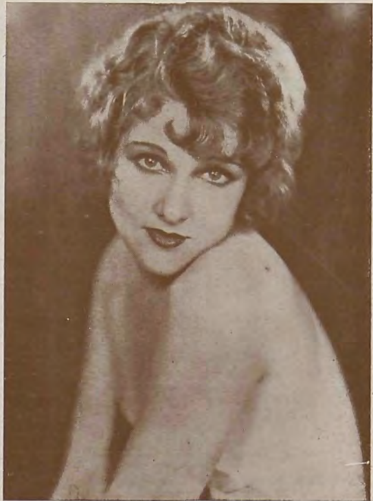
En "Follies-1929" Sue Carol realiza uno de sus más interesantes films.