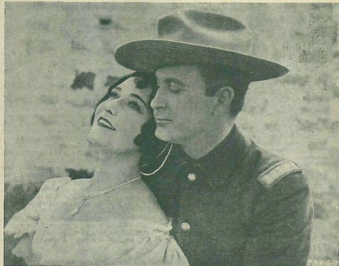
Dorothy Sebastián y Tim Mac Coy en el film "Blancos contra indios"