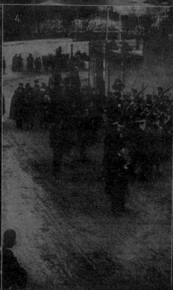
1. El nuevo embajador de Inglaterra, sir Howard, presenta sus credenciales a Su Majestad. La comitiva al salir de Palacio.—2. Sir Howard con sus secretarios y el agregado militar.—3 y 4. El capitán general de Madrid con el equipo militar y periodistas santanderinos que han hecho el viaje a pie en diez días, de Santander a Madrid.