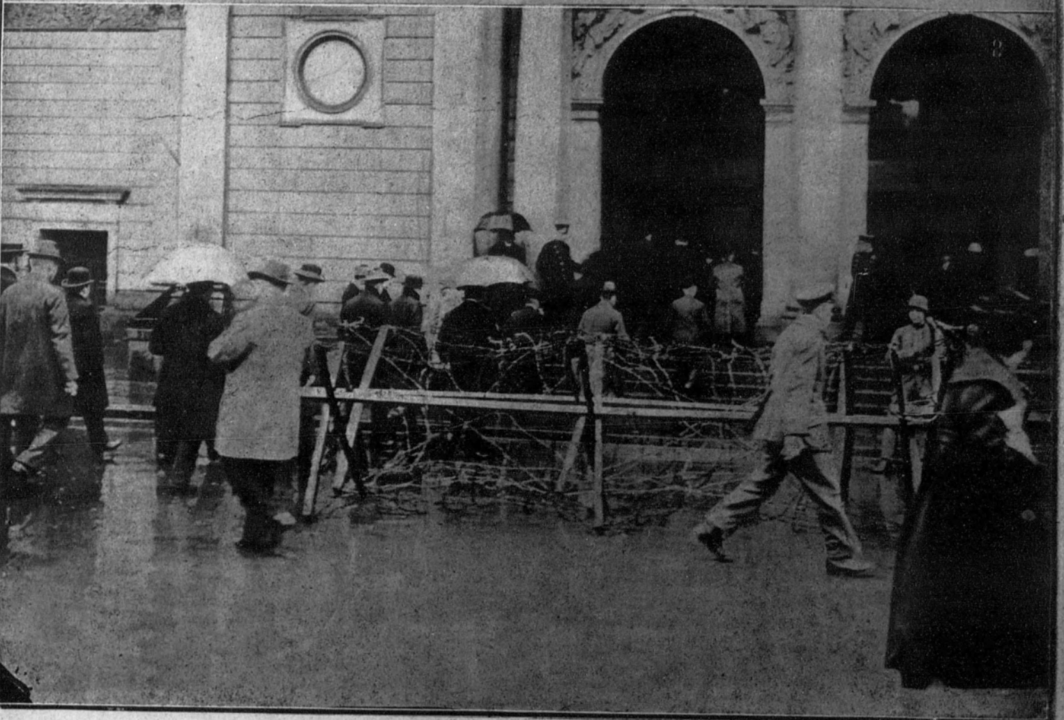
1. AUSTRIA: El Palacio de Ischl, antigua residencia del Emperador Francisco José, transformado en casa de Convalecencia.—2. HAMBURGO: Edificio de la Bolsa, que desde los últimos disturbios está protegido por vallas de alambre espinoso.