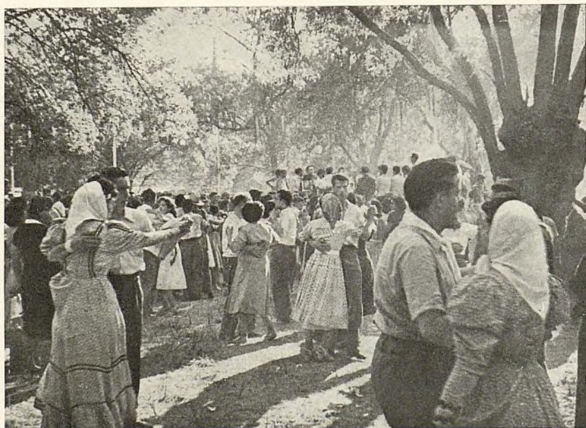
Dos estampas que reflejan la animación de los romeros