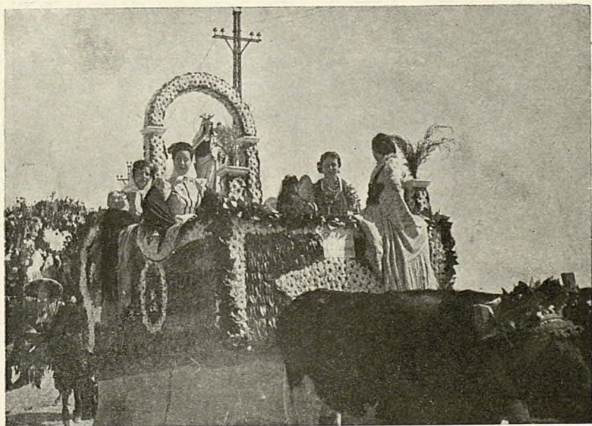
Ilegando a la Casa de Campo