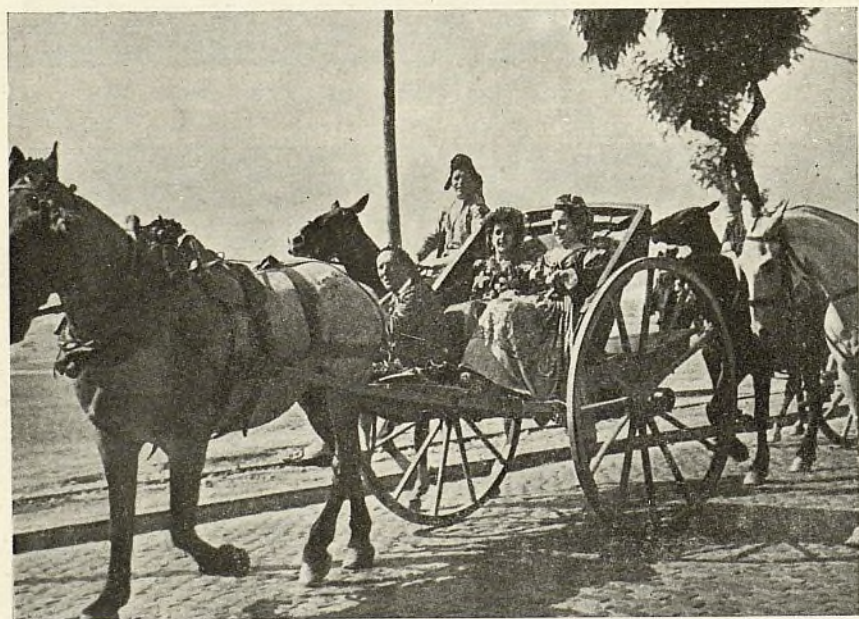
Varios detalles gráficos de la Romería