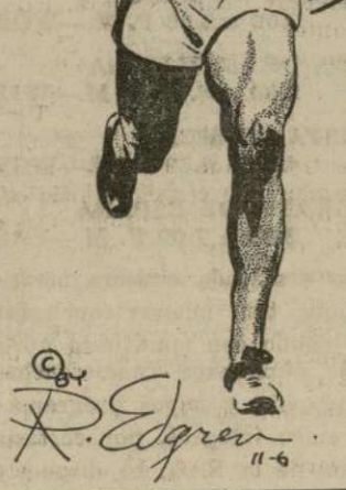
Ralph Metcalfe, gran corredor de Marquette, ganó el 90 por ciento de todas sus carreras.