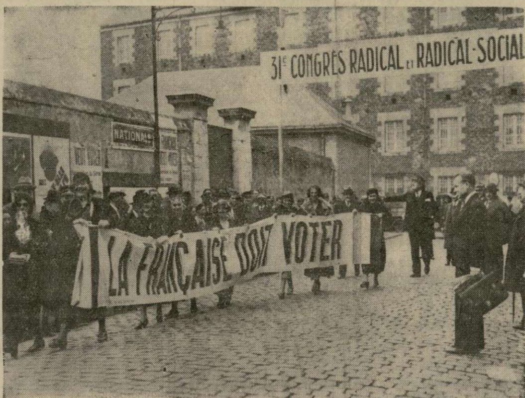
Una manifestación de las sufragistas francesas pidiendo el derecho del voto, durante el reciente congreso del Congreso Radical y Radical-Socialista celebrado en Nantes. Una intensa agitación pro-sufragio femenino, prohibido por la Constitución, ha añadido a la inquietante situación política francesa del momento.