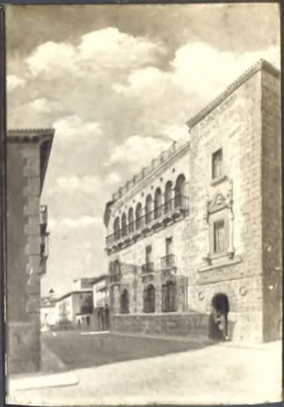
Casa de Cisneros, Calle del Sacramento