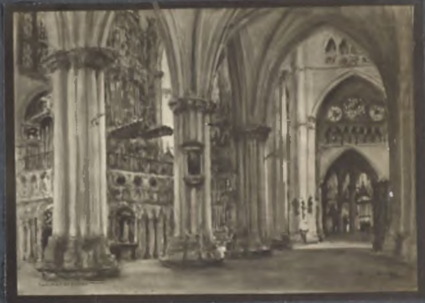
Interioris de la Catedral