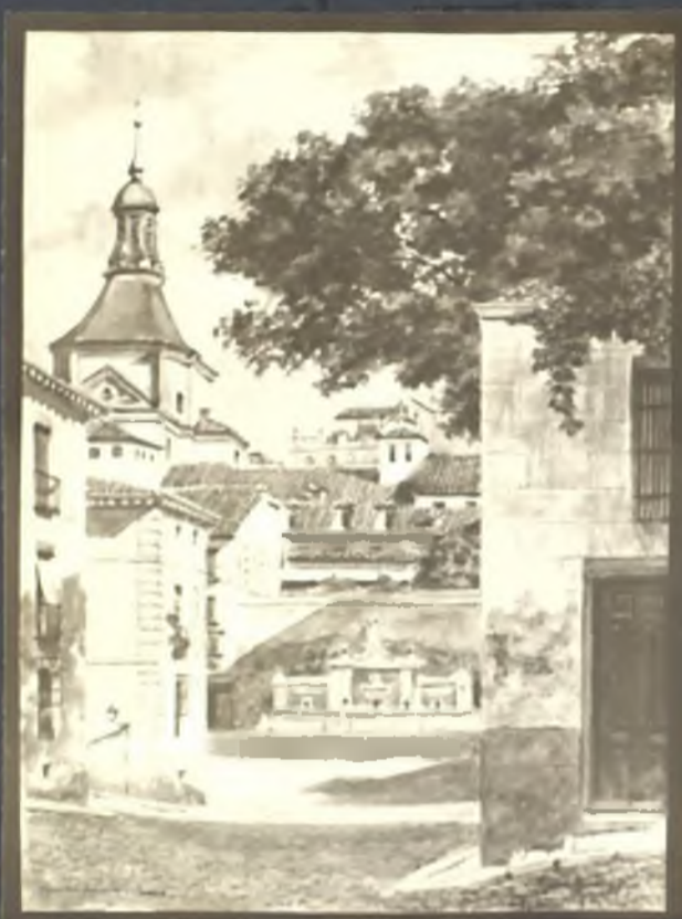
Plaza de la Cruz Verde