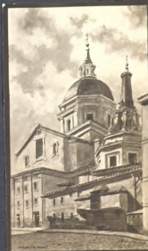
La Catedral, por la calle de la Colegiata