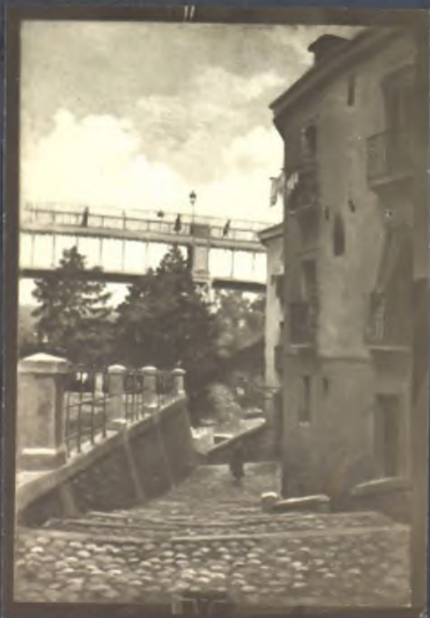
Calle de los Caños viejos