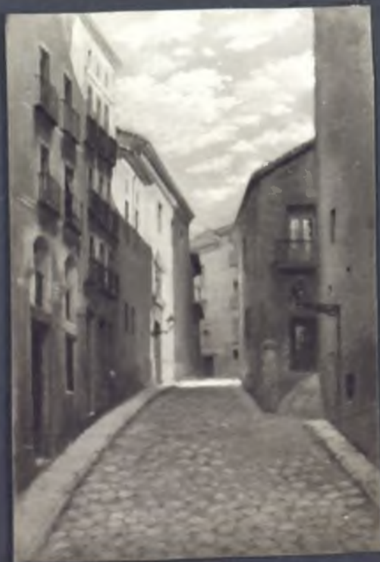
Calle de Puñonrostro