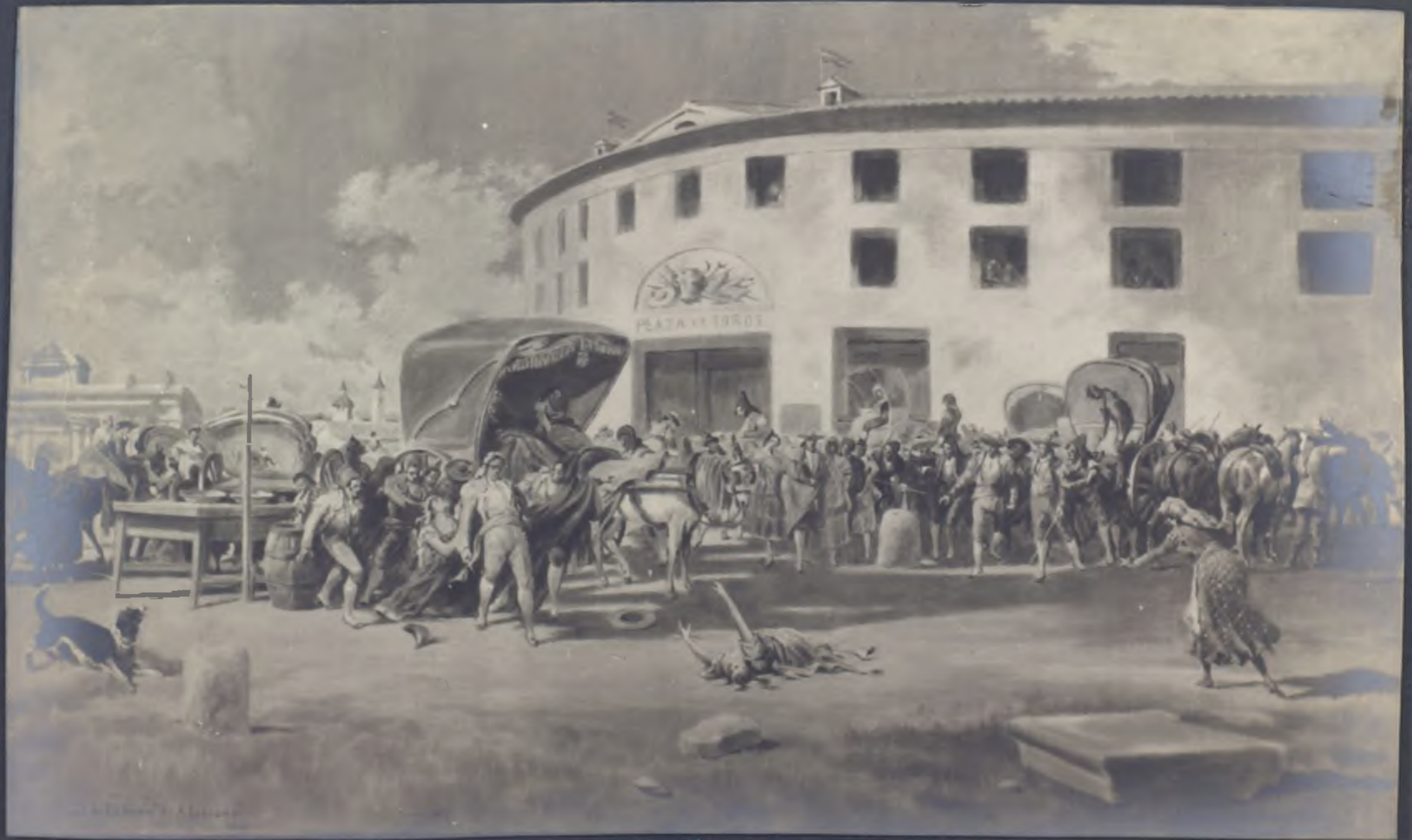
Final de Carmen