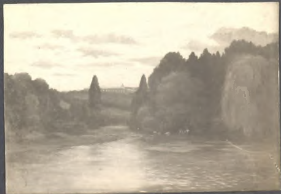
Ribera del Manzanares