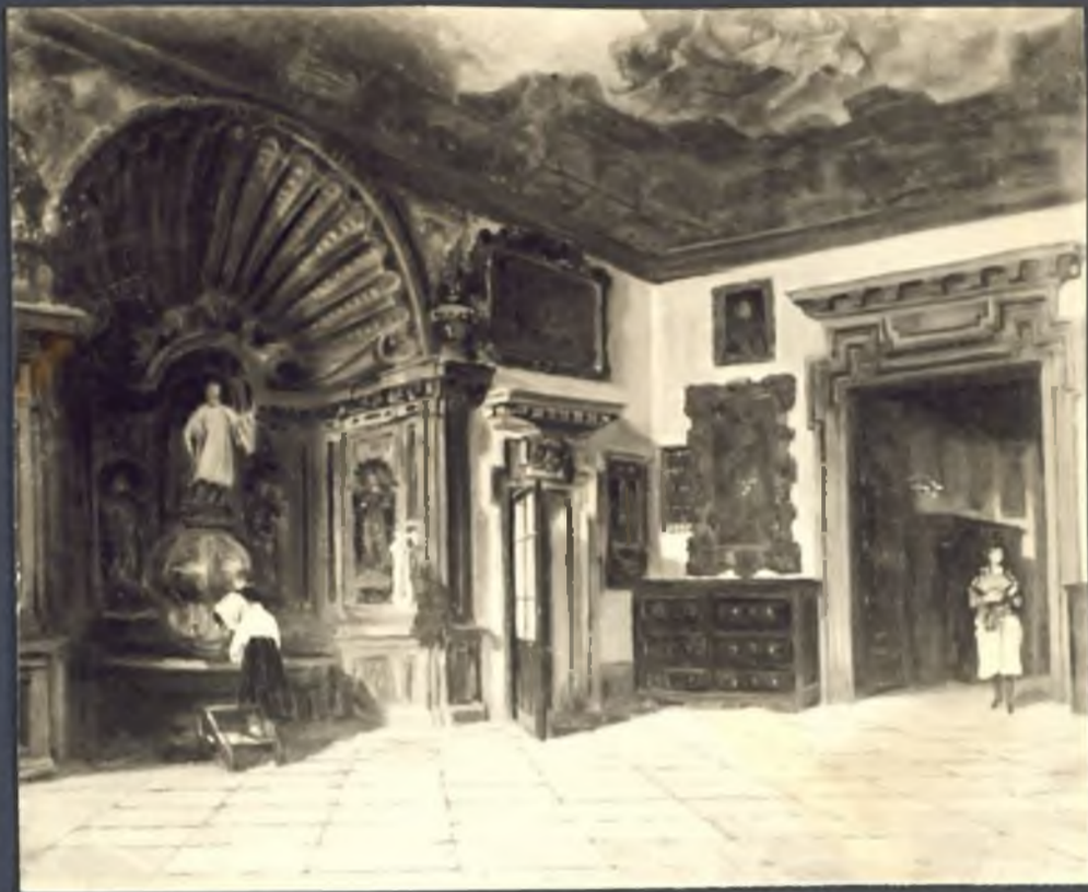
Sacristia de la Catedral.