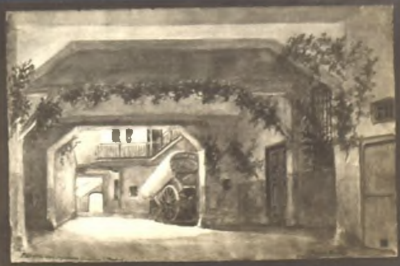
Parador del Segoviano . Cava baja