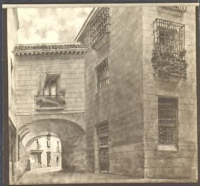
Pasadizo de San Gines