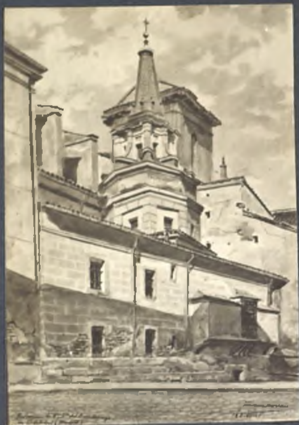
Parroquia del Buen Consejo. Calle de la Colegiata