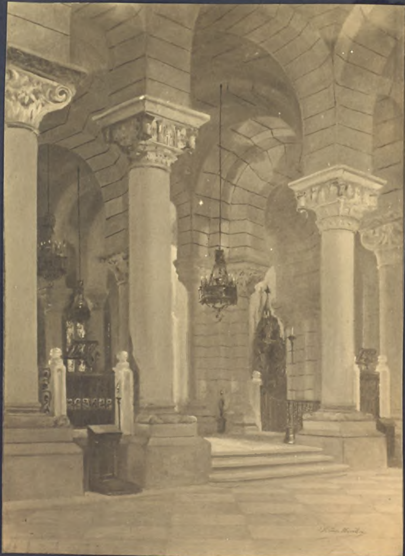
Cripta de la Almudena