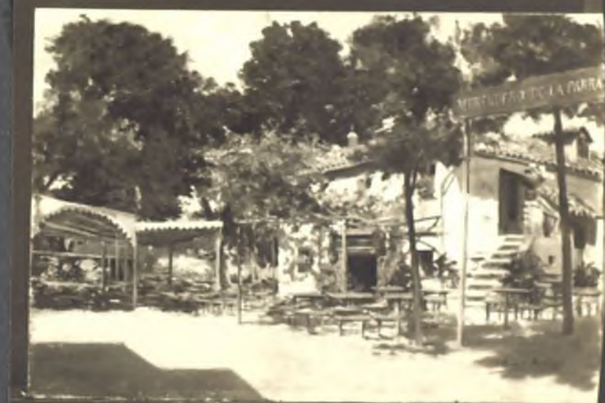
Merendero de la parra. Paseo de la Florida