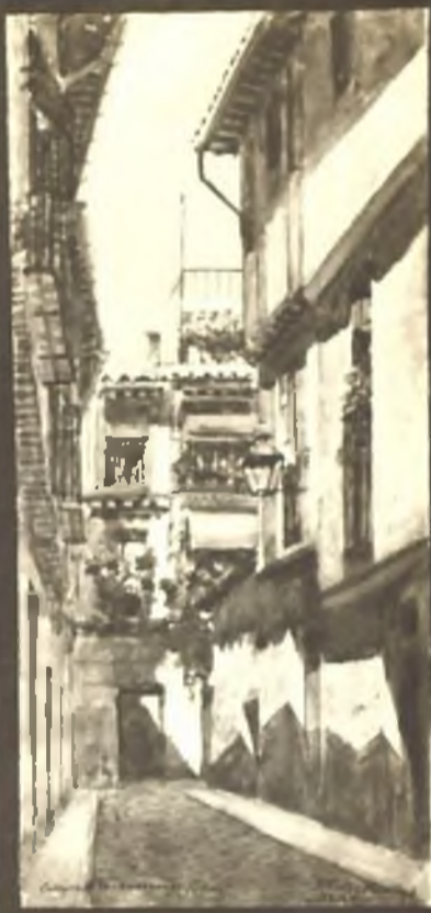
Callejon de los bodegueros