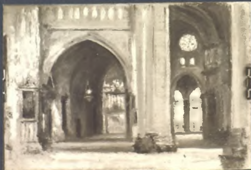
Interior de la Catedral