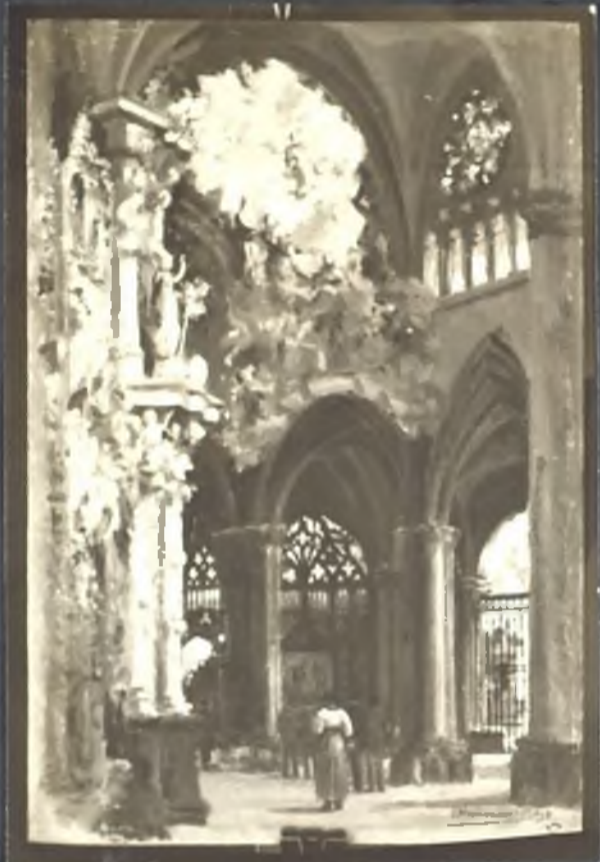
Interior de la Catedral (el traspasante)