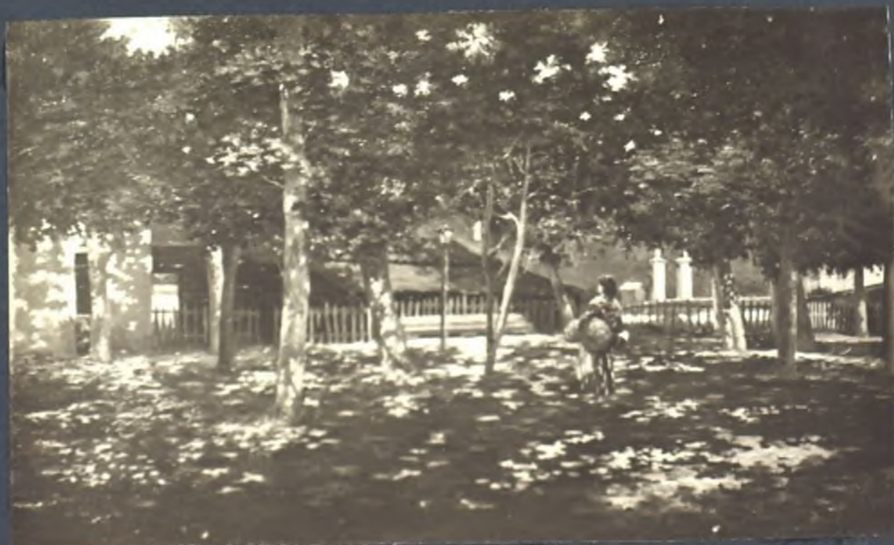
Pradera de la Virgen del Puerto