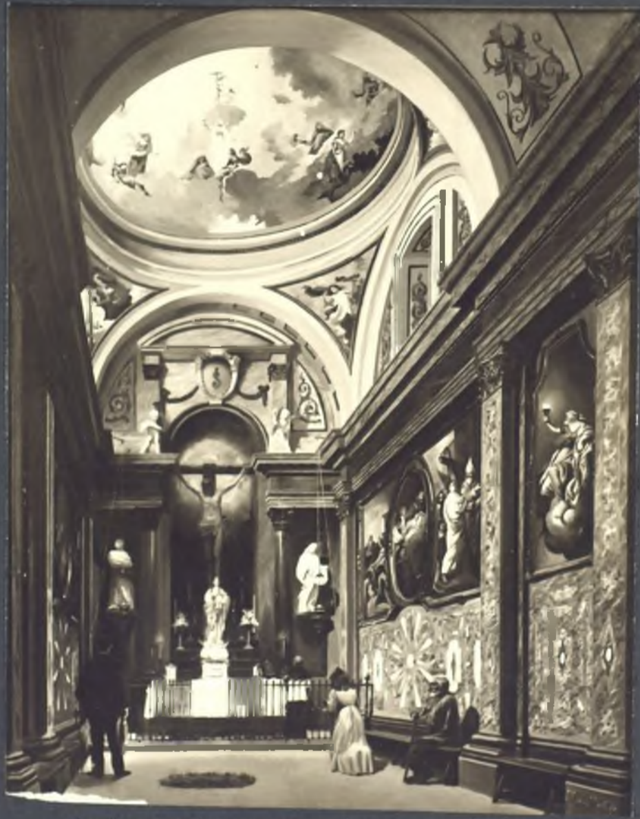
Capilla del S. mo Cristo de la Fe. Iglesia S. Sebastian.