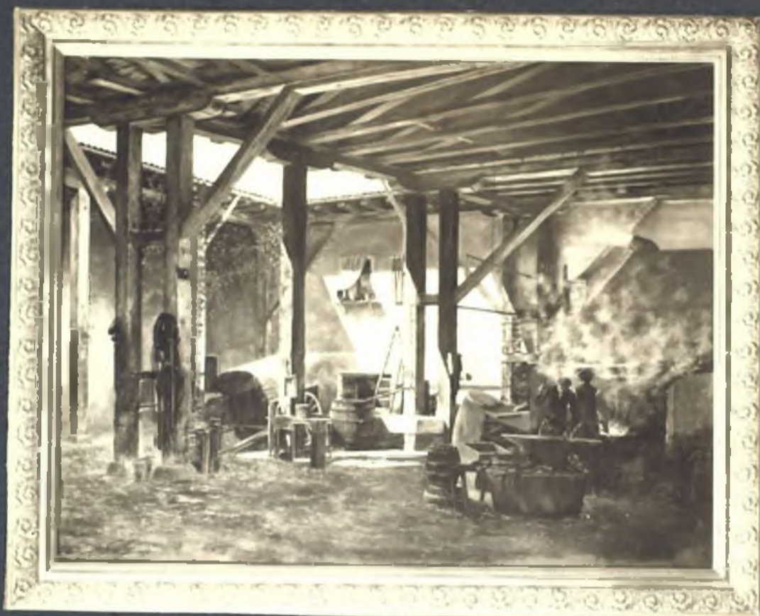
La herrería - Calle de las Huercas