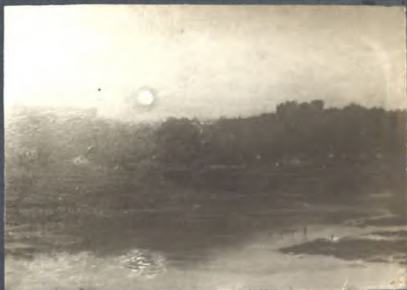
Orillas del Manzanares