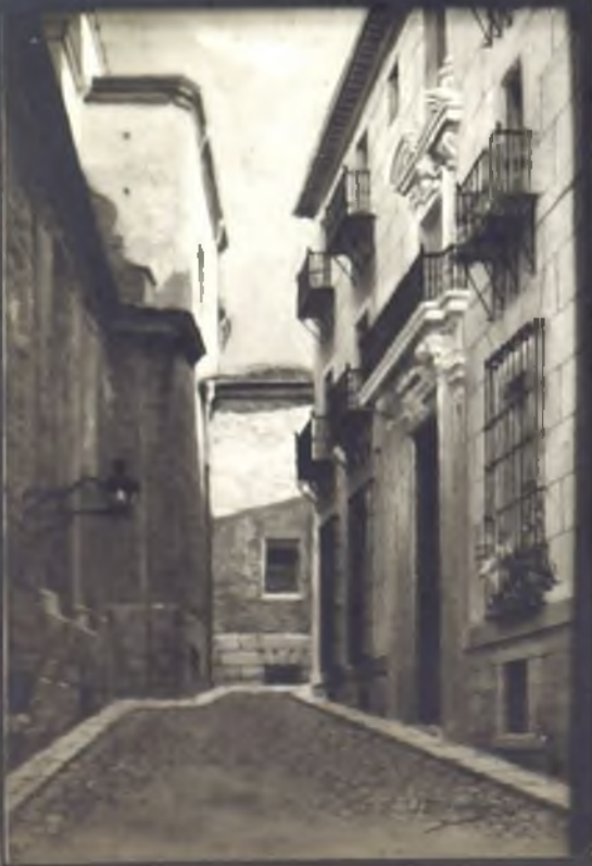
Callejon del Panceillo