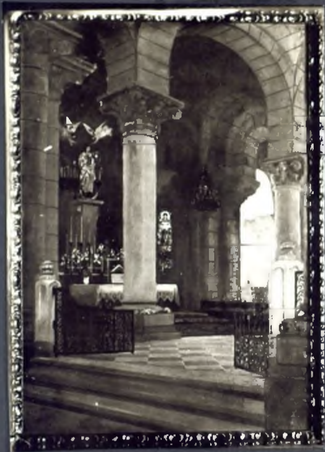
Cripta de la Almudena