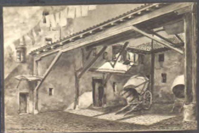
Parador de Medina