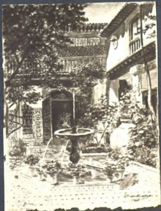
Patio casa de la Pastora (hoy de Paramo)