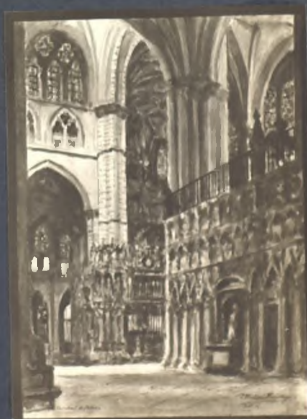
Nave de la izquierda de la Catedral