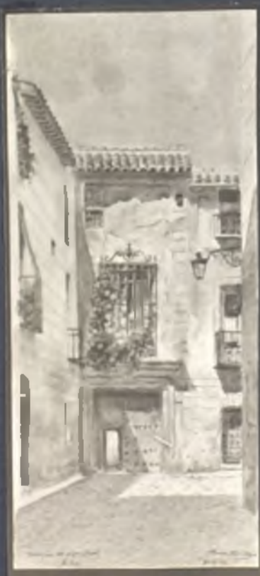
Callejon de Gigantinos