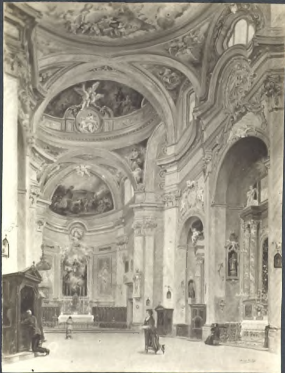
Iglesia Pontificia . (antes San Justo)