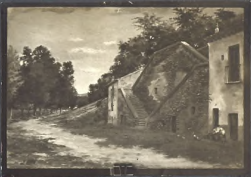
Rajada a la Pradera de la Virgen del Puerto