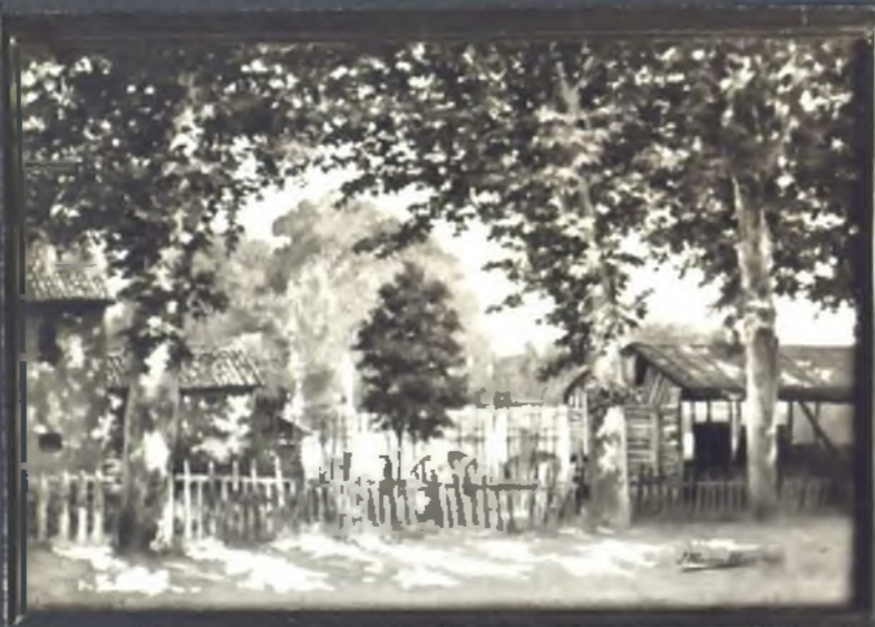
Pradera de la Virgen del Puerto