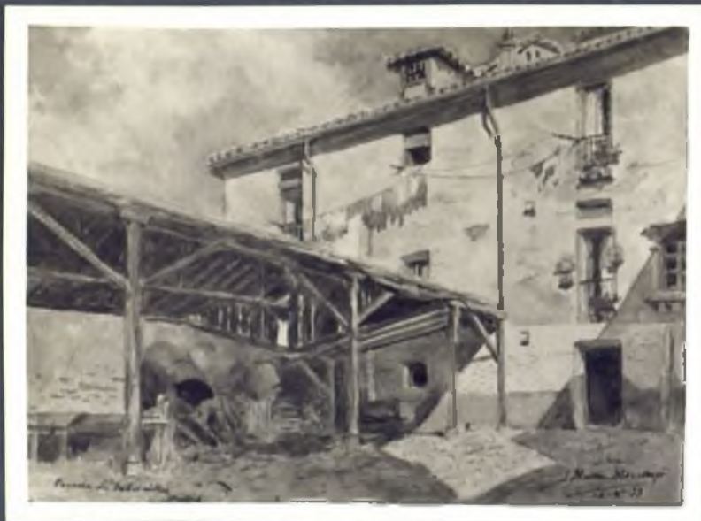
Parador de Fabernillas