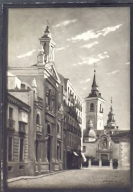
Calle del Olivar. e Iglesia San Sebastian