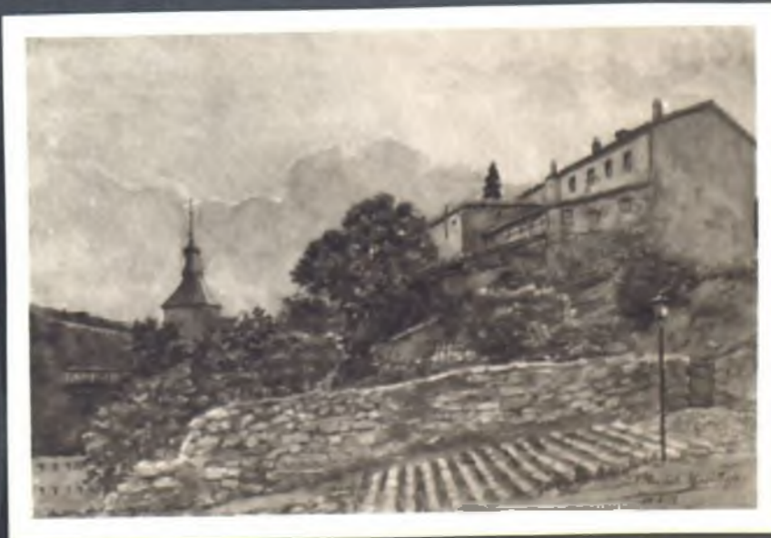
Cuesta de los ciegos