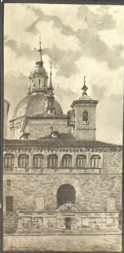
Capilla del Obispo - Plaza de la Paja