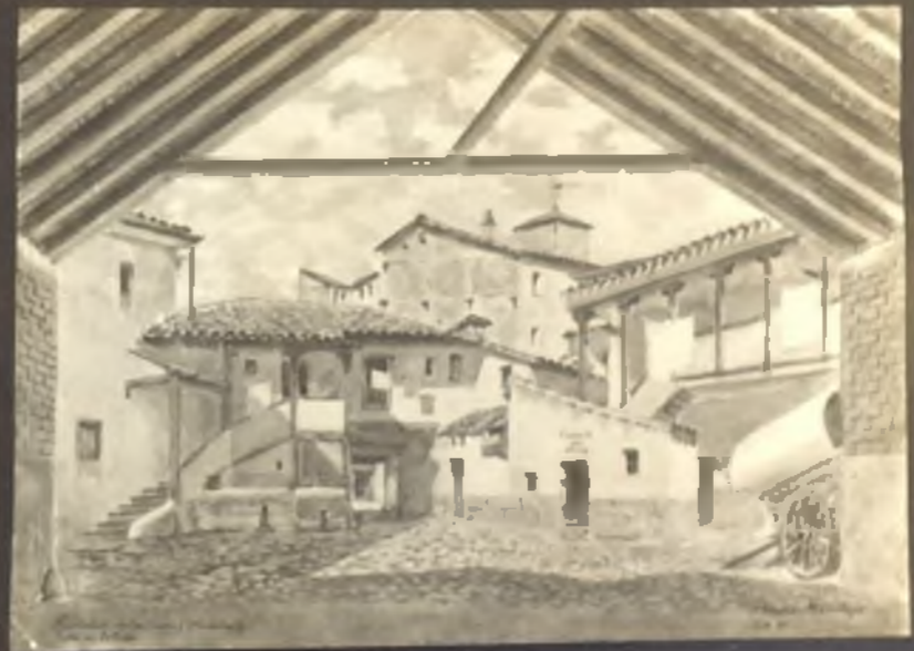
Parador de la Cruz . Calle de Toledo