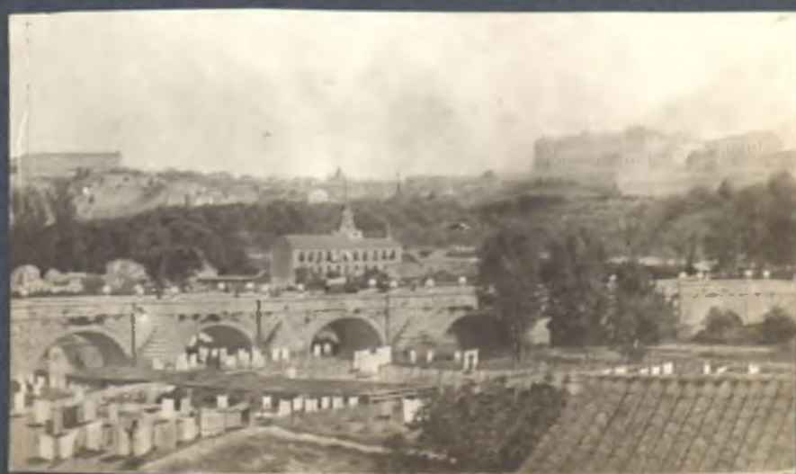
Vista de Madrid desde la carretera de S. Isidro