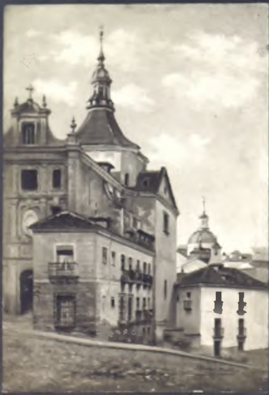
Plaza de San Juan