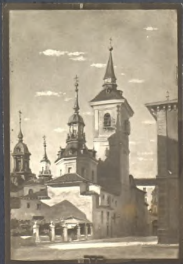
Iglesia de San Sebastian