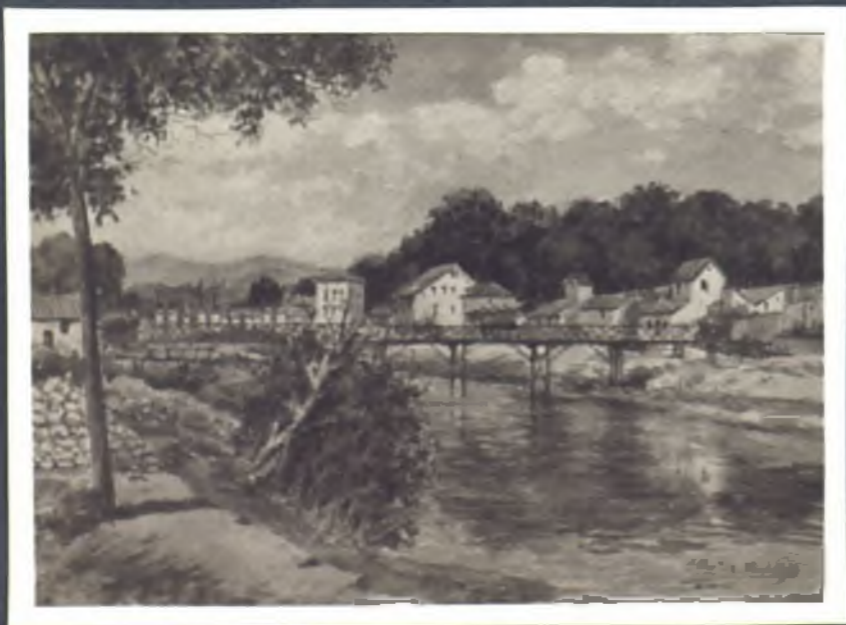
Puente de Garrido en el río Manzanares