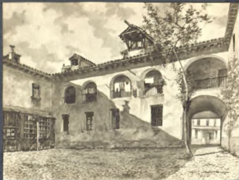
Patio de la Ferronía (Plaza del siglo XV)