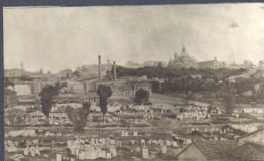
Vista de Madrid desde la carretera de S. Isidro