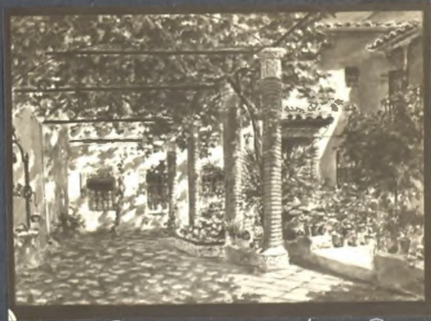
Patio de la casa Julio Pascual