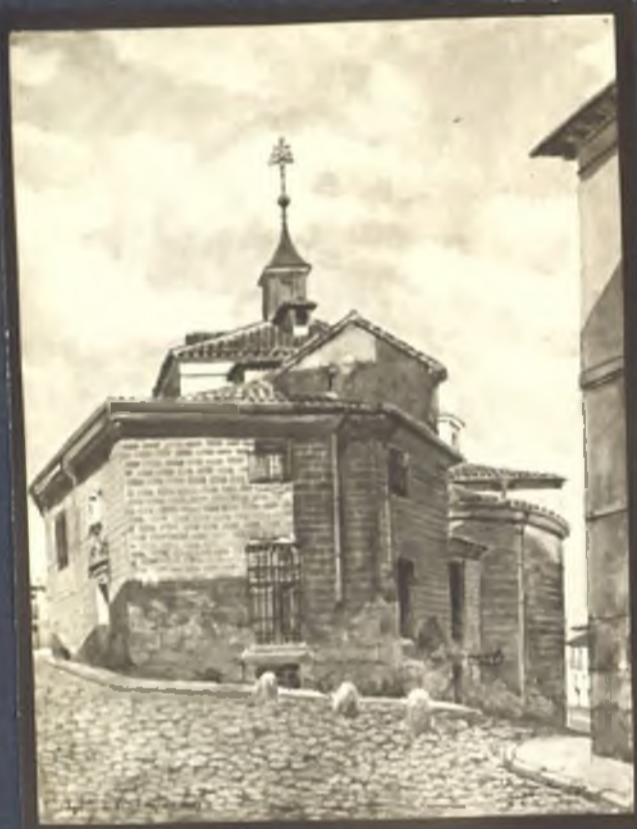
Cosianilla del Nuncio