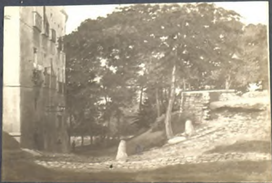
Calle de la Ventanilla