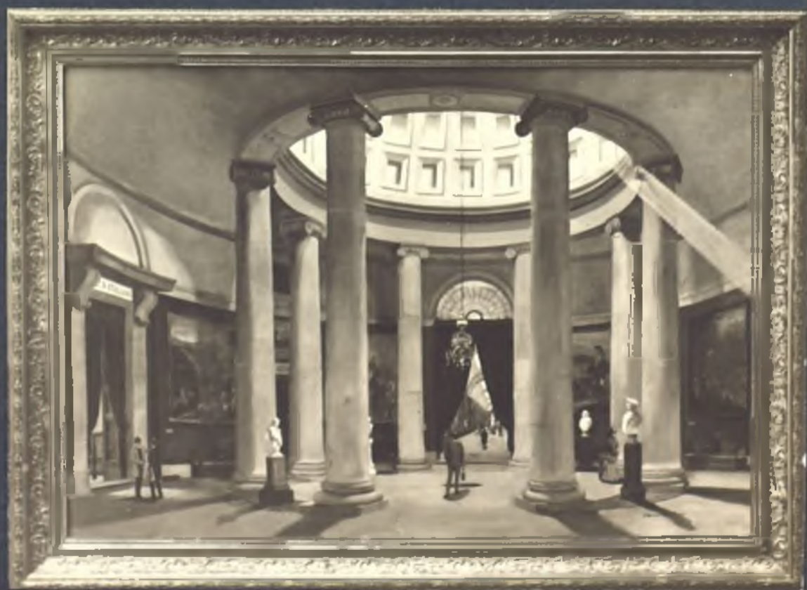
Rotonda del Museo de Pinturas