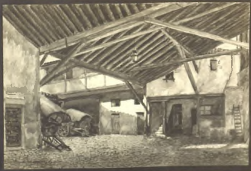
Parador de Medina . Calle de Toledo