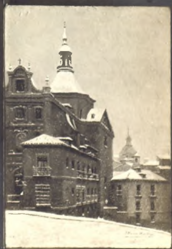
Plaza de los Consejos