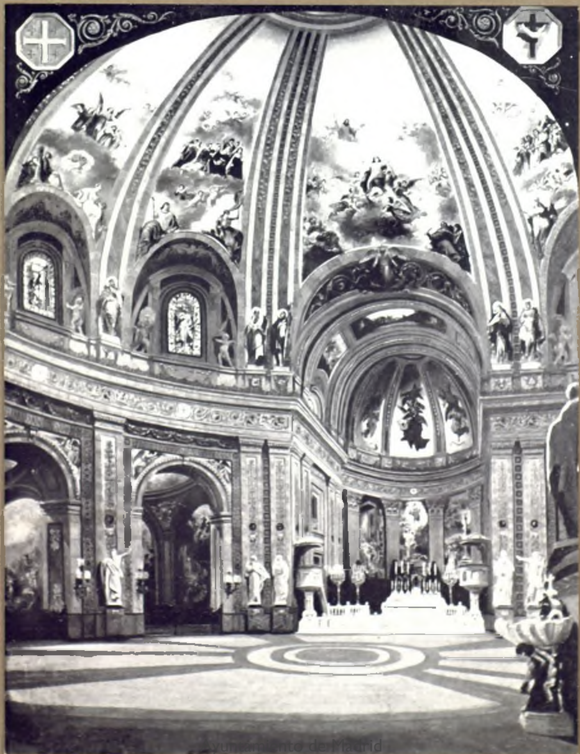
Interior del Panteón de Madrid