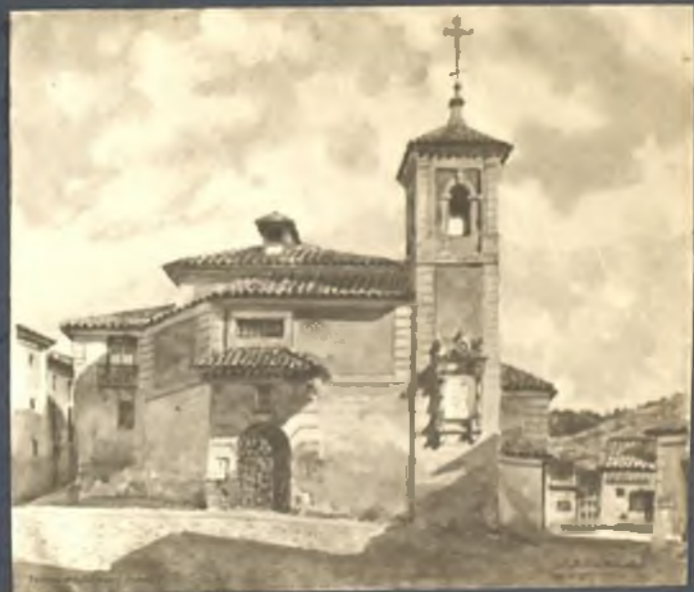
Iglesia del Salvador