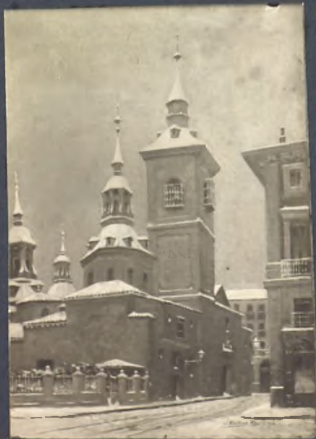
Iglesia de San Sebastian