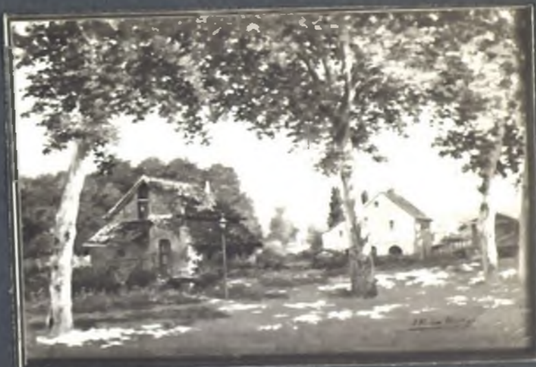
Pradera de la Virgen del Puerto