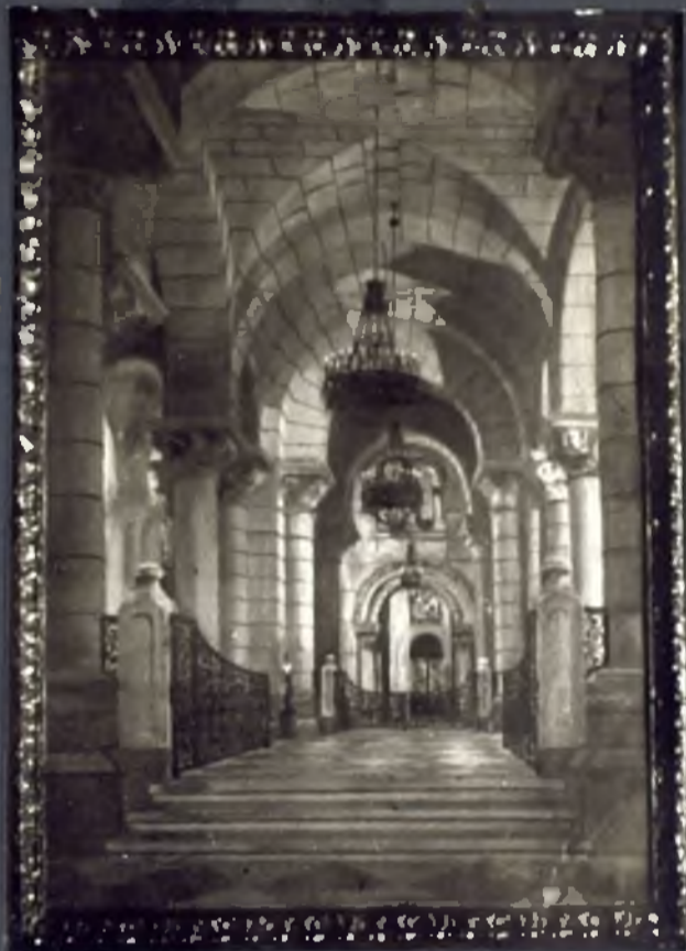
Cripta de la Almudena