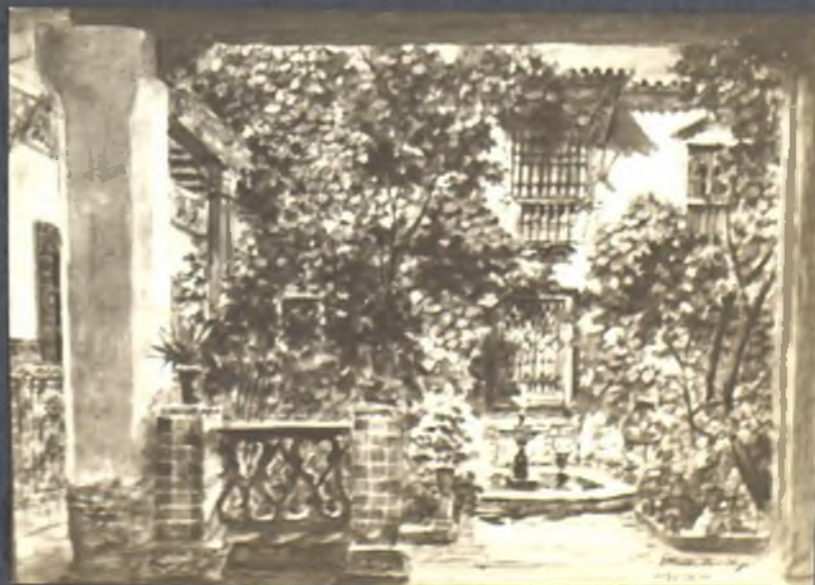
Patio de la casa de Paravies