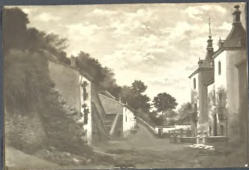
Iglesia de la Virgen del Puerto