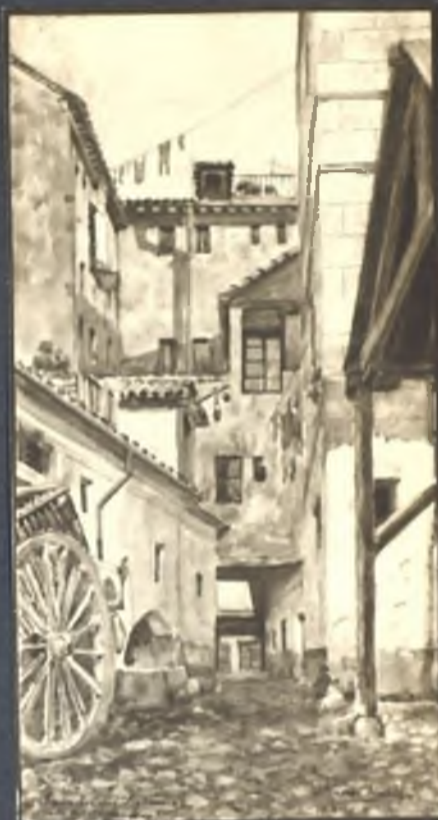
Parador del Segoviano Calle del Almendro