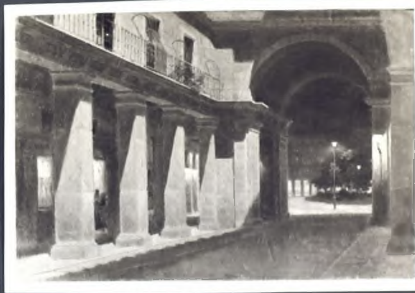
Calle de Ciudad Rodrigo