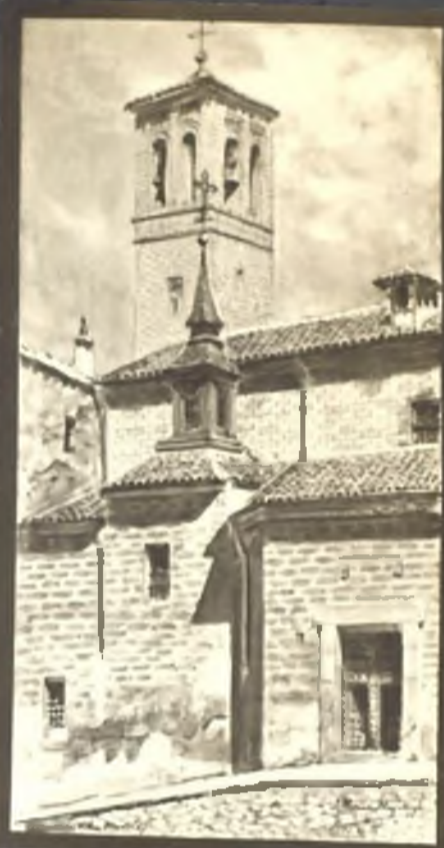
Iglesia de San Pedro