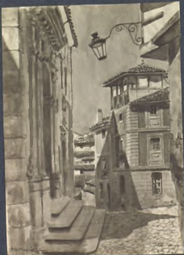
Plaza de San Justo