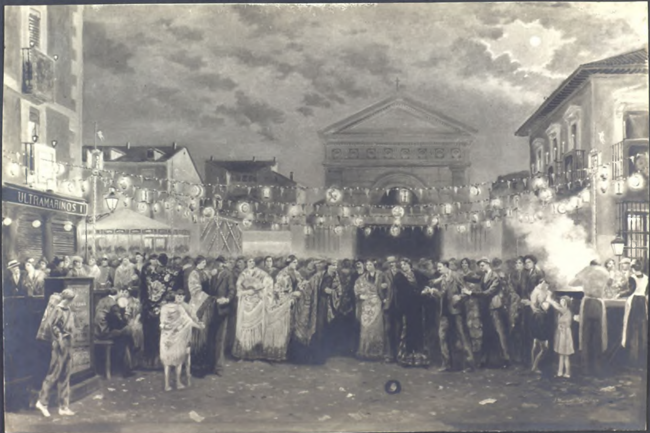
"Verbena de la Paloma"