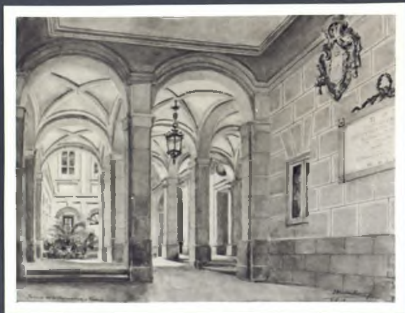
Zaguán del Palacio del Nuncio