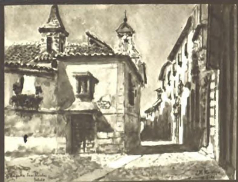
Capilla de S. Nicolas