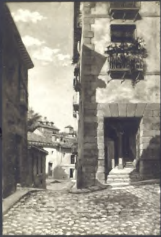
Plaza de San Javier