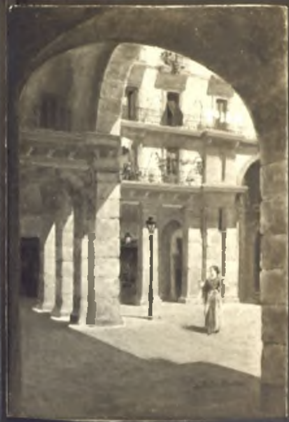
Entrada a la Plaza Mayor por la calle de Ciudad Rodrigo