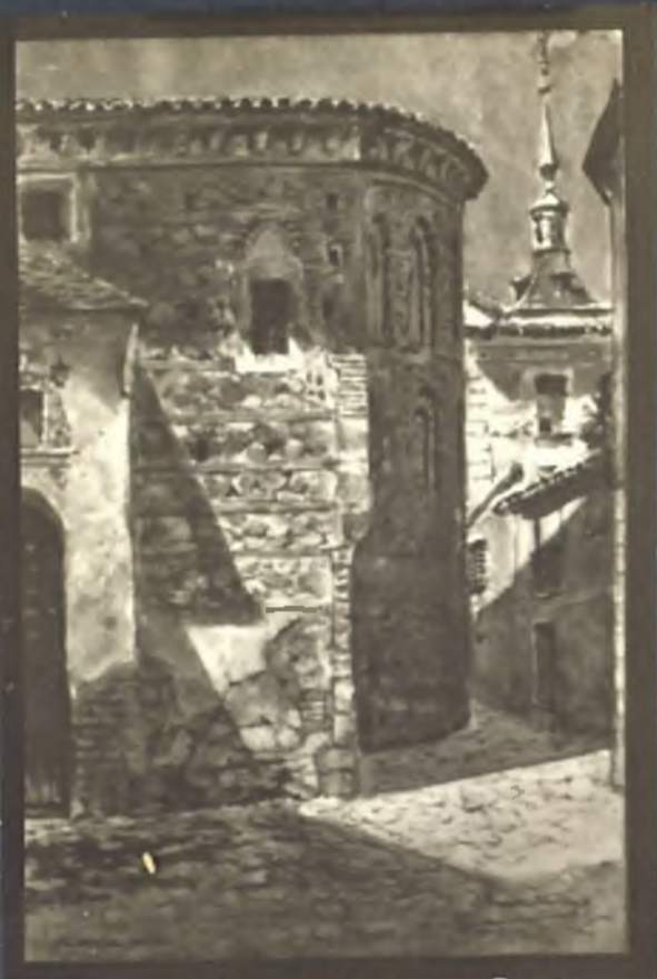
Absida de San Justo