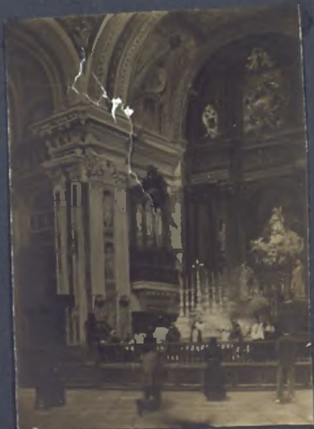
Altar mayor de la Catedral.