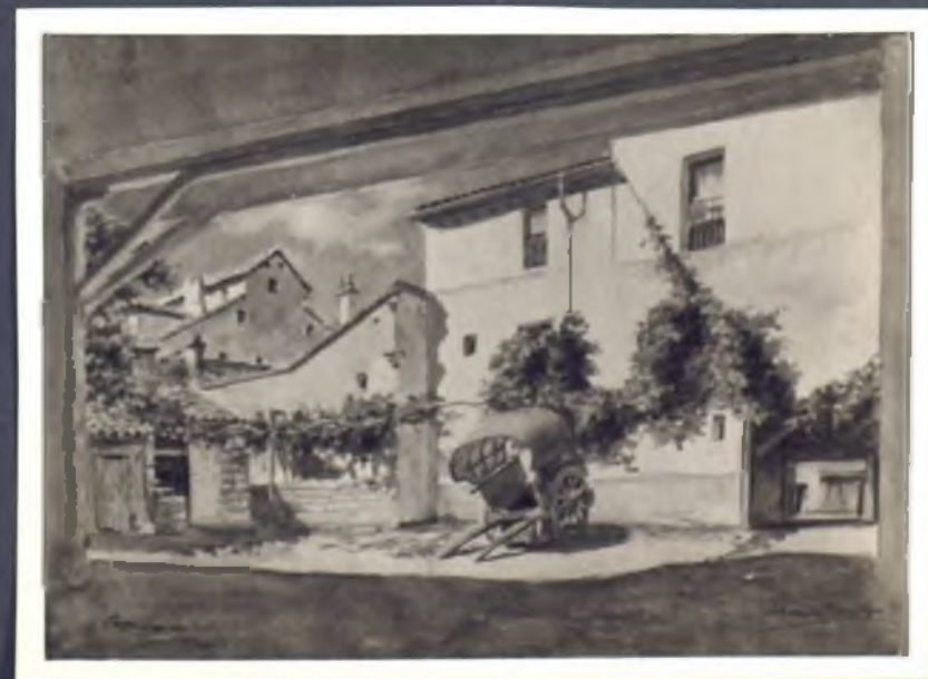
Parador de Cadix