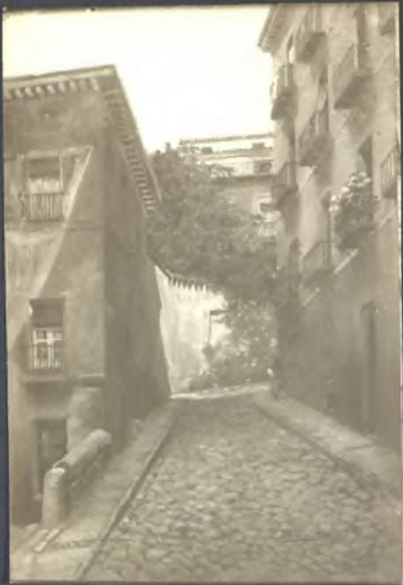
Calle del Rollo