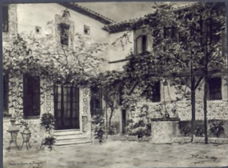
Patio de la casa de Ivan de Vargas, donde estuvo San Isidro de Criado