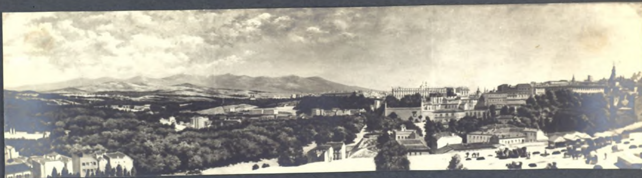
Vista panorámica de Madrid desde las Fisalitas