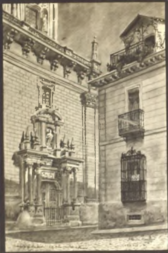
Costanilla S. Andres y calle de los Mancebos