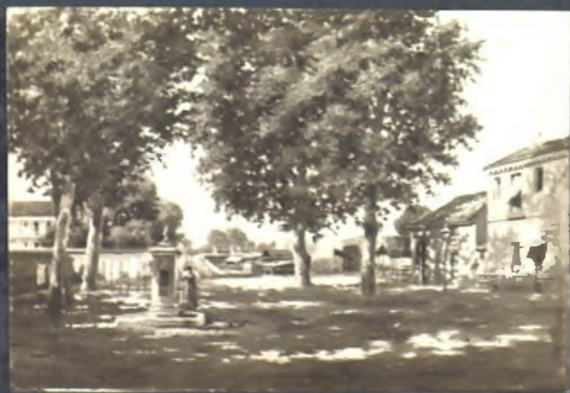
Pradera de la Virgen del Puerto