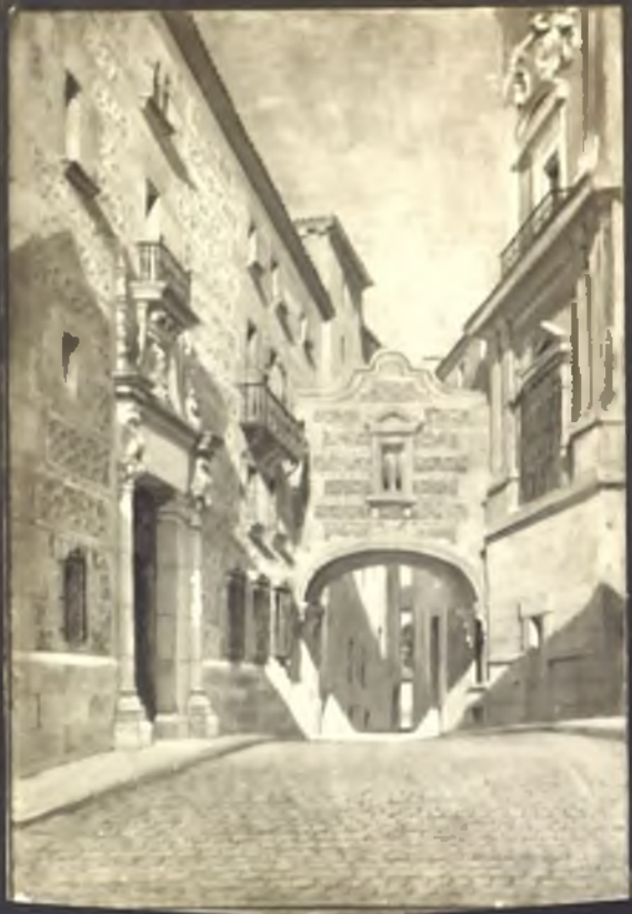
Casa de Cisneros y del Ayuntamiento