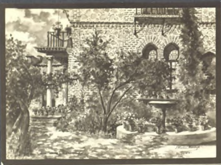
Jardin del estudio de Domech