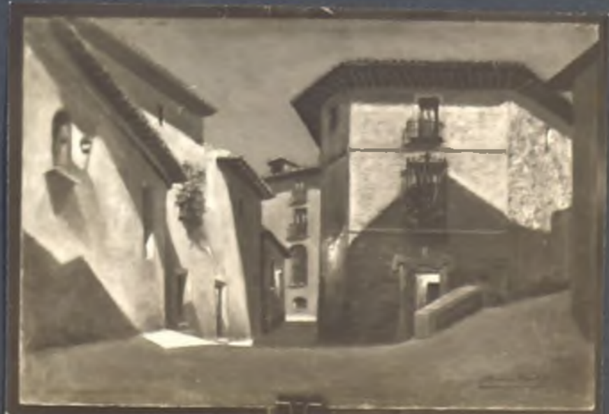
Calle de Toledo de noche