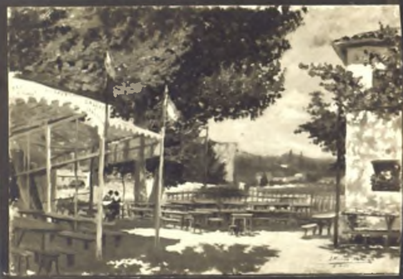
Merendero de la parra. Paseo de la Florida