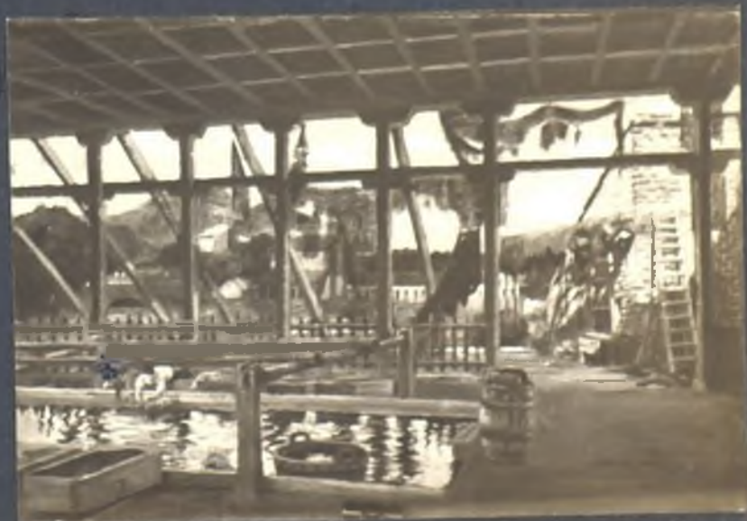
Lavadero en la Pradera de la Virgen del Puerto