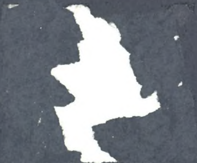
Sacristía de la Iglesia de San Isidro.