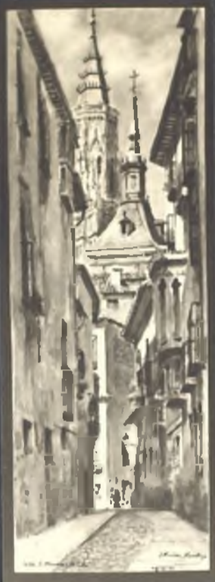
Calle de San Marcos