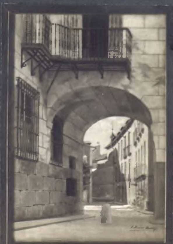
Posadizo a la calle de la Pose