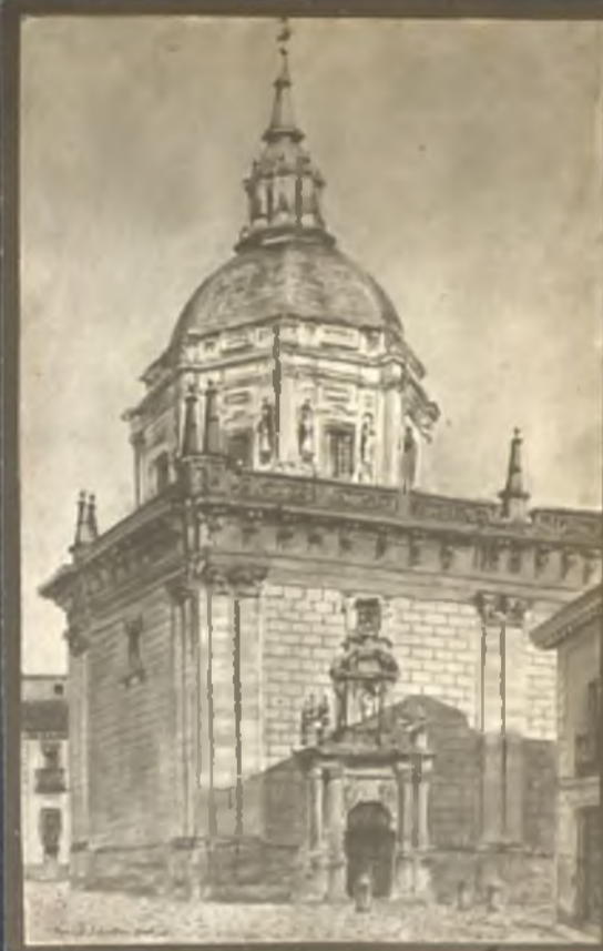
Iglesia de San Andrés