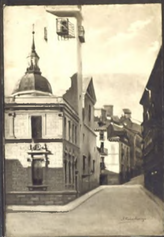
Iglesia San Gines. Calle de Bordadores.