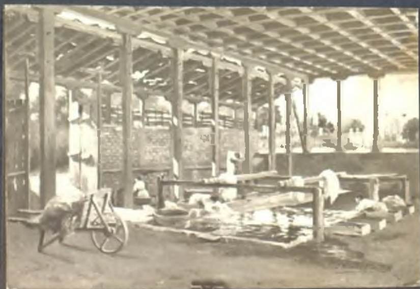
Lavadero de la Virgen del Puerto