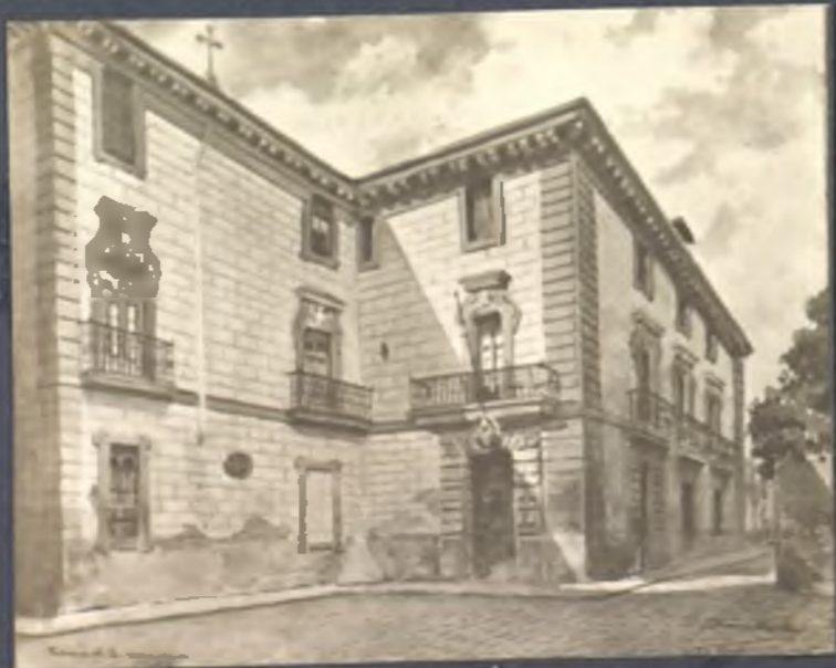
Palacio del Nuncio