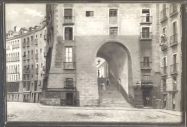
Calle de Cochilleros. Subida a la Plaza Mayor