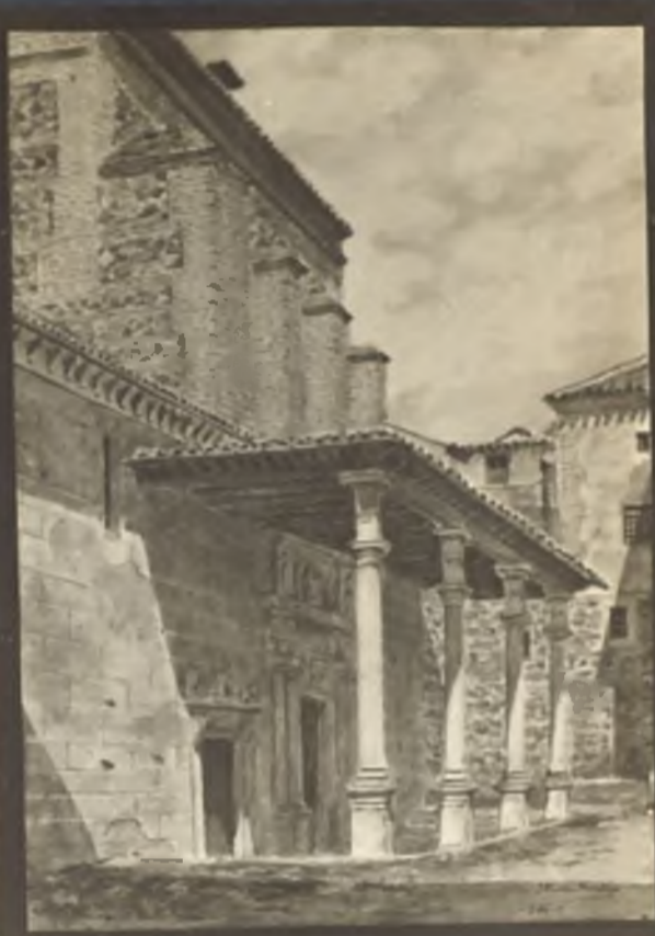
Sto Domingo el Real