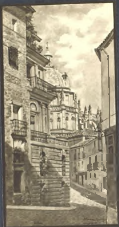
Calle de la ciudad