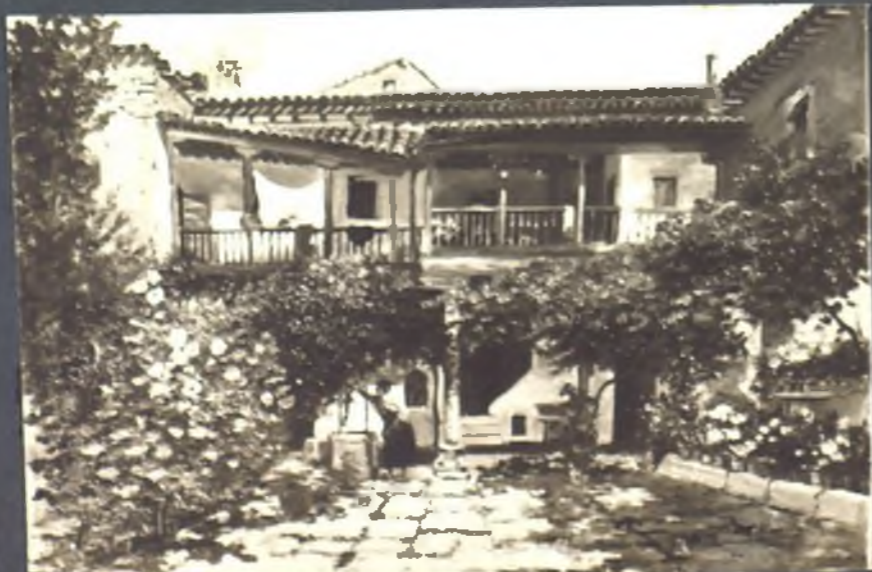
Patio de la casa nº 4 en la plaza de Valdecarlos