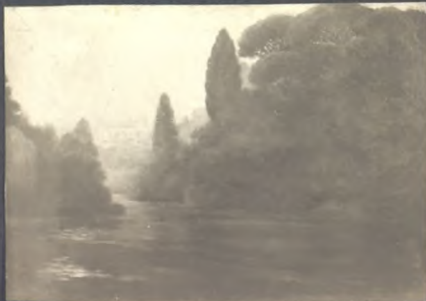
Ribera del Manzanares