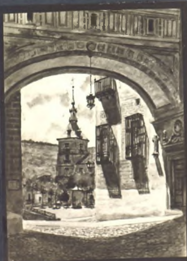
Arco de la ciudad al palacio arzobispal