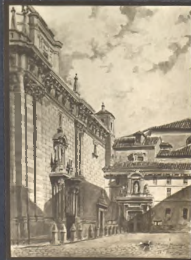
Salvador de S. Andrés - Capilla San Isidro