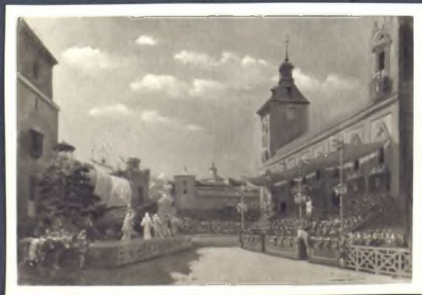
Auto de fe en la plaza de la Villa