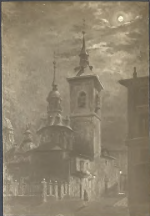
Iglesia de San Sebastian