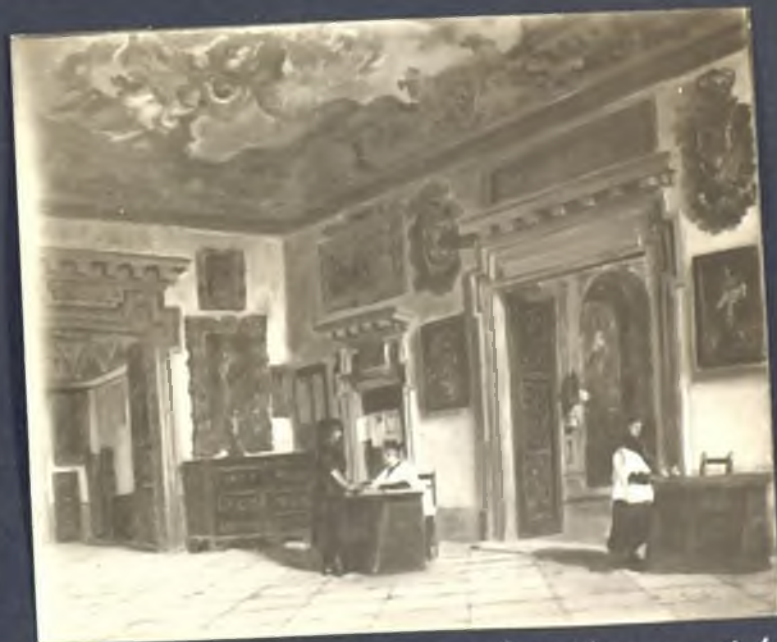
Escritorio de la Catedral (Una limama por el alma de mi padre)