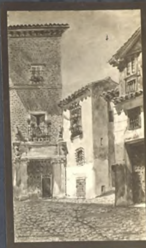
Callejon de Cordoba