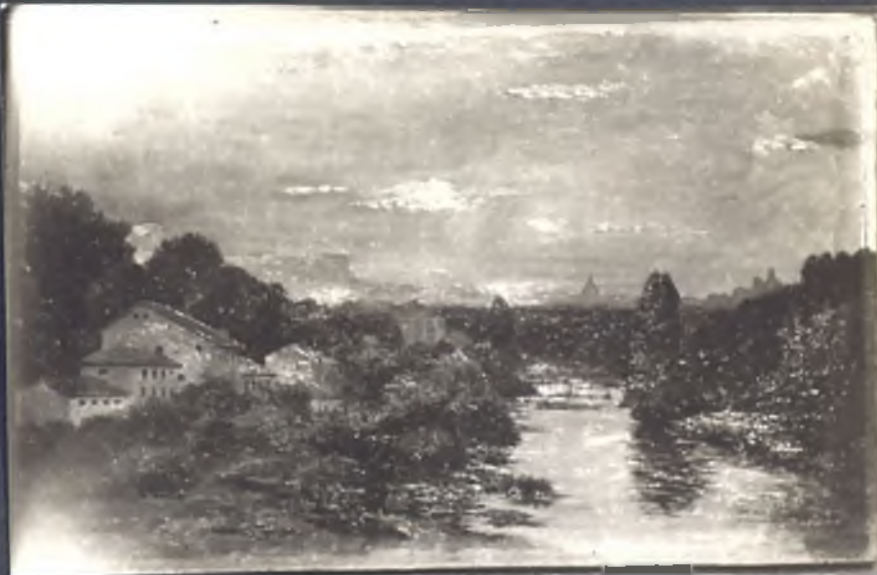
Al amanecer en Madrid desde Arrio Mauranar