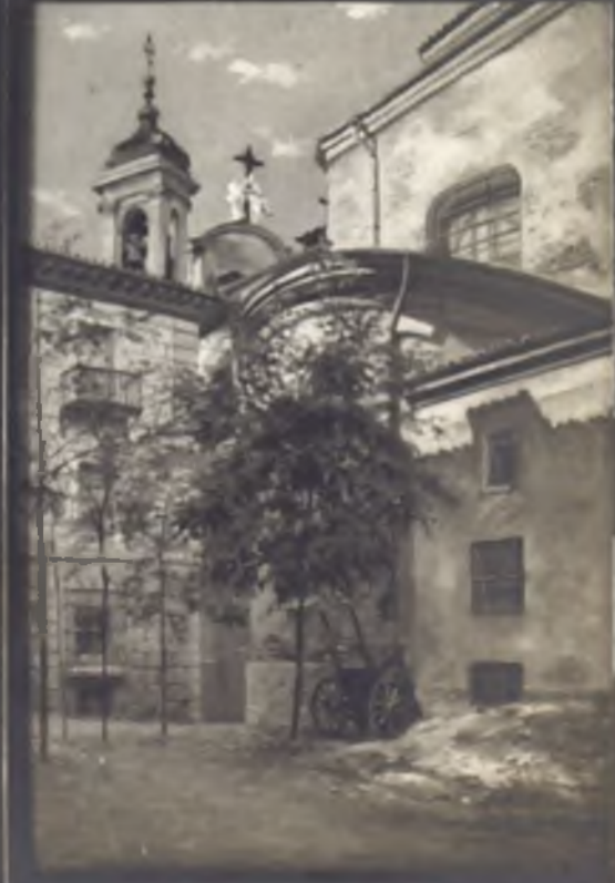
Entrada por calle del Sacramentum - Salida por la calle de la Pasa