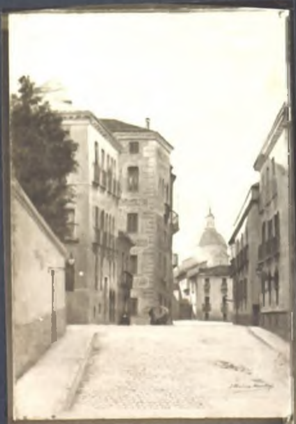
Calle del Sacramento