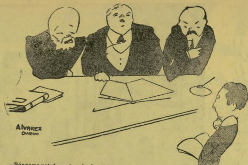
—Póngame usted un ejemplo de un animal salvaje. —Mi abuelita. —En qué libro ha leído usted eso? —En ninguno. Se lo he oído decir al papá.

En un rincó de la piná de Porta Coeli, Ramonet va conseguir de Roseta tot alló que d' ella desichaba.