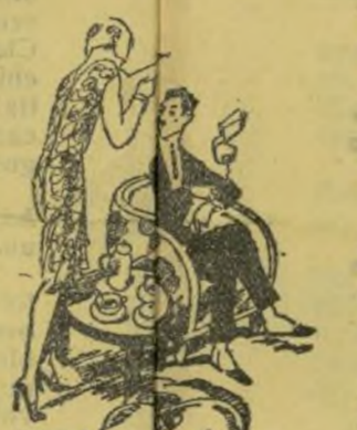
—Mira lo que diu el diari, que a Lu s'li s'ha fugat la fila en el cabóer. —¡Pobre Lu! Tan bon cabóer com tenia!