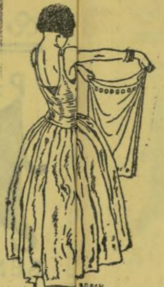
—Cada vegue vaig al cine me tinc que liar la falda.