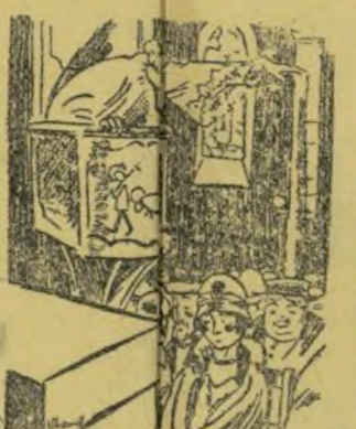
—Sobre foto caigut en el pecat de adult. Ara pen que m'he dixat el corset en ca Ernesto.