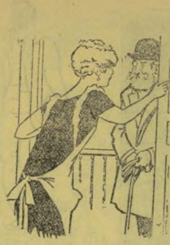
—La señora está en lo llit. —¿E' tá malalta? —No: Te visita.

—¡At'isal! —¿Hasta atra vista! ¡Pod'ies habero fet! —¿Tú no ho h' urás fet aposta, peo mos has fet la guita! —CHUSÉP SAINZ