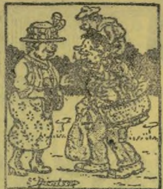
—Pera que no vaches tan carregat yo te portaré el sombrero. No dirás que no soc una dóna complasient.