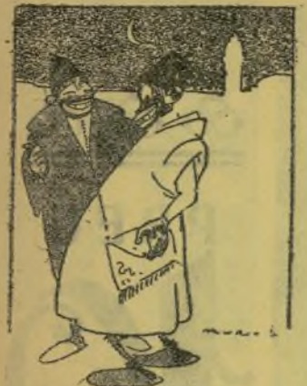
—Ha tacat la honra de la meua filla i s'ha de casar en ella. Les taques de les mores no s'es van tant fàcilment.