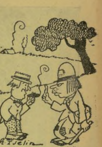
—¿Que yo no soc ningú? S'apla que tinc bones relacions. Tots els chuchus d' España me coeixen.

—Tanto y tan grande, que estoy deseando de torear allí, solamente por ponerme otra vez en contacto con ese público tan bueno, tan profundamente bueno, tan inteligente y sobre todo, tan preferido de mí. Le quiero tanto como flores tienen sus jardines...»