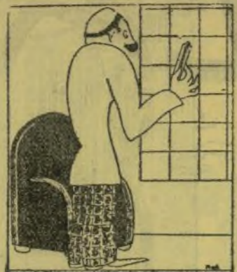
—Diuen que en Chinchilla fa molt de fret M'han portat este termòmetre d'allí i se'la com els de València.