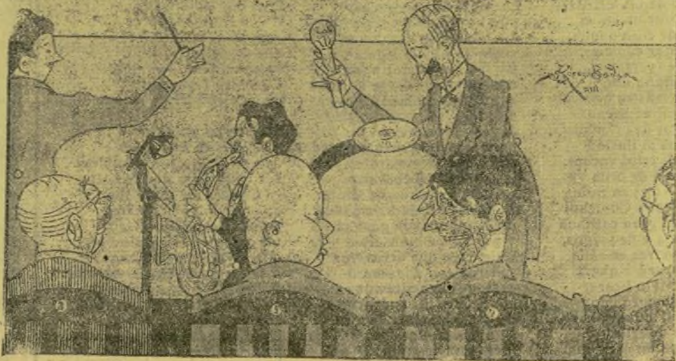
EL SEÑOR DEL 5 AL DE LA DRETA.—Bueno, yo veig estes coses y el moño se me posa de punta.