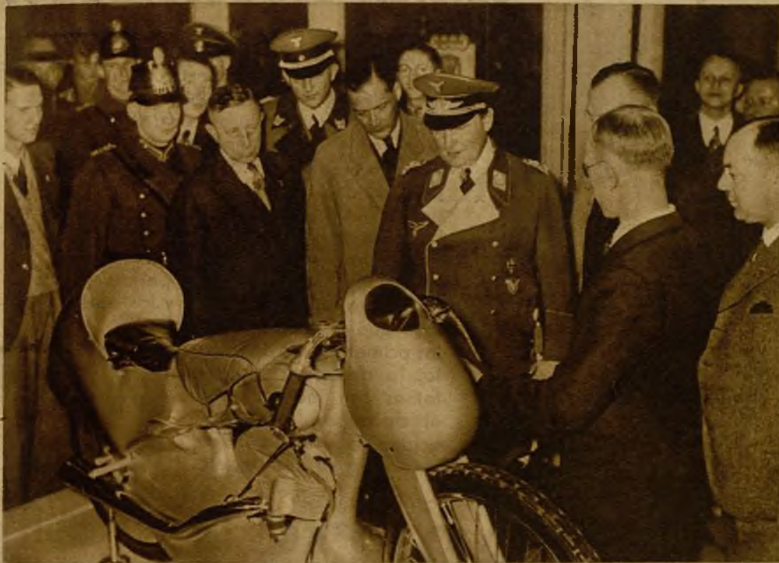
Un bello ejemplar motociclista en el Salón de Berlín.—El doctor Göring examinando la "moto" para records, que constituyó una de las atracciones de la sección motociclista de la Autoschau, y en la que la concepción aerodinámica tiene la aplicación más atrevida y más "artística" al mismo tiempo