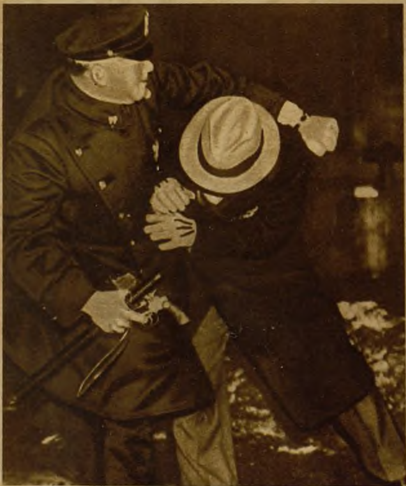
Con motivo de la huelga de los empleados de ascensores de Nueva York se han producido disturbios callejeros. He aquí el momento en que un Policía detiene a un manifestante, al que sujeta con el brazo izquierdo, sin hacer uso de su bastón ni de su pistola, que retiene en la mano derecha