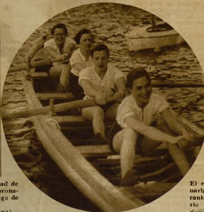
El equipo femenino de Veterinaria en plena actuación, durante el Campeonato universitario de remo, en la Casa de Campo