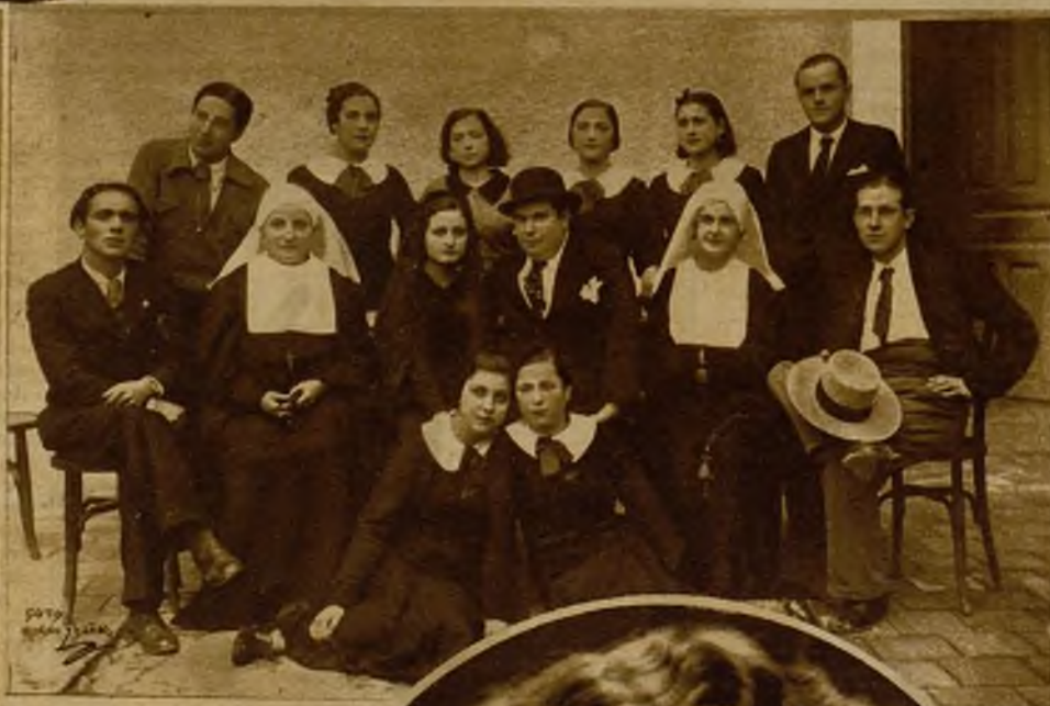
El cuadro artístico de la Sociedad obrera La Caridad, de La Roda (Albacete), que ha interpretado "Madre Alegría" en una función benéfica