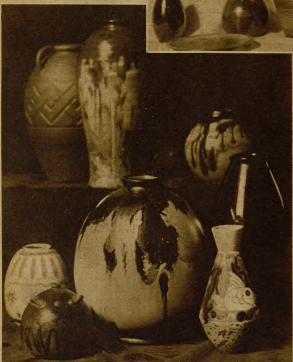
Otro grupo de los magníficos ejemplares de cerámica de la Exposición de Alfonso Blat

Están bien Manises, Alcora, Talavera... Pero vamos a ver si es posible renovar los moldes antiguos y "seguir" la tradición de nuestra industria artística. Seguir, sin estancarnos en los procedimientos y modelos de una época rudimentaria.