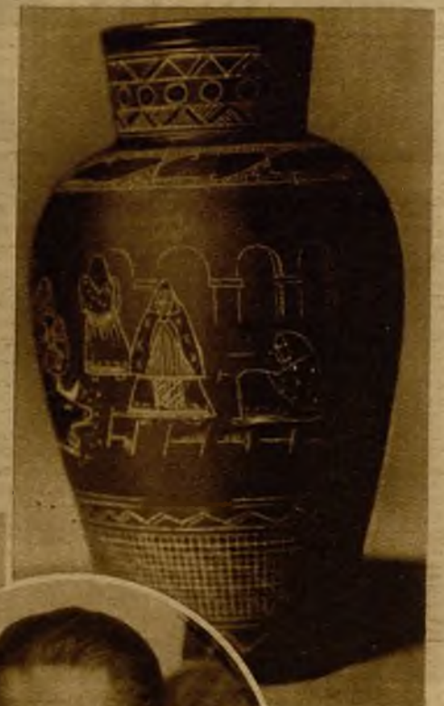
Uno de los más interesantes y atrevidos trabajos que expone Alfonso Blat

Los visitantes de la Exposición Blat se quedarían sorprendidos si pudieran explicarse la génesis de cada una de las piezas que atraen su mirada. Ese jarrón