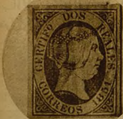
El sello más caro de España. Sólo hay cuatro en el mundo

El día 2 de abril va a inaugurarse en la capital de España una Exposición filatélica nacional, que permanecerá abierta durante seis días. Es la única Exposición que hasta ahora se celebra en Madrid de sellos de Correos; tiene, pues, una gran importancia para nuestros compatriotas coleccionistas, que mostrarán a los espectadores el producto de sus trabajos al exhibir álbumes artísticos donde se deje ver el cuidado de la ornamentación y la riqueza de algunos ejemplares tal vez únicos en el mundo.