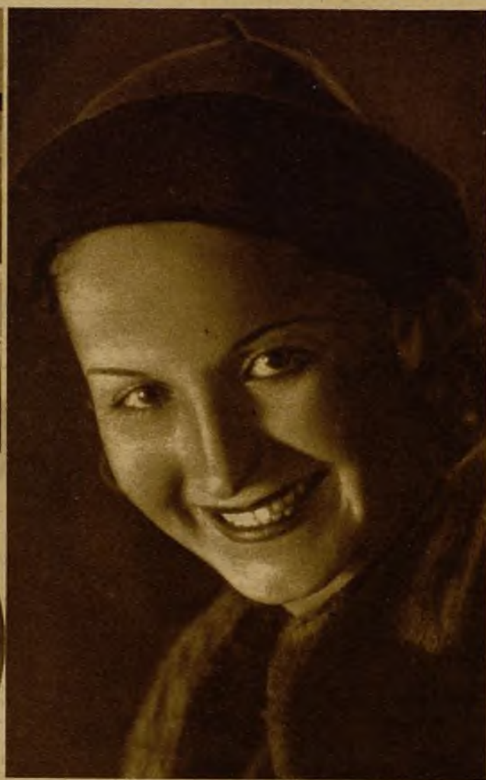
Micaela de Francisco, notable tiple ligera, que actuará en el té concierto organizado por Seelta Club el próximo martes