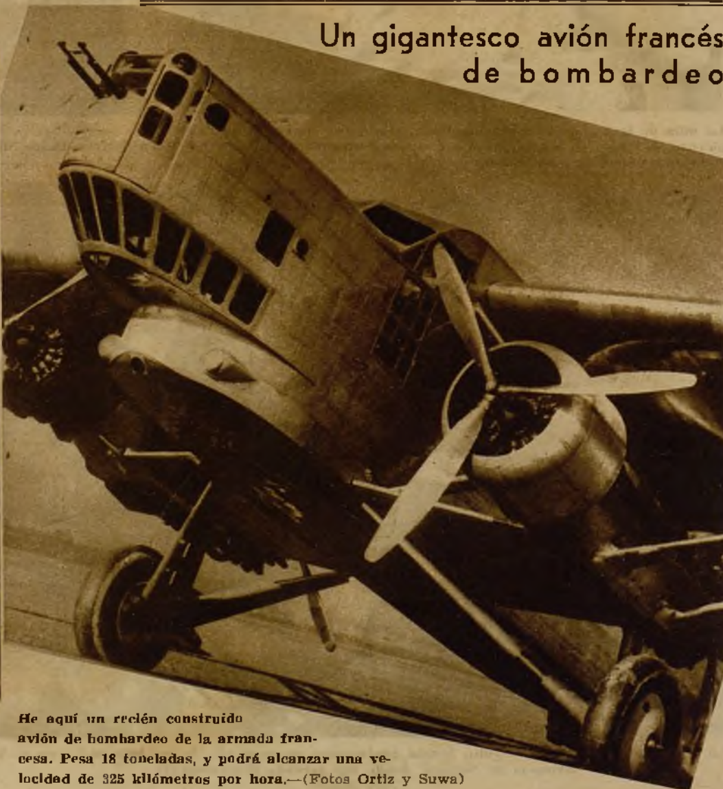
He aquí un recién construido avión de bombardeo de la armada francesa. Pesa 18 toneladas, y podrá alcanzar una velocidad de 325 kilómetros por hora.