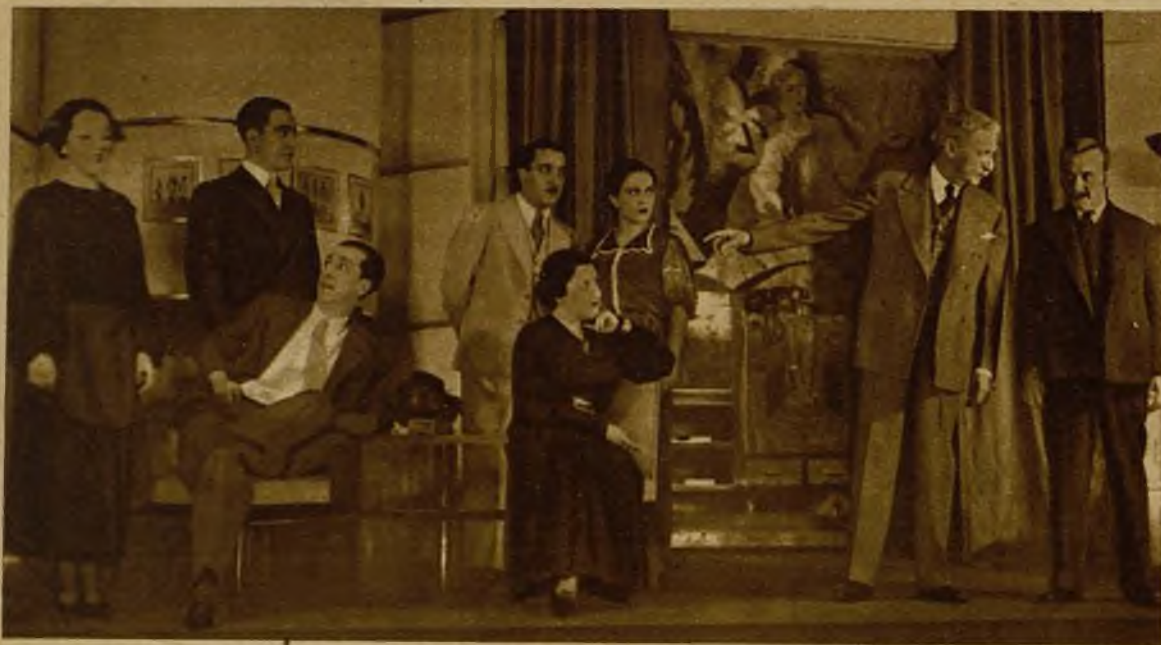
Una escena de la obra "Batalla de rufianes", original de Bartolomé Soler, último estreno del teatro Lara