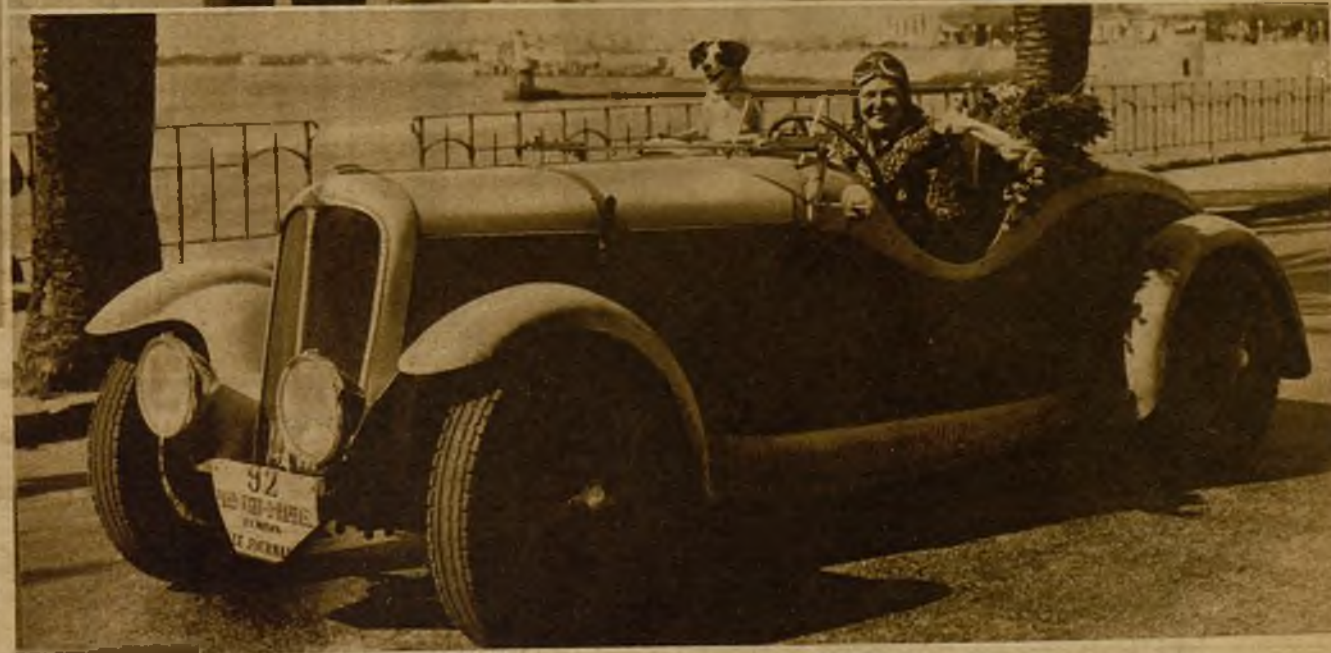
El "rallye" automovilista femenino París-San Rafael ha sido ganado por madame Renault, que tiene un buen automóvil y un buen perro