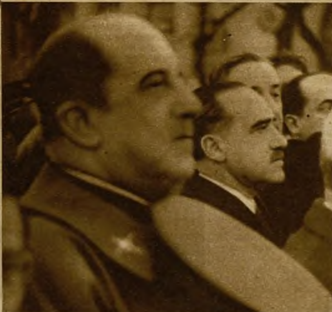
Los ministros de la Guerra y Gobernación en la presidencia oficial de la fúnebre comitiva