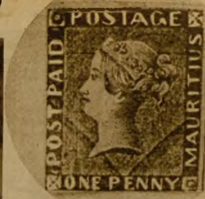
Un "Mauricio", sello por el que se paga crecidísima cantidad

Y comienza a sacar álbumes, sobres, pliegos, hojas con colecciones completas españolas y un sinfín de ejemplares extraños que nos abrumaban por su cantidad y por su precio. Cada vez que ofrece uno a nuestra contemplación nos dice el precio que le corresponde con el catálogo a la vista.