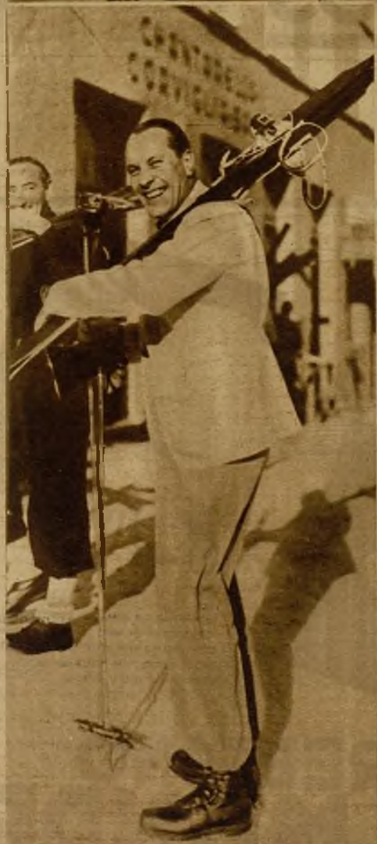
Hans Stuck, el famoso corredor de la Auto-Unión, se entrena... practicando el esquí, que considera como una preparación excelente para el otro deporte