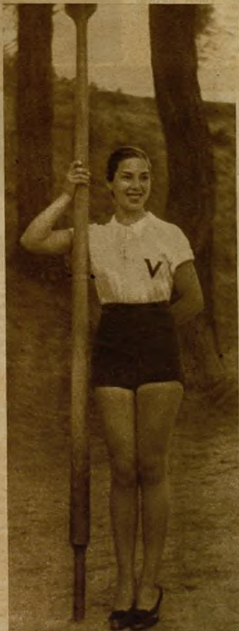
Una bella remera del equipo de la Facultad de Veterinaria, que toma parte en los campeonatos universitarios que tienen lugar en el lago de la Casa de Campo