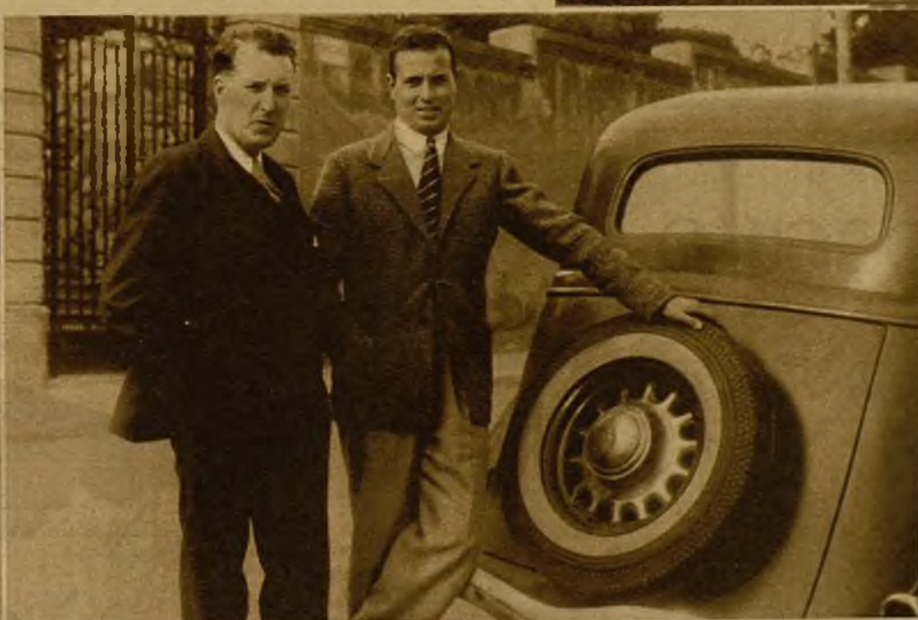
Los hermanos Galindo con su nuevo neumático "Ultrafreno" para automóviles, que en las pruebas oficiales hizo demostraciones perfectas de seguridad sobre el asfalto mojado