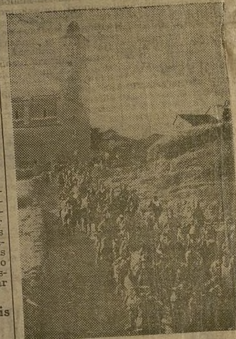
a poco van transformándose en potente Ejército regular, así nos lo demuestra.

El pueblo español, la juventud española, están plenamente convencidos de que la victoria ha de ser nuestra. La oposición que las bravas Milicias, que poco