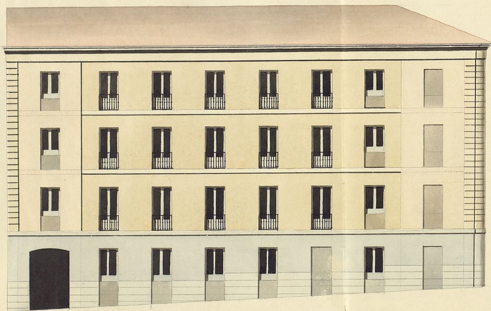
Fachada á la C.ª de Chinchilla

Demonstración en plantas y alzados de las fachadas parales de la Casa que ha de edificar en su planta, en la C.ª de Tacómetro con fachada á la de Chinchilla, tomada por la primera con los n.ºs 19, 23 y por la segunda con los n.ºs 13, 17 de la manzana 360 las cuales presenta su Duque D. Miguel Pérez Meló al Excmo Ayuntamiento de esta Corte para su aprobación.