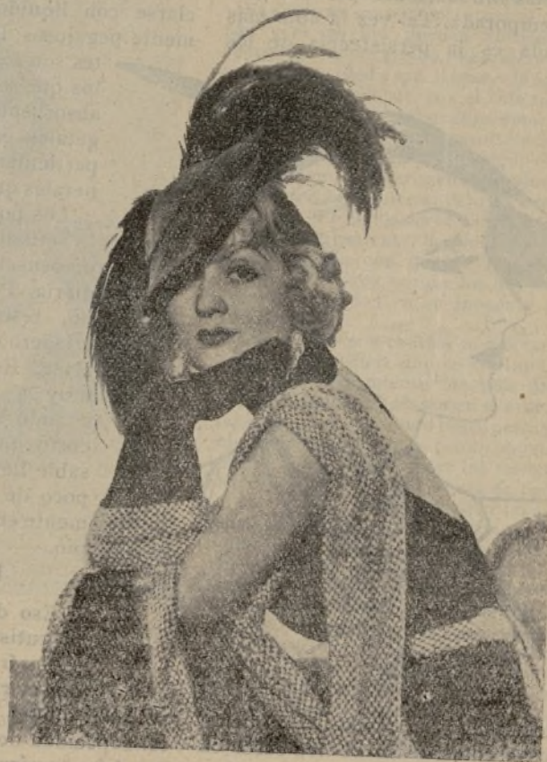
CONSTANCE BENNET, estrella admirada de Artistas Asociados