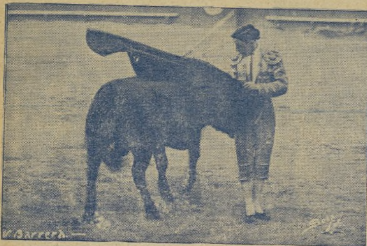
Este momento de gracia, saber y dominio, con la muleta, pertenece al artista VICENTE BARRERA, el que, sin bombos ni ruidos, está firmando esta temporada tantas corridas como el que más. / ¡Justo premio a lo mucho bueno que derrochó en los ruedos la temporada pasada!