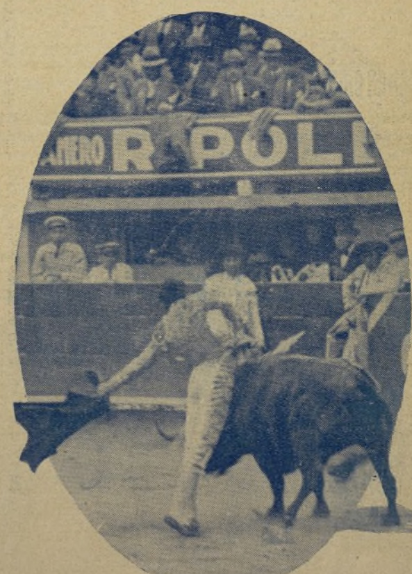
ARMILLITA CHICO, el ídolo de los mejicanos, demostrando por qué lo es en este muletazo, efectuado en la plaza de El Torero la temporada anterior. / ARMILLITA CHICO será esta temporada el niño mimado de las Empresas, pues para ello piensa el mejicano dar en los ruedos tardes de gloria.