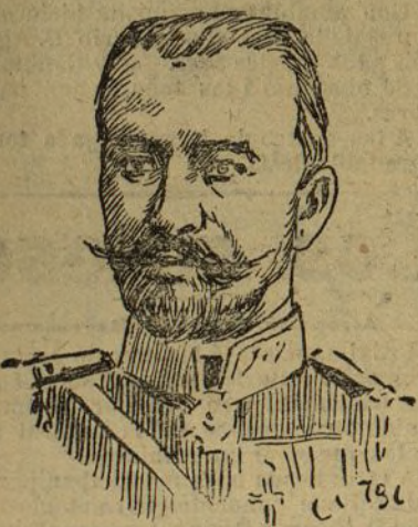
El conde de Sacharoff

— París 4. De Liao-Yang comunican que, en vista de los altos precios que ofrecen los rusos por toda clase de vituallas,