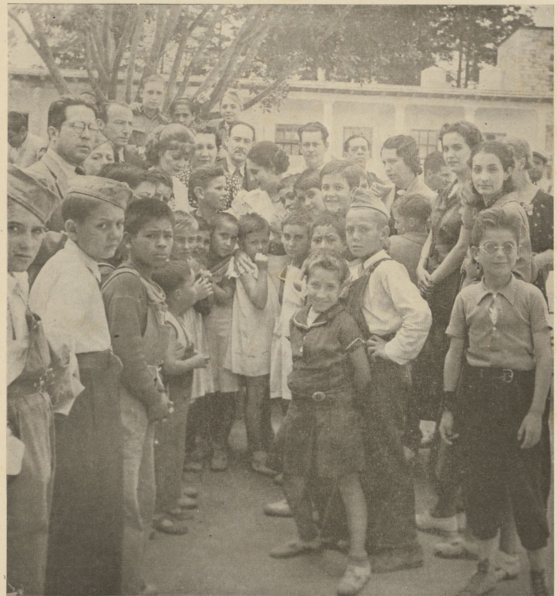
Nuestra Presidenta de Honor, Amalia S. de Cárdenas, esposa del Presidente de la República, rodeada de niños españoles durante su visita a la escuela “España-México” de Morelia.