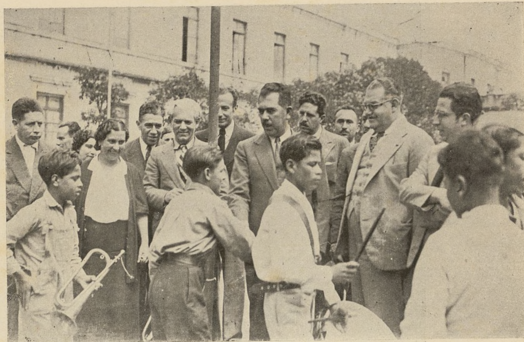
El Presidente con los niños españoles.