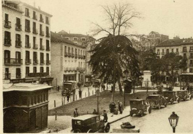
PLAZA DEL PROGRESO (Madrid)

Esta plaza ha sido formada en el solar del Convento de la Merced, que ocupaba un lugar dando a tres calles: la de Cosme de Médicis, entre Colegiata y Duque de Alba; la de la Remedios, entre Barrionuevo (Conde de Romanones) y Relatores, y la de la Magdalena, que empezaba en la de Cosme de Médicis.