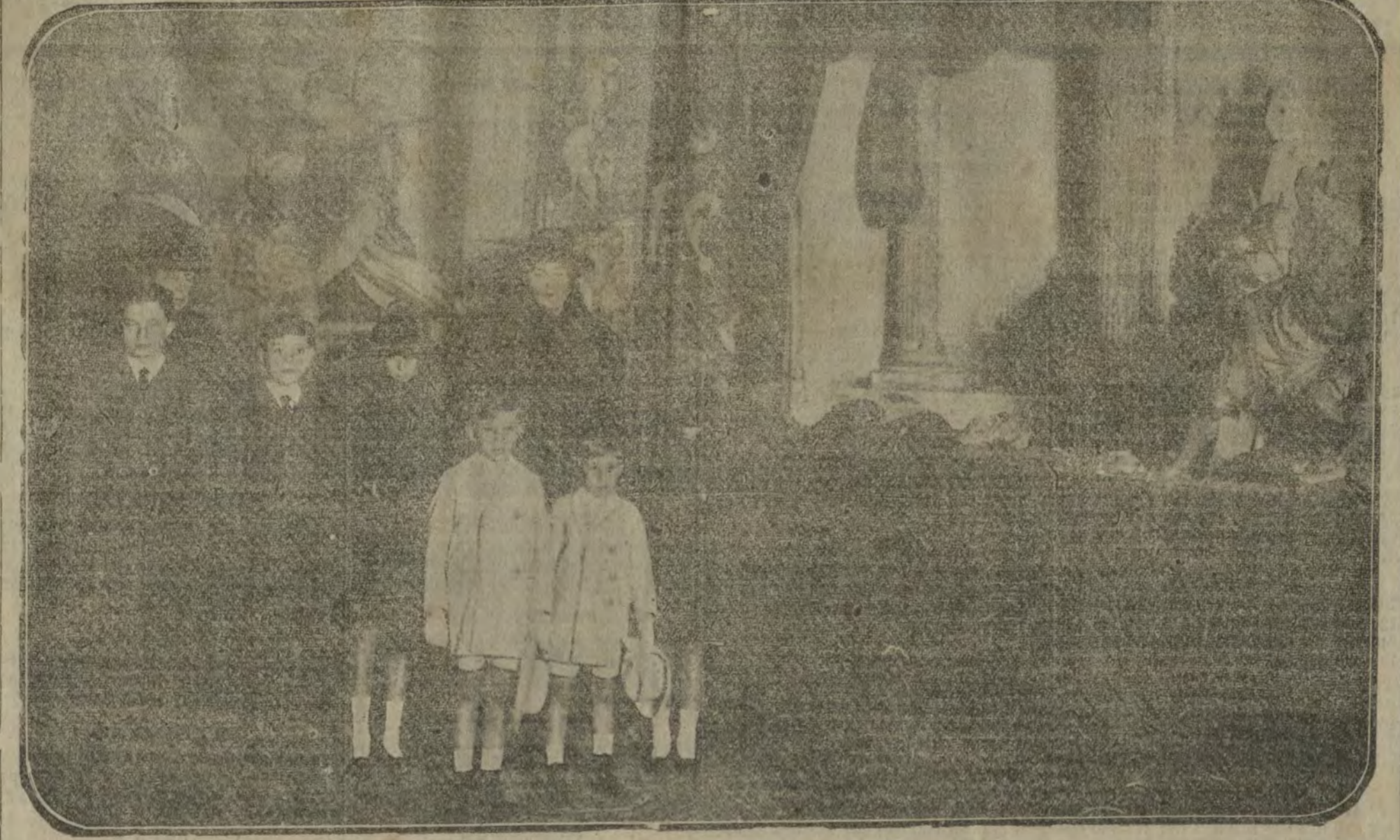
SS. MM. las Reinas Doña Victoria y Doña María Cristina, acompañadas de las infantitas y de los infantes en la Academia de San Fernando donde se inauguró ayer un "Nacimiento" con objeto de recaudar limosnas para los niños austriacos.

Bern 2.—Señal al "Bester Vorwärts", el Congreso suizo de estudiantes socialistas se ha adherido a la Tercera internacional. Se ha producido una escisión en el Congreso internacional de estudiantes socialistas llegados a Ginebra al mismo tiempo que el Congreso nacional. Los delegados de Francia, Holanda, Yugoslavia, Italia y los comunistas alemanes se han pronunciado por la Tercera internacional y se han constituido en Federación comunista internacional de estudiantes.