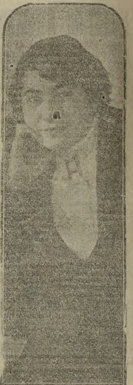
Margarita Xirgu, primera actriz del teatro del Centro; esta noche celebra su beneficio

En el elevado tono de la curiosa discusión. Todos íbamos al teatro Principal a ver a Margarita.