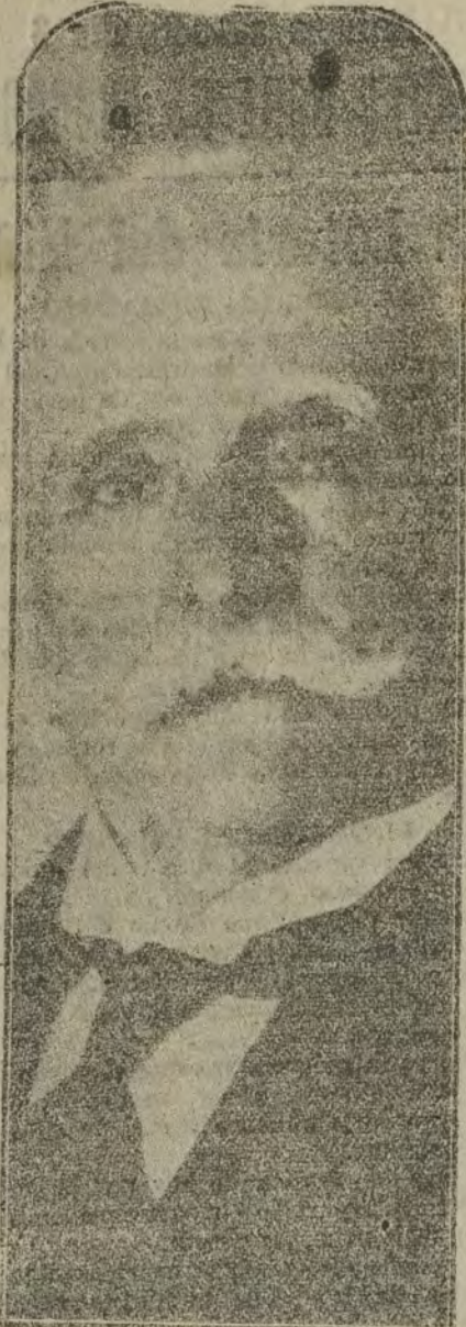
El general Ochando, autor de la discutida proposición de ley presentada al Senado, y que ayer nos hizo unas interesantes declaraciones que hoy han reproducido casi todos los periódicos madrileños.

Nada, nada... ¡Aceptable ese libro! "El Estado contra el hombre". Le es actualidad.