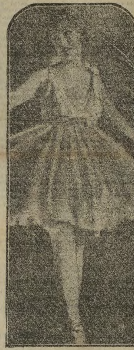
Isabel Straford, famosa bailarina canadiense.