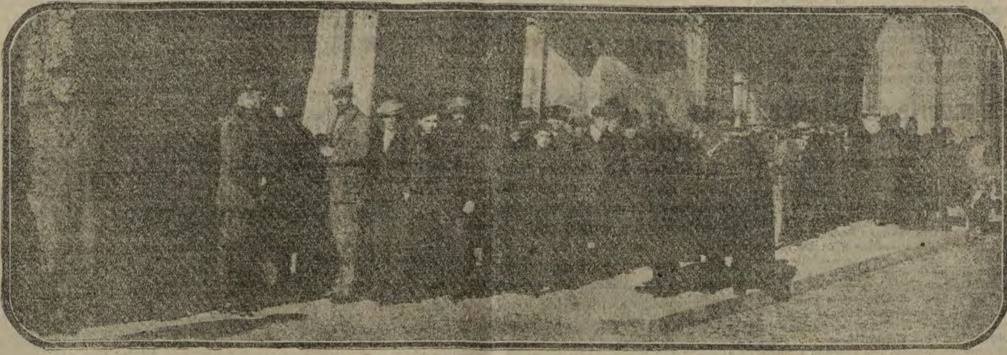
El público formando cola a la puerta del Ayuntamiento de Madrid, para tributar el último homenaje a D. Benito Pérez Galdós.

Señor: El insigne Pérez Galdós ha muerto. La literatura española está de duelo. El Gobierno sabe que Vuestra Majestad analice siempre y en todo momento a los varones ilustres, e interpretando de consuno el sentimiento público, como representación del Estado, anhela dar ante la nación la más alta prueba de respe-