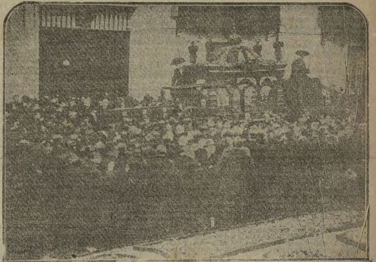
Momento de salir la carroza fúnebre de Galdós, esta tarde, en el Ayuntamiento de Madrid.

Artículo tercero. Por el referido ministerio se dictarán las disposiciones necesarias para la ejecución de este decreto.