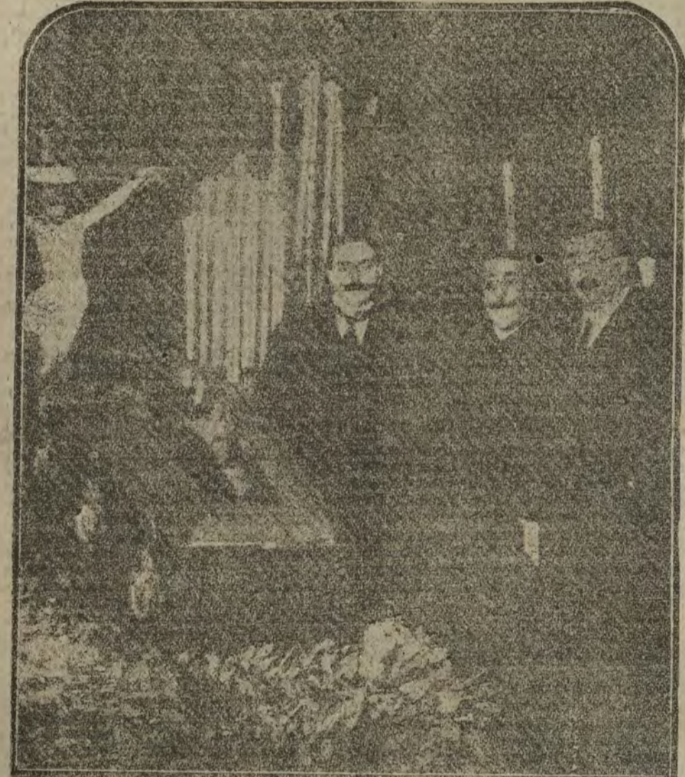
El presidente del Consejo de Ministros, Sr. Allendesalazar, contemplando, en la capilla ardiente instalada en el Ayuntamiento, los restos mortales del insigne Galdós.

Le pregunté, al salir, los móviles de su acto, y me contestó: yo hubiese querido traer una corona como esas que hay en el salón, un ramo de flores, algo para demostrar mi afecto al bondadoso D. Benito, que tanto nos quería a los obreros. No tengo dinero, porque soy abanillado, y con-