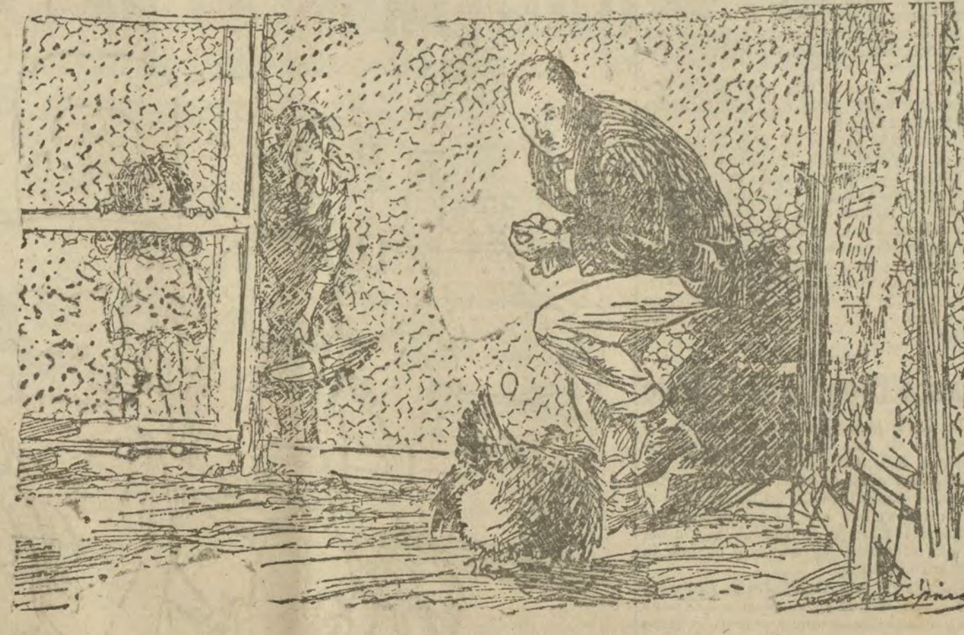
Los niños al padre que ha sido un heroico soldado en la guerra:—No te asustes, papá... ¡No te hará nada!