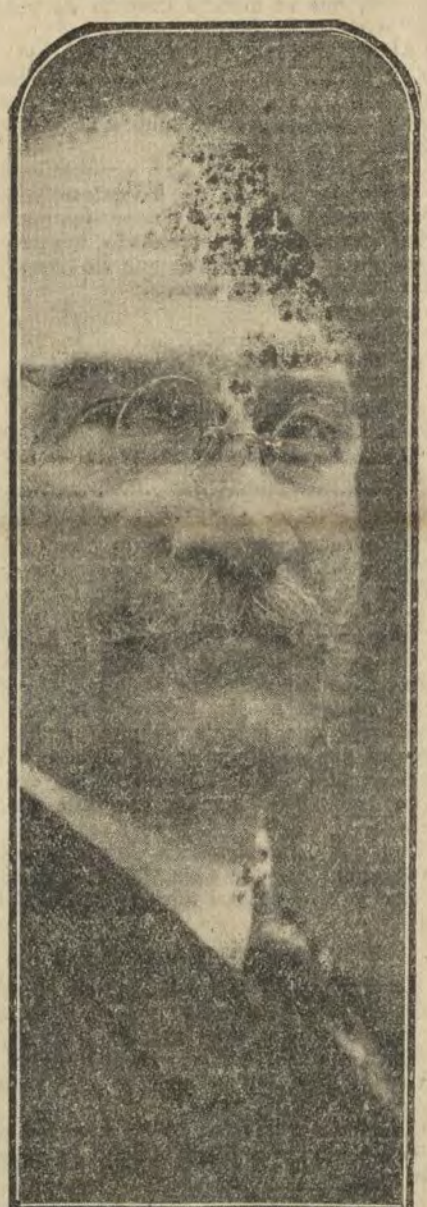
D. Alejandro Lerroux, cuyo discurso de ayer tarde en el Congreso suscita apasionados comentarios.

—¿Y llevas mucho tiempo en la parada? —¡Digo! Ende que comenzó el "lock-out".