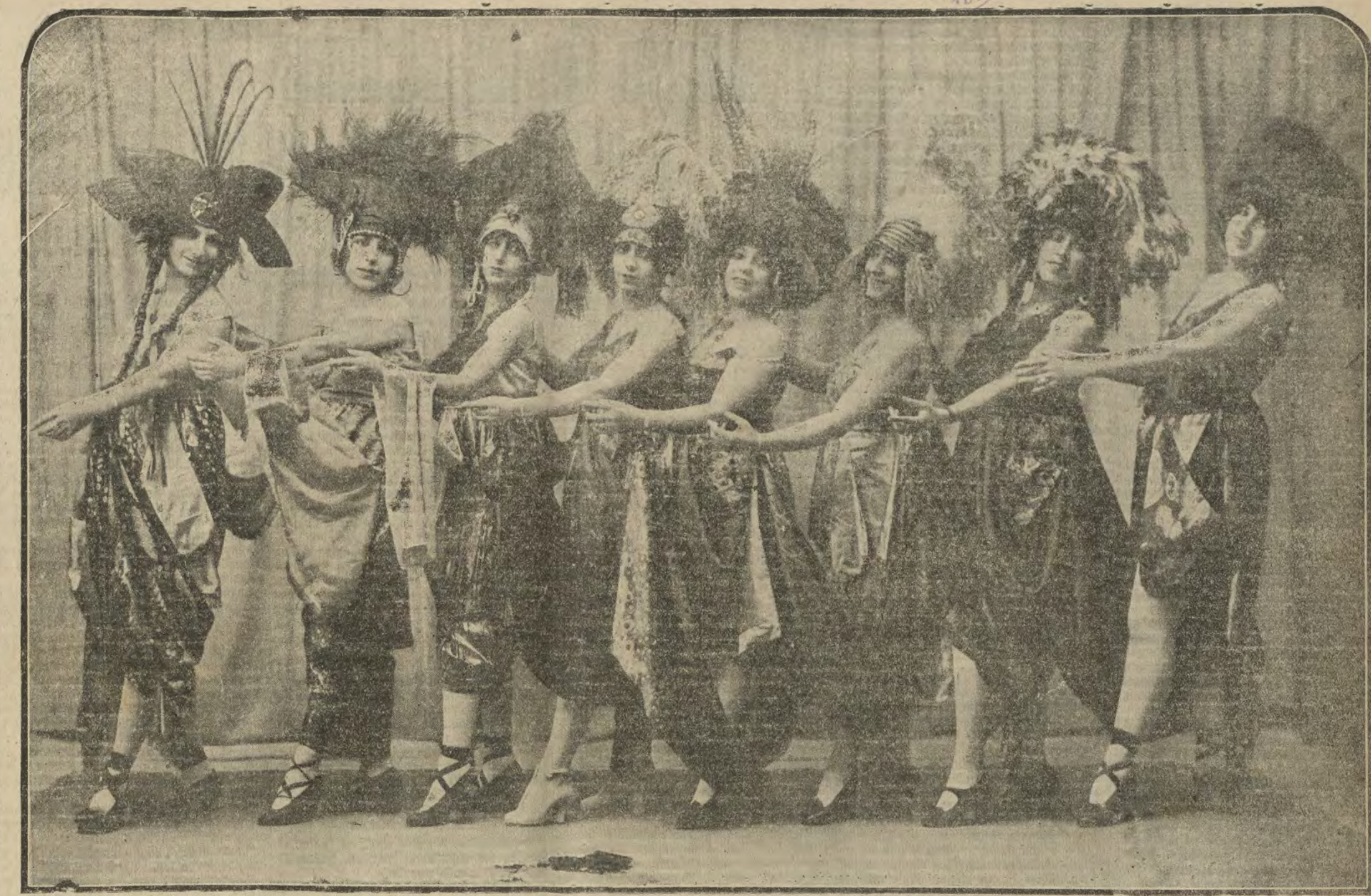
Ocho hermosas mujeres—un doble lute—, en "El As", que se representa tarde y noche en el teatro Reina Victoria.

Han desaparecido los temores de huelga en el conflicto que tenía planteado la Unión de cocheros, por haber triunfado estos obreros en sus demandas a los patronos.