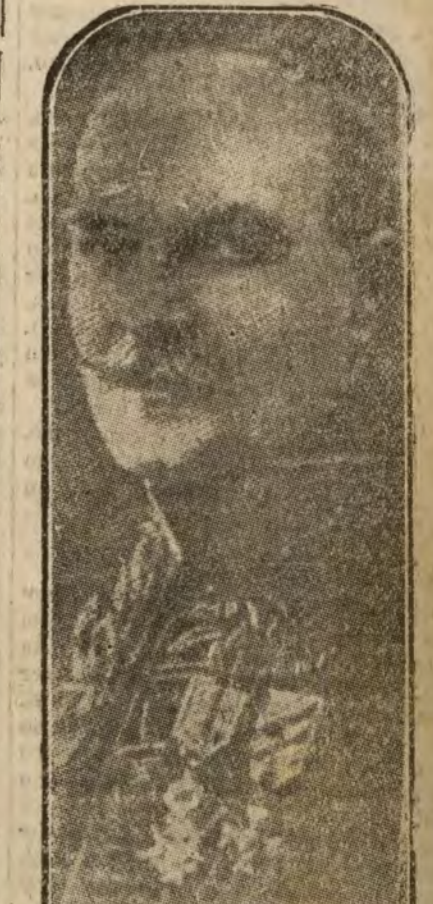
Henry Bordeaux, el popular novelista francés que ha sido elegido miembro de la Academia Francesa.

Después recibió a M. Raoul Peret, presidente de la Cámara de diputados.