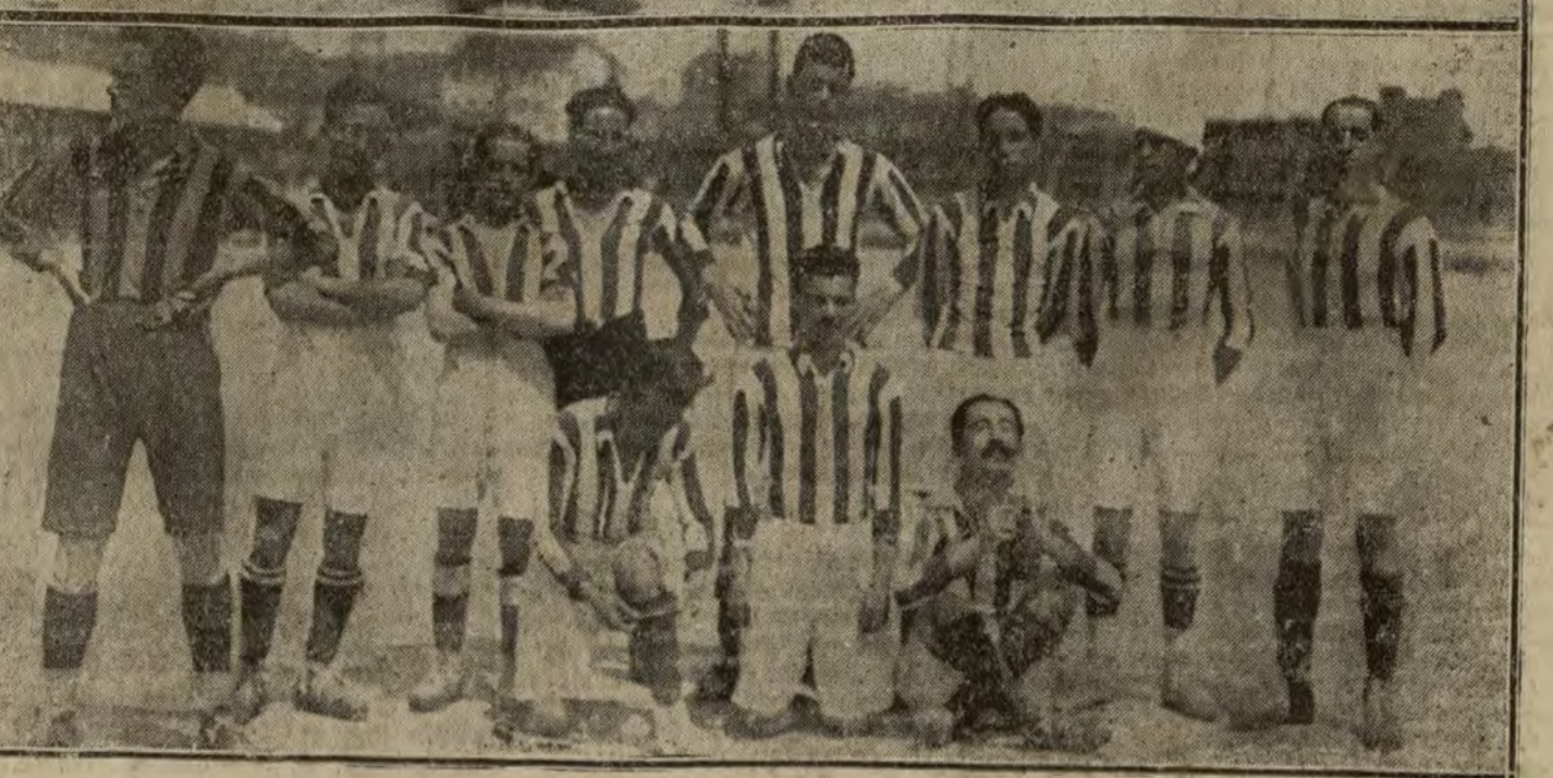
Primero: Equipo del Grupo Deportivo del B. H. A., ganador de la copa "Jesalán".—Segundo: Equipo de la Sociedad Deportiva del C. L., que jugó ayer la final con el del B. H. A.