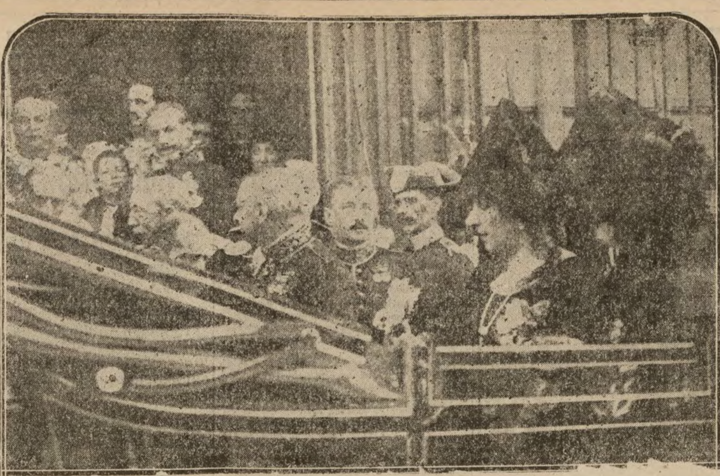
S. M. la Reina D.ª Victoria al salir esta mañana de la Fiesta de la Grandeza Española que se celebró en la iglesia de la calle de la Fior