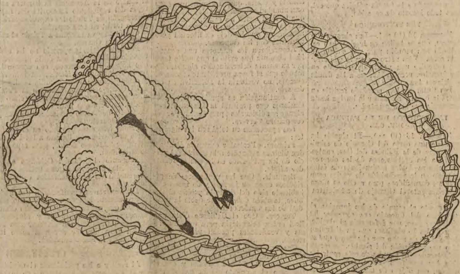
El sacrificio de la res