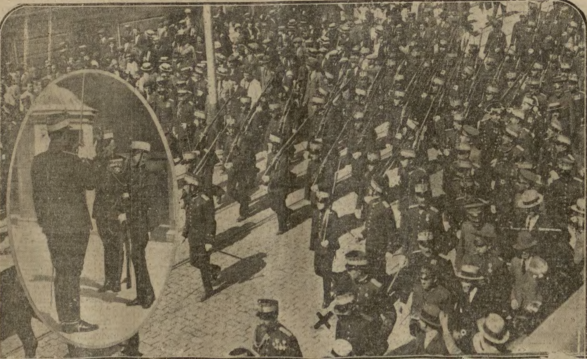
El coronel del Regimiento del Rey recibiendo a S. A. R., el Príncipe de Asturias, para incorporarlo como cabo al Regimiento. La primera compañía del Regimiento del Rey, desfilando por las calles de Madrid

París 15.—El Príncipe Felipe de Borbón ha llegado a París. Se hospeda en el Hotel Ritz.