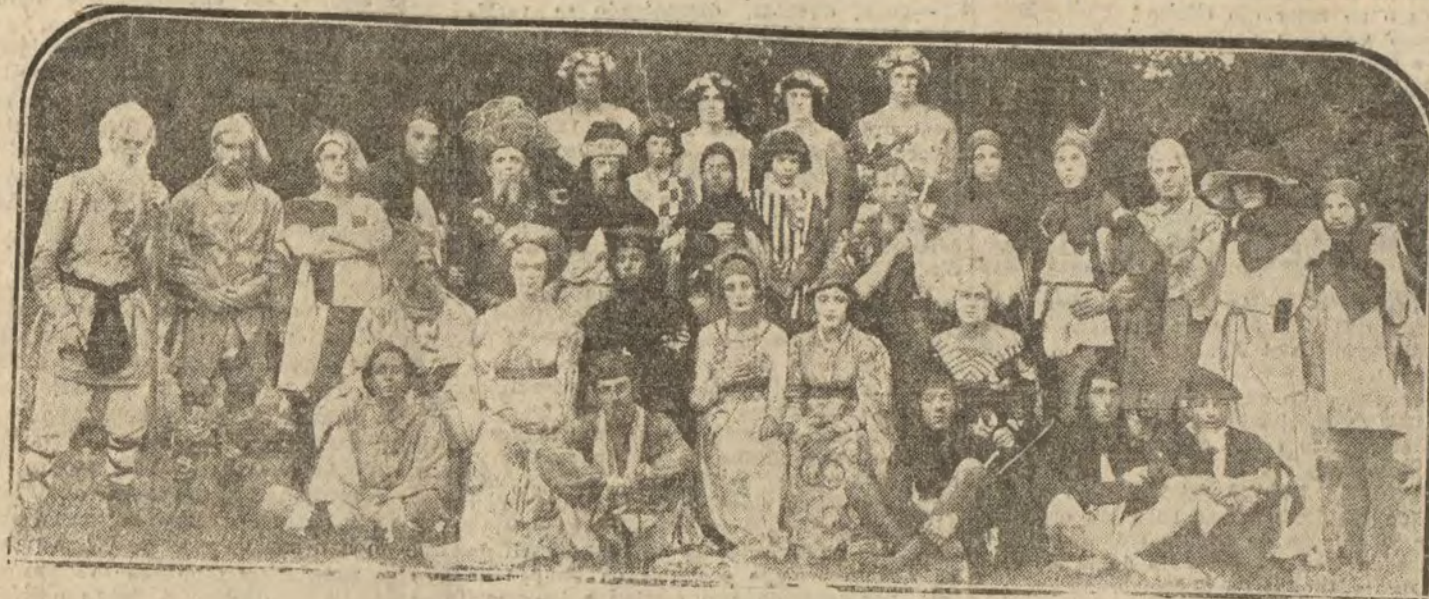
Los intérpretes de la obra "Como amamos la vida", original de la Reina de Rumania, cuyo estreno ha obtenido un exitoso resultado en el teatro de la Ópera de Bucarest, acto al que asistió la Reina escritora.