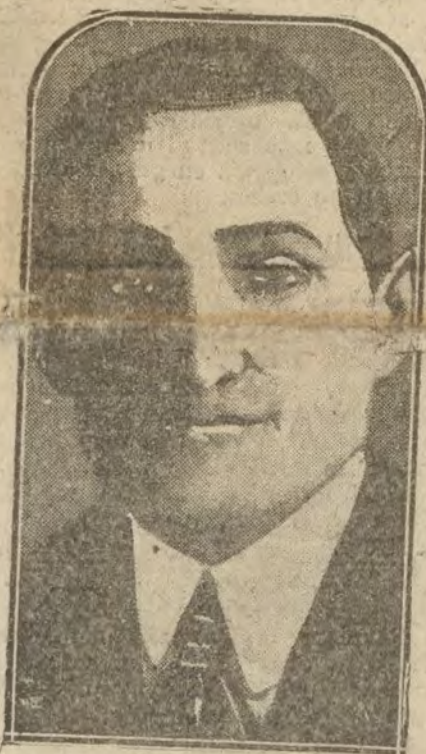
M. Mac-Adoo, yerno del Presidente Wilson, en quien se concentran las probabilidades del triunfo presidencial en las próximas elecciones.

Así. No hay pan, ni agua, ni aceite, ni azúcar... y se destinan 60 millones a embellecimientos! Este Limpia es impagable. A ver, Sr. Dato. Esa gran cruz. Indudablemente ¡se la ha ganado!