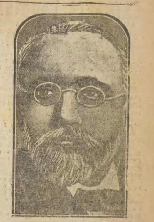
Venizelos, jefe del Gobierno helénico, contra el cual, según sus partidarios, existe un complot preparado por los nacionalistas turcos.