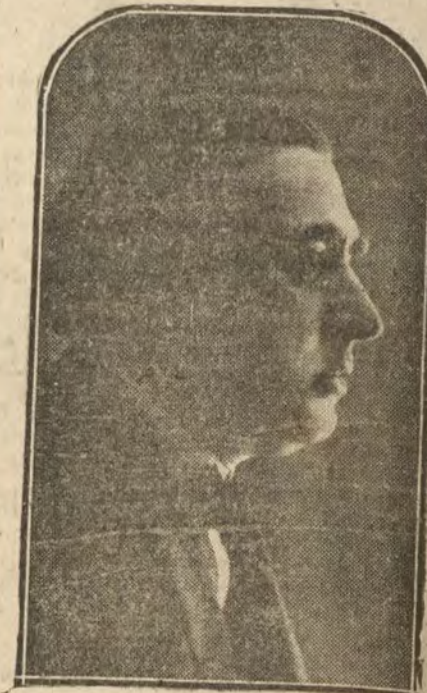
Julio Silva, famoso guitarrista portugués, que dará un concierto el próximo viernes en el teatro Real.