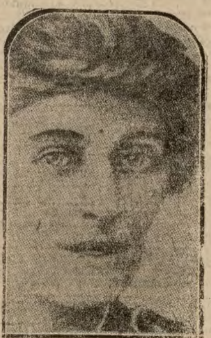
La condesa Markiewitz, primera mujer-diputada del partido sin fin, que ha sido detenida ayer acusada de agitar la opinión revolucionaria.

A nosotros nos toca decir ahora si estamos dispuestos a sacudir la secular modorra y emprender la marcha ascensional hacia los grandes destinos que la están reservados a España.