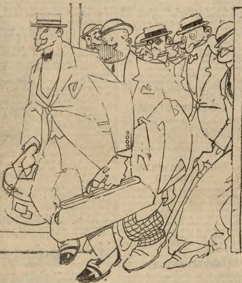
Atracción de forasteros.