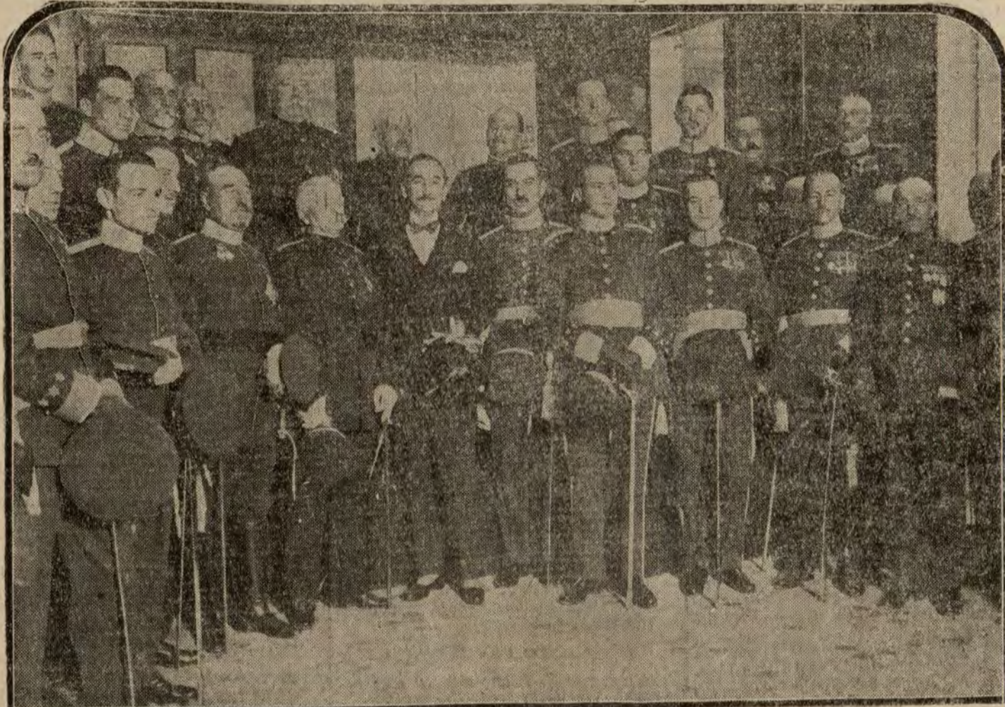
El ministro de la Guerra después de imponer los fajos a los nuevos capitanes de Estado Mayor.

Río Janeiro 30.—La escuadra inglesa del Suratlántico es esperada de momento a otro en Río Janeiro, donde viene a saludar al Rey Alberto.