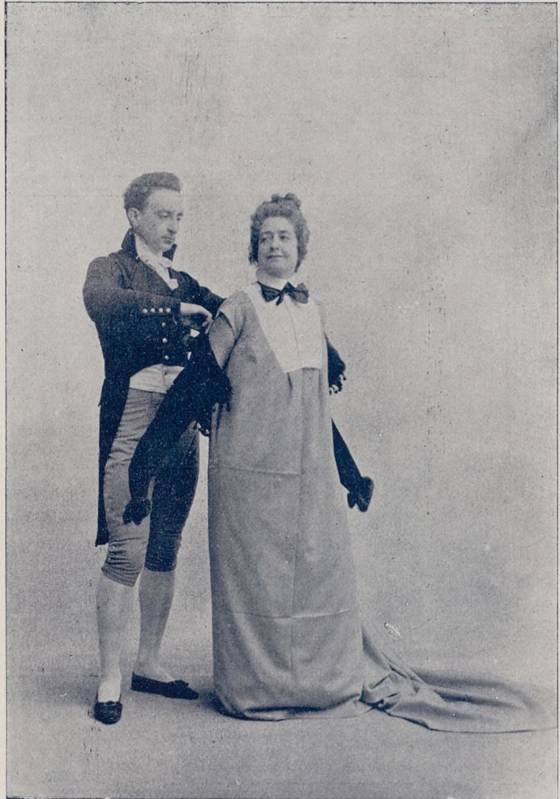
Mme. Sans Gêne y el modisto

Receta para cuando se vean ustedes desdeñados en sus pretensiones amorosas: péguense ustedes un tiro en sitio poético. Quiero decir á la puerta de la casa de la dama. Es probado: las mujeres se pirran por proteger al herido. ¡Pobre del amante si se opone. ¿Quién es él para oponerse? Un hombre vulgar y sanote; sin agujeros ni nada..... Este mundo es así; todo caridad.