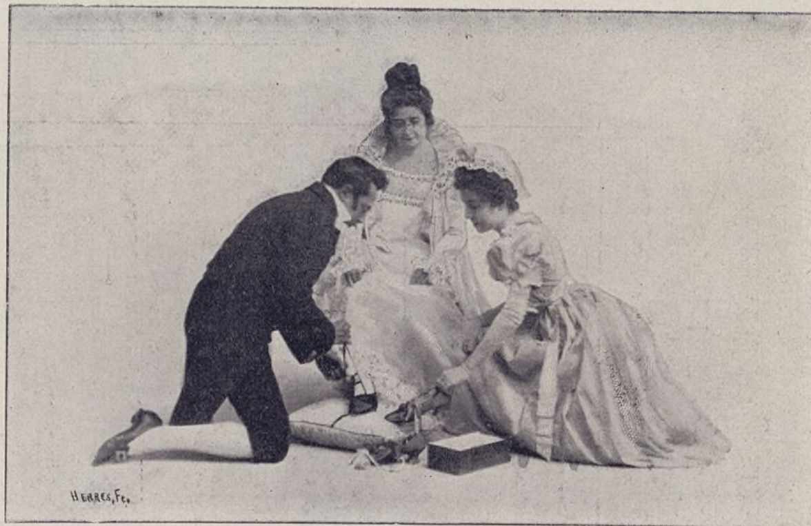
2—Mme. Sans Gêne y el zapatero

1—Es incalculable lo que produce eso de lavar bien la ropa blanca. Ahí tienen ustedes á los esposos Lefèvre de mariscales del Imperio. Nada menos. Si lo supieran las niñas del Pinar de las de Gómez pasarían la mañana dándole «á la muñeca y al paletín». Llevarían mejores bajos y se casarían antes. Porque este mundo es así, tan moral, niñas del tijus .