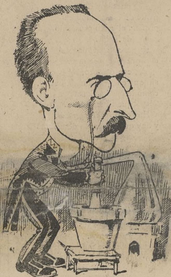
Lo malo es que cuando se habla de crisis pierdo el tino hasta para majar, aunque parezca mentira.