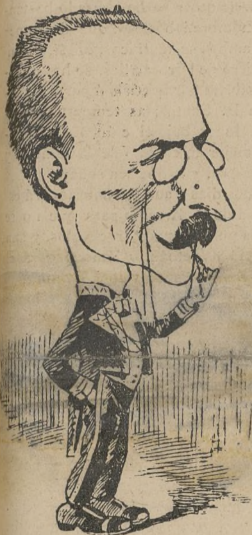
Decididamente esto de ser ministro es cosa rica.