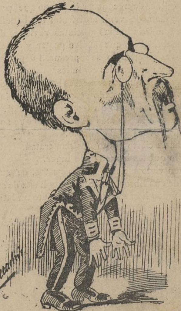
¡Ah! (suspirando) :Qué peso se me ha quitado de encima!

AL BEBE PARISIEN Para juguetes y colocación de cabezas de bebés. (Prente al Ministerio de la Guerra).