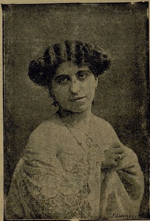
LEONOR DE FRUTOS Notable coupletista española.

Contratación: Artístico-Cinematográfica.