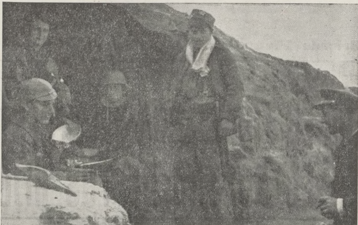
Comemos bien y estamos contentos por ver pronto nuestra victoria, esto le dicen al Comisario general de la Brigada, estos camaradas de las primeras líneas.

Las trincheras no pueden ser en modo alguno, el lugar de exhibición de la hermana, de la novia o de la amiga.